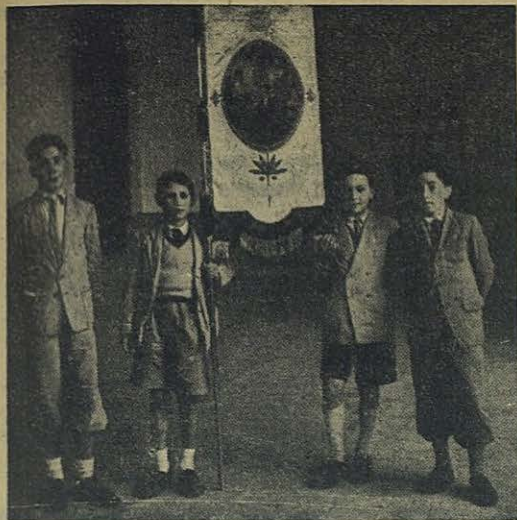
Los vencedores en el Certamen Catequístico de la Inspectoría Tarraconense