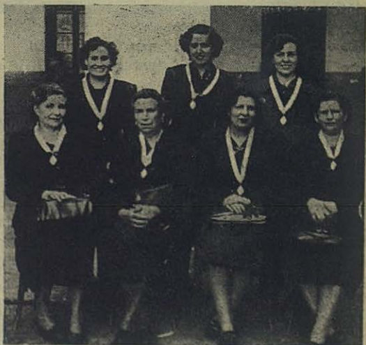
GERONA.—Damas protectoras del Oratorio Festivo, muy bien organizado y muy floreciente.