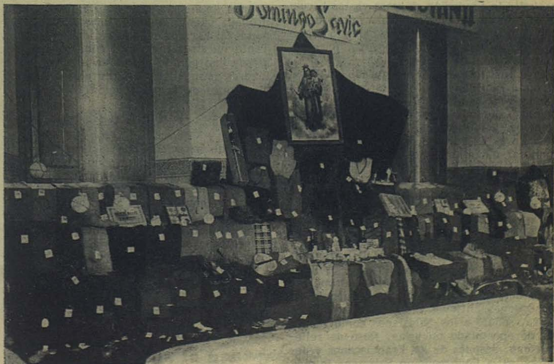
GERONA.—Vista de la exposición de premios en el Oratorio Festivo Salesiano, debidos a la generosidad de los bienhechores y repartidos en una hermosa fiesta de gran ambiente salesiano