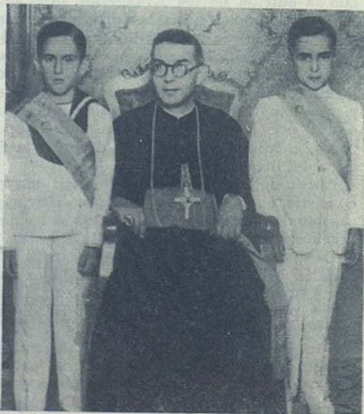
El excelentísimo y reverendísimo señor Obispo de Solsona entre los dos emperadores del Catecismo del Colegio Salesiano de Burriana

Haad-Yai es una ciudad moderna, de mucho porvenir, pues se halla en la desembocadura hacia el mar de las principales zonas mineras. Comenzó a construirse hace unos treinta años, y su población es china en su casi totalidad.