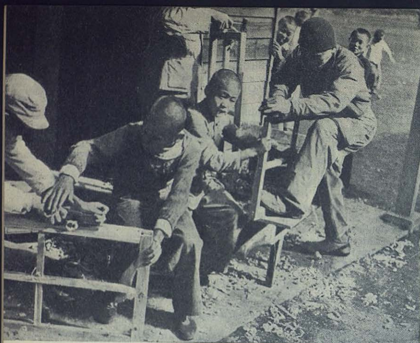
TOKIO - KOKU-BUNJI (Japón). — Aprendices de carpintero trabajando en la reconstrucción y ampliación de su propio Orfanato.