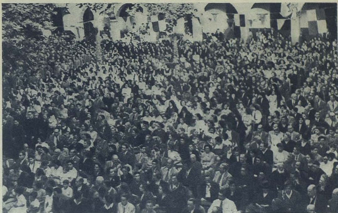
BARCELONA.—Un aspecto del patio interior de las Escuelas Profesionales de Sarrià durante el acto celebrado en honor del Beato Domingo Savio el día 13 de junio

de Asti a visitar una tía suya paterna, allí se los dejó seguramente olvidados, y allí quedaron hasta hace pocas semanas que fueron descubiertos.