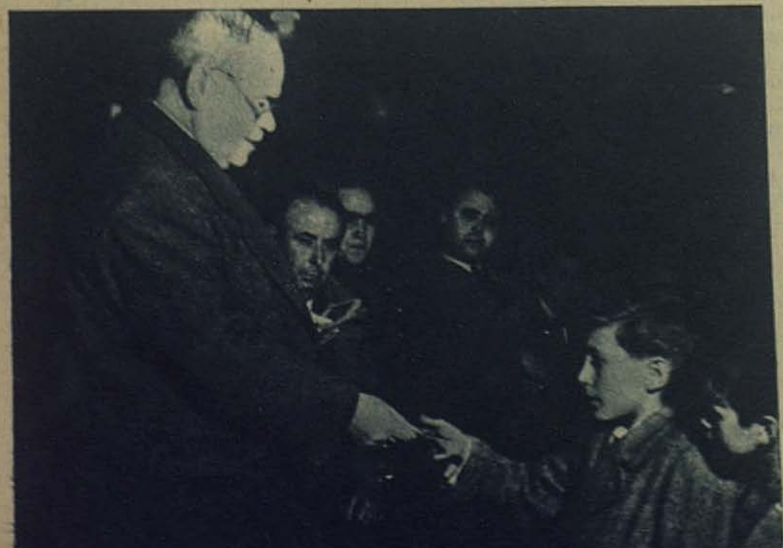
El excelentísimo señor alcalde de Utrera repartiendo billetes de 25 pesetas a los niños más aplicados de las Escuelas Salesianas