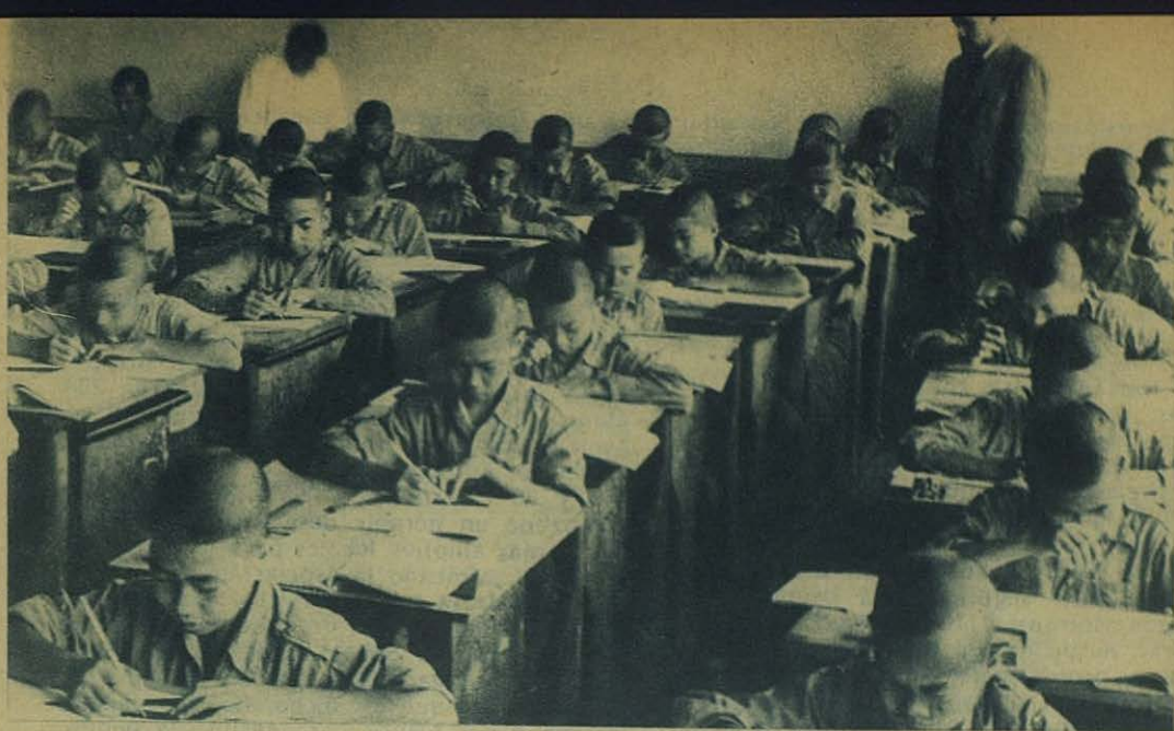
HONG-KONG (China).—Alumnos del Orfanato Salesiano en el estudio