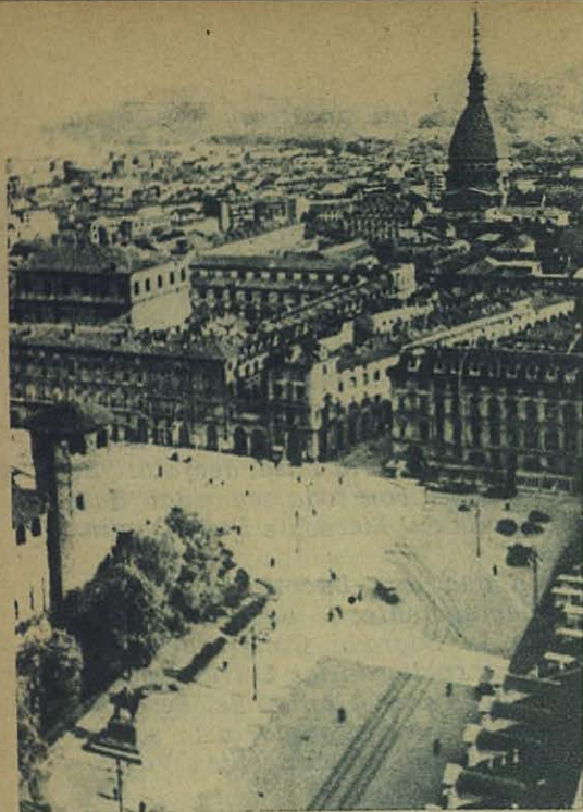
Una vista de la ciudad de Turín. Por sus calles peregrinaron entre dolores, hace un siglo, San Juan Bosco, San José Caffasso, San José Benito Cottolengo, Domingo Savio... El Cielo y el tiempo les han dado el triunfo más rotundo

útiles las quejas de grandes hombres católicos, beneméritos de su patria; inútiles los artículos ponderados y fogosos de los periódicos... Uno de éstos, la "La Armonía", fué suspendido, secuestrado y condenado; los predicadores cuaresmales, amenazados y molestados; algunos tuvieron que dejar de predicar... El diario "La Gazzetta del Popolo", rabiosamente anticlerical, después de insultar descaradamente a los senadores y diputados católicos, cantaba impudicamente su triunfo.