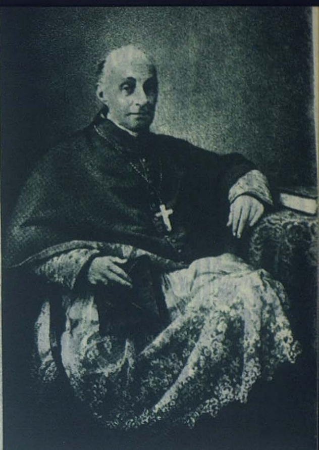
Monseñor Fransoni, Arzobispo de Turin, una de las víctimas de la persecución sectaria

Era éste, al igual que en los demás Estados católicos, el más antiguo de todos los Tribunales del Piemonte; su fundamento se basaba en el derecho y en la justicia según aparece, con toda claridad, en las Sa-