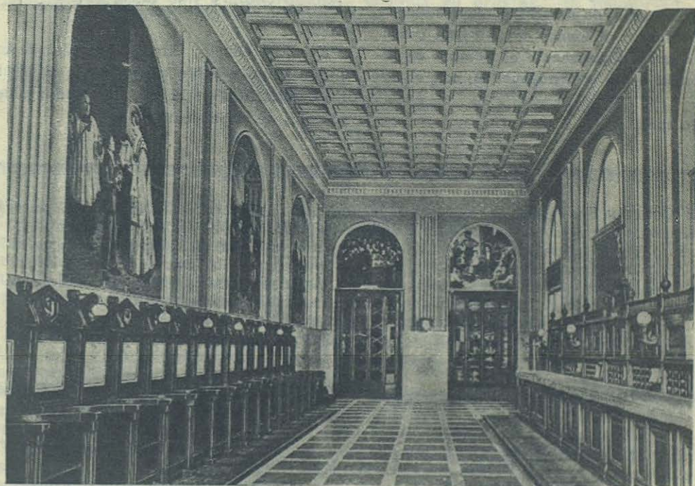
LA BASILICA DE MARIA AUXILIADORA, en Turín

Sacristía del Santuario con cuadros que representan es- cenas de la vida de Don Bosco