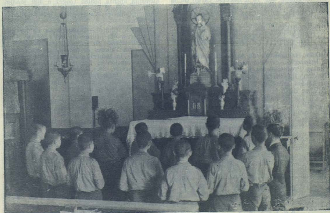
Hong-Kong (China).—Un grupo de Aspirantes Salesianos rezando ante el altar de San José. Pidamos también nosotros, a fin de que puedan ver un día realizados sus ideales: ser apóstoles de su atribulada Patria

Además, M. Robert ha dotado a la Escuela