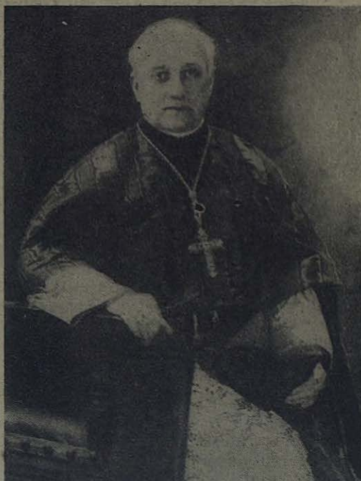
El Emmo. y Revmo. Cardenal Benito Luis Masella, que, por nombramiento de S. S. el Papa, ha sido hecho Protector de la Congregación Salesiana, de la que siempre fué gran admirador y amigo

No nos han faltado, y no nos faltan, pruebas y dolores. Dos meses ha, la muerte nos arrebató a nuestro segundo Cardenal, el Emmo. Dr. D. Augusto Hlon, Primado de Polonia, poniendo en consternación a toda esa heroica nación, que le llamaba «Padre de la Patria». El Purpurado cerró el curso de su vida con estas edificantes declaraciones: «Hoy es el 22 de octubre, día de la Virgen de la Buena Muerte. Hoy moriré... La muerte debe ser acogida con la sonrisa. Es el paso a una vida mejor, el paso a la eternidad. Yo me mar-