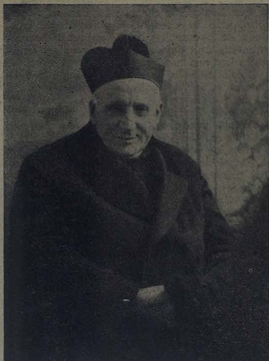
El Siervo de Dios don Felipe Rinaldi, III Sucesor de San Juan Bosco