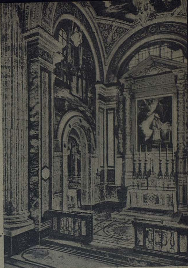
Altar dedicado a San Francisco de Sales en el Santuario de María Auxiliadora, en Valdocco (Turín), levantado por San Juan Bosco

San Francisco de Sales le facilitó más tarde la erección de la gran Basílica a la Madre del Amor Hermoso, a María Auxiliadora —que también las bombas respetaron mila-