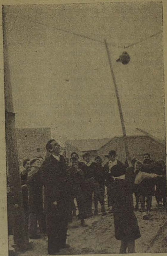
He aquí una animada y típica diversión del Oratorio Festivo, dirigida por un joven catequista

El Catequista que está en contacto directo y frecuente con los oratorianos