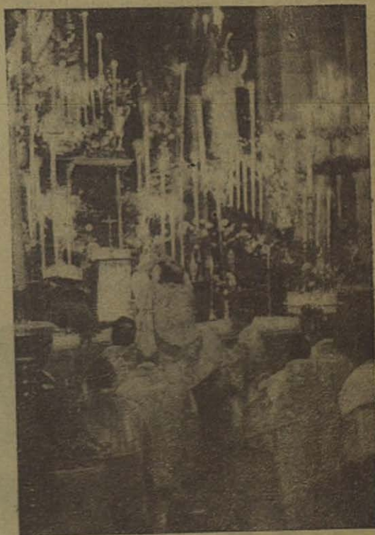
RONDA.—El momento de la Elevación en la Misa Solemne

Los equipos de altavoces, colocados estratégicamente en distintos puntos de la Ciu-