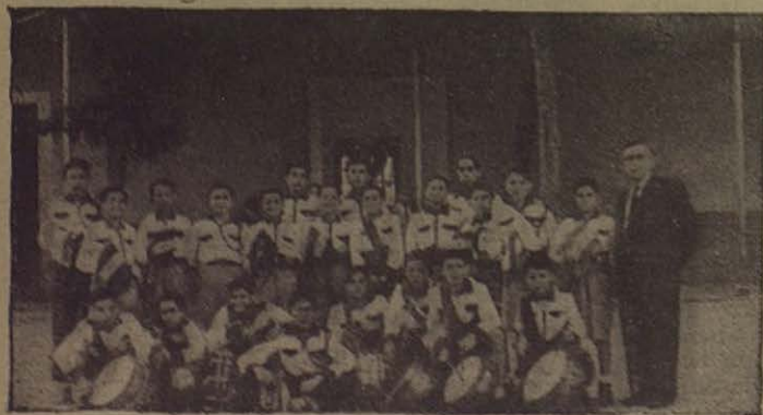
CÓRDOBA.—La Banda Salesiana de cornetas y tambores que tanta realce presta a las solemnidades religiosas y escolares

La imagen de San Juan Bosco era portada por los alumnos del séptimo curso de Bachillerato del Colegio del Sagrado Corazón; María Auxiliadora aparecía en una artística carroza adornada con profusión de ángeles y de flores, siendo saludado el paso de ambas