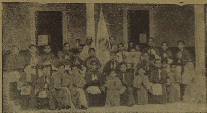
CÓRDOBA. — El "Pequeño Clero", integrado por alumnos de nues- tras Escuelas de esta ciudad

imágenes por nutridas lluvias de flores.