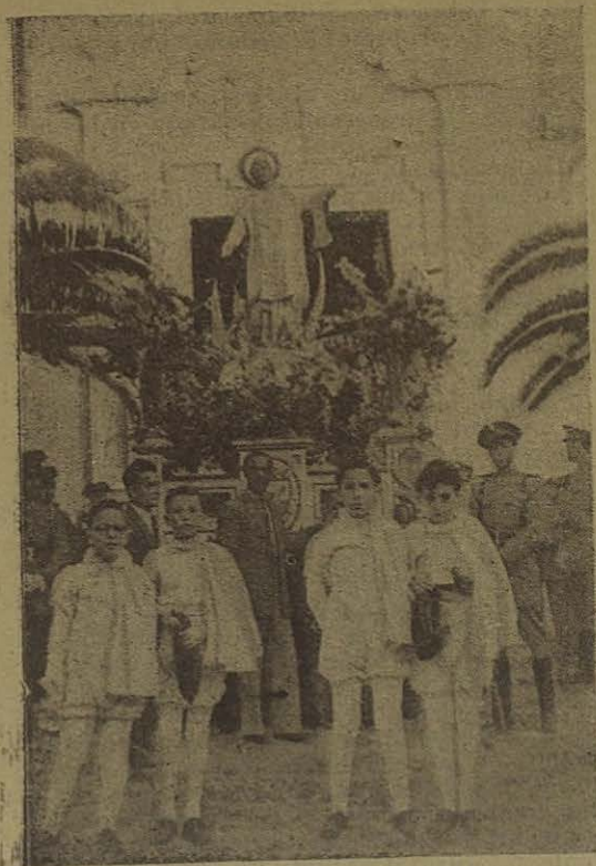
CÓRDOBA.—La estatua de San Juan Bosco saliendo de la iglesia para la procesión de María Auxiliadora