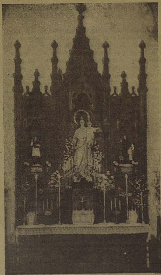
UBEDA. — Hermoso altar "salesiano", erigido por los Antiguos Alumnos que viven en esta ciudad, a donde todavía no han llegado los Salesianos de Don Bosco

Las estadísticas nos declaran el grado de madurez de la nueva diócesis, que puede ponerse entre las principales de Chile en cuanto al servicio religioso se refiere. En un territorio de 180.000 kilómetros cuadrados, habitado por 55.000 almas, hay treinta y tres sacerdotes, siete parroquias y veinte lugares del culto. Iglesias grandes e imponentes como el Santuario de María Auxiliadora, que mide 60 x 24, con su campanario, órgano, artísticas vidrieras, altares con mármoles de Carrara; florecientes Asociaciones y un completo cuadro de la organización de la Acción Católica. Ocho Colegios con enseñanza primaria, secundaria y profesional, dirigidos por Salesianos e Hijas de María Auxiliadora, educan un conjunto de más de 2.600 alumnos, esto es, más de un tercio de la población escolar; cursos regulares de re-