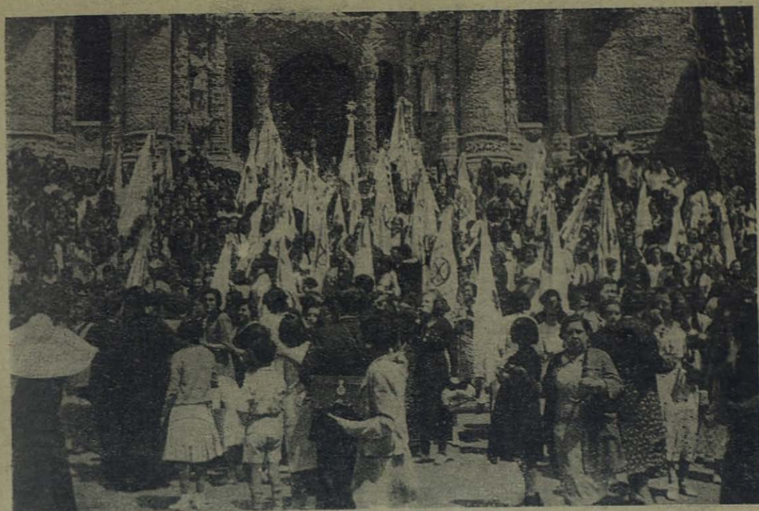
TIBIDABO (Barcelona).—Acaba de llegar una peregrinación al Templo Nacional Expiatorio del Sagrado Corazón de Jesús