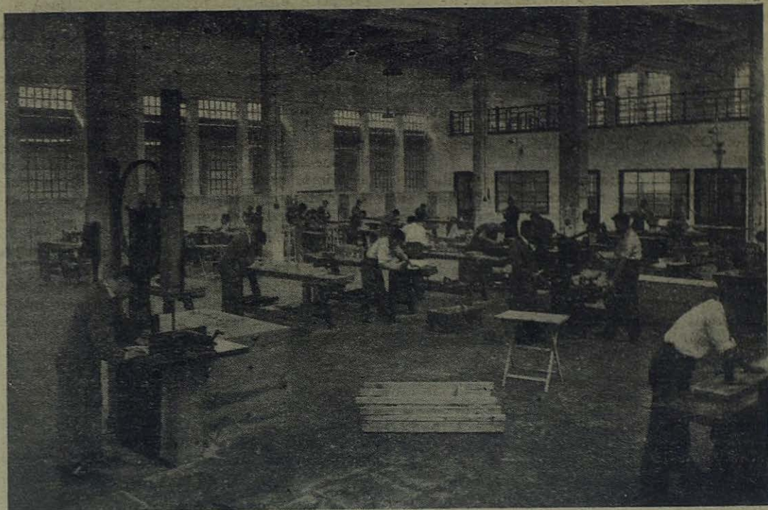
BILBAO-DEUSTO.—Taller-escuela de carpintería de las Escuelas Profesionales Salesianas

respondientes cursos o grados, por cada uno de los cuales deberán pasar sucesiva y ordenadamente los alumnos de tal manera, que al concluir el aprendizaje se hallen en posesión completa de su oficio.