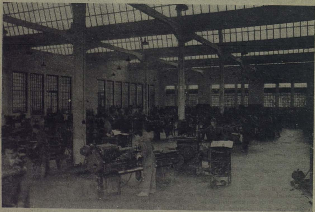
BILBAO-DEUSTO.—Vista general del taller-escuela de mecánica, sección de máquinas

... El Consejero profesional y el maestro de arte dividirán, o bien se ajustarán, a la división previamente hecha de los ejercicios en series progresivas para los co-