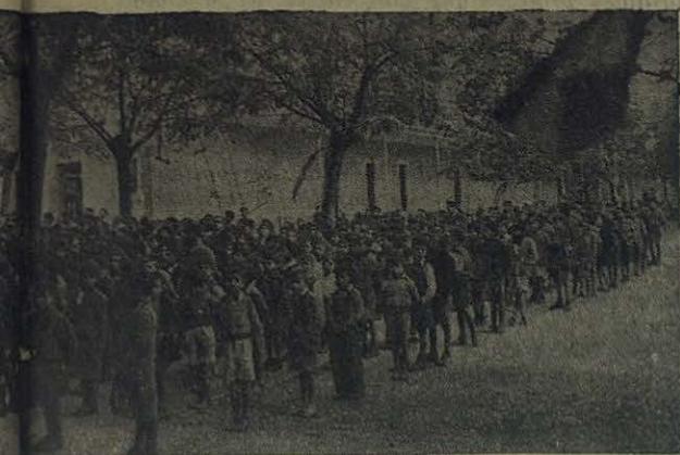
Las Salesianas esperando a que dé comienzo obsequiados por las generosas bienhechoras

verles de los elementos indispensables de apostolado.