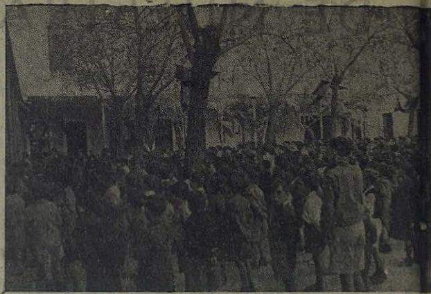
CÓRDOBA.—Los centenares de niños de las Escuelas de la Misión reciben el reparto de prendas de vestir con que fueron

No faltan. Entre las principales hay que citar el clima mortífero de Bengala y del Assam, que, según estadísticas serias, es de los peores de la India, y de tal manera debilita al misionero, que le hace fácil presa del tifus, de la malaria, de la disenteria y de otras no menos graves enfermedades tropicales. Añádase a ésta la dificultad de la lengua, ya que