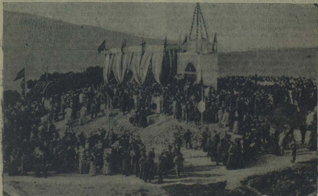
Así fué la inauguración de la capillita al Sagrado Corazón de Jesús en la entonces desierta cumbre del Tibidabo

Cuando el demonio tentador se la ofrecía no quiso, no pudo aceptarla. Ahora que es España su nación predilecta, quien se la ofrece quiere y puede aceptarla. Desde entonces el Corazón Divino de Jesús habita las soledades del monte, prisionero de amor. Tiene por puerta una reja, y tras ella da audiencia a los peregrinos que van a visitarle, a contarle sus penas y a pedirle gracias.