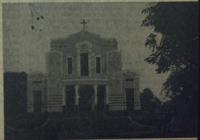
TEZPUR (India). — Fachada de la bellísima iglesia de la Misión Salesiana

Tanto los Salesianos como las Hijas de María Auxiliadora no han regateado sacrificio alguno para atender a los soldados heridos, a los