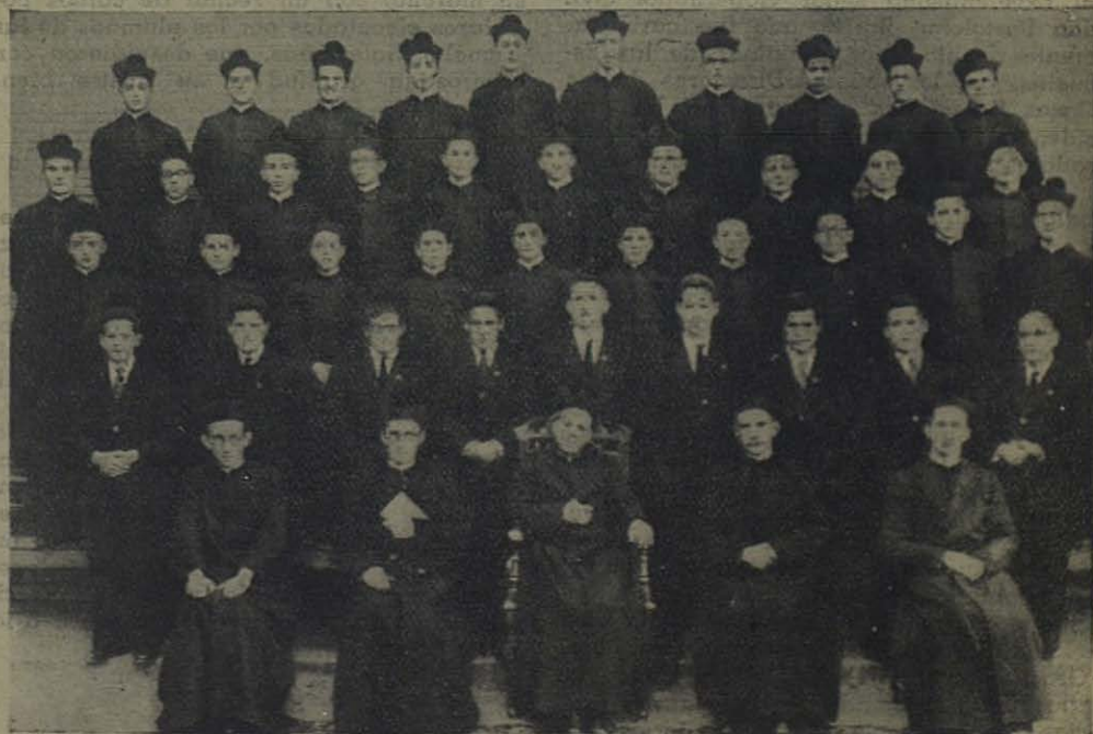
1 MOHERNANDO (Guadalajara).—Novicios de la Inspectoría Cética Salesiana

(De las «Memorias biográficas». Volumen II, cap. LX.)