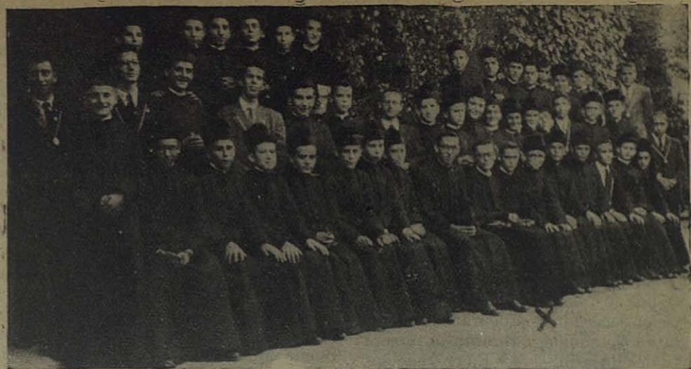
SAN JOSE DEL VALLE (Cádiz).—Los Novicios de la Inspectoría Bética Salesiana rodeando a su nuevo señor Inspector

salvación eterna fueron el móvil de su vida, toda llena de heroicos sacrificios. «Un Ejército que se me pusiera delante no sería capaz de detenerme cuando está de por medio la salvación de las almas». «Buscad almas, no dineros ni dignidades ni honras», les dice a sus misioneros como primero entre veinte prudentísimos consejos.