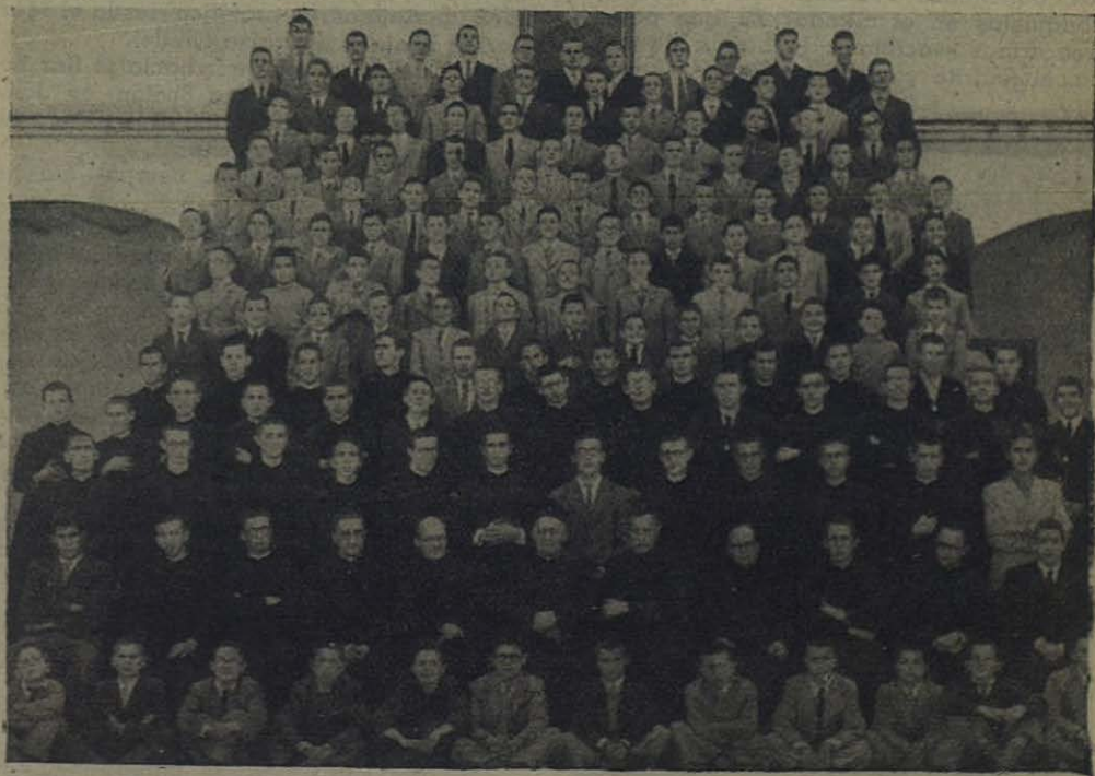
SAN VICENTE DELS HORTS (Barcelona).—Novicios aspirantes de la Inspectoría Salesiana Tarragonense