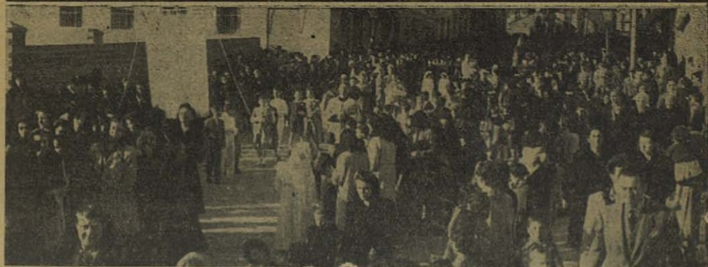
María Auxiliadora triunfa también en la barriada de Estrecho (Madrid).

dosa al par que solemne procesión, que concluyó con unas encendidas palabras del Padre Superior de la Misión y la Bendición con S. D. M. Al despedirse, los niños y niñas recibieron un panecillo.