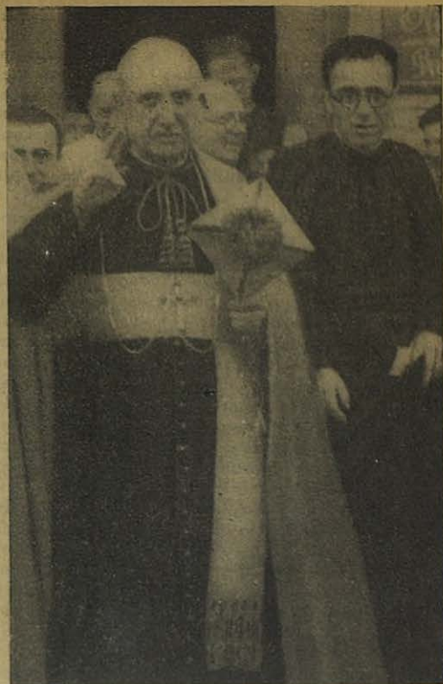
El Excmo. Sr. Arzobispo de Zaragoza al salir de la capilla salesiana.

El Arzobispo de Milwaukee (al norte de los Estados Unidos) ha fundado un gran colegio secundario para varones, que ha querido llamarlo Colegio Superior Don Bosco, del cual, por falta de Salesianos, se ha hecho cargo una Congregación muy acreditada en la enseñanza.