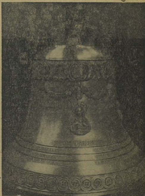
TIBIDABO: Campana recientemente bendecida.