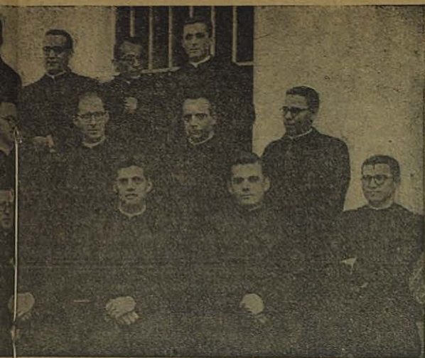
Los nuevos sacerdotes salesianos.