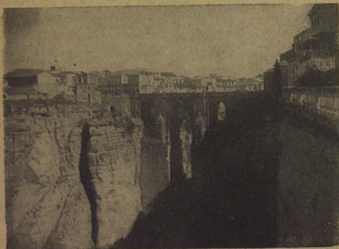
RONDA: Una de las ciudades más salesianas de España, que recibió también la gloria de contar con varios mártires entre los hijos de don Bosco. A la derecha del famoso Tajo, y en primer término, se puede ver parte de la Casa para salesianos enfermos; una bendición, tal vez, de nuestros mártires.

¡Ungidos del Señor! ¡Legionarios de Cristo Rey! Habéis ido a ocupar tronos vacíos; a empuñar palmas que esperaban manos vencedoras; a ceñir en vuestras frentes coronas de justicia y de inmortalidad.