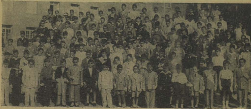
MADRID: Niños del Oratorio Salesiano de Atocha, que hicieron la Primera Comunión el día 23 del pasado mayo.

Minutos después, aquel hormiguero de vendedores comentaba intrigado el extraño suceso. Los pareceres se hallaban divididos; pero a pesar de la «oposición» el pequeño «sciuscià» cumplió la promesa hecha y se presentó en el Oratorio Salesiano. Mas no iba solo: le escoltaban otros veinte compa-