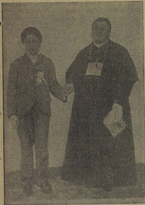
El Cardenal Cagliero, el «Civilizador de la Patagonia», con el Siervo de Dios Cesferino Namuncurá, la más bella flor de las Misiones Salesianas.

Los estudiantes salesianos de Teología se lanzaron con entusiasmo al apostolado entre los «chicos de la calle». Divididos en grupos, comenzaron a recorrer la ciudad en busca de los «sciucià», mientras otros se ocupaban en adquirir los víveres, tendiendo la mano, implorando la caridad de las per-