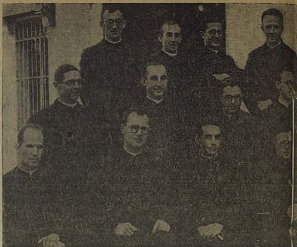
CARABANCHEL ALTO (Madrid):

También de esta ciudad se puede afirmar que crece de año en año su fervor y entusiasmo por honrar a la Virgen de don