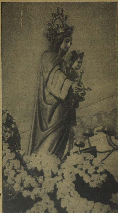
María Auxiliadora, sobre un trono de flores, paseó maternal y soberana entre las aclamaciones y vítores de sus hijos amantes de la ciudad de Málaga.

Por la tarde, a las siete, fué sacada procesionalmente la sagrada imagen de María Auxiliadora, y acompañada de inmenso gentío, lleno de recogimiento y fervor religioso, recorrió el itinerario de costumbre, en cuyo trayecto habíanse improvisado varias mesas o altares, que esperaban a María San-