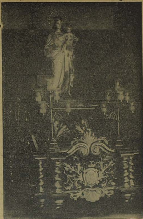
Nueva y magnífica carroza sobre la que María Auxiliadora paseó triunfante por su barriada de Atocha (Madrid).

El descubrimiento del primer pozo de petróleo en Chile, en Tierra del Fuego (29-XII-1945), coincidiendo con el IX Con-