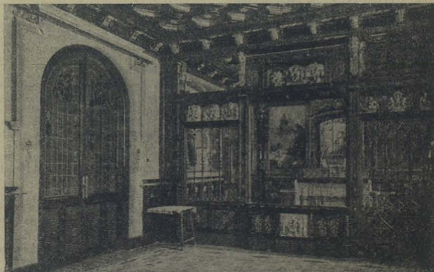
BARCELONA: Las habitaciones de San Juan Bosco convertidas en capilla.