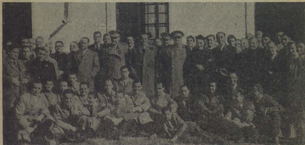
CORDOBA: Autoridades y algunos Antiguos Alumnos asistentes a la fiesta de San Juan Bosco.

Por la tarde tuvo lugar la consagración de todos los niños a San Juan Bosco y un acto recreativo a cargo de los Antiguos Alumnos.