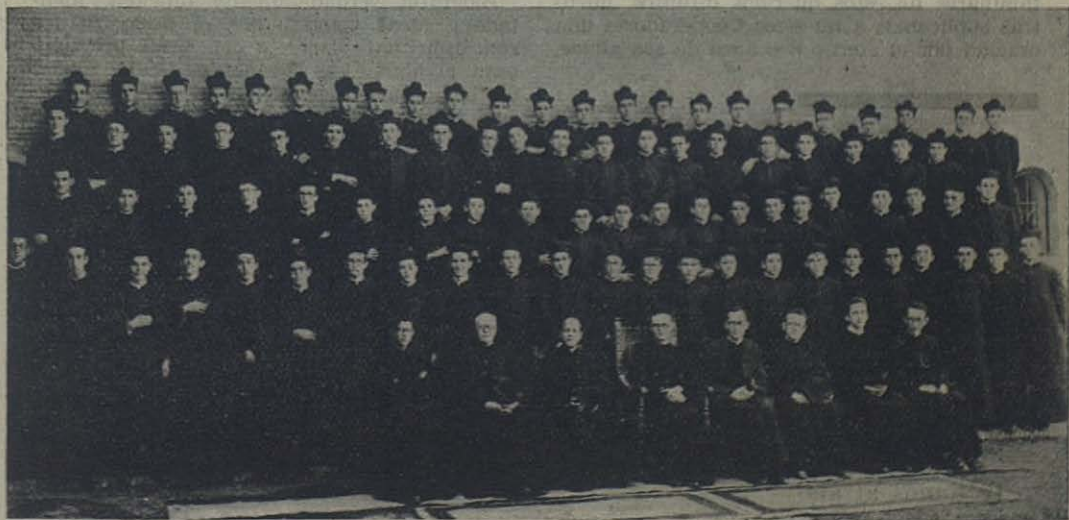
MOHERNANDO (Guadalajara): Novicios y Estudiantes de Filosofía de la Inspectoría Cética Salesiana.