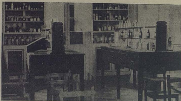
CÓRDOBA: Laboratorio de Química, inaugurado en el Colegio Salesiano con ocasión de la fiesta onomástica de su Sr. Director.