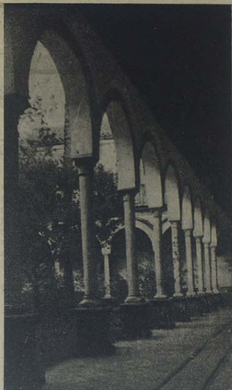
UTRERA: Claustro del Convento de Nuestra Señora de la Consolación.

Los alumnos de las Escuelas Profesionales de Cádiz pasaron muy agradablemente uno