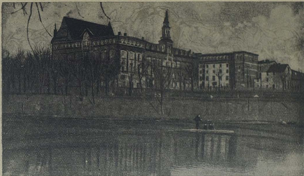
OSWIECIM (Polonia): Uno de los colegios salesianos destruidos por la guerra.

1.º, los huérfanos y jóvenes abandonados acogidos en nuestras casas; 2.º, las vocaciones, hoy más que nunca necesarias para la reconstrucción religiosa y moral de la atribulada Humanidad; 3.º, las Misiones, que desde hace seis años esperan anhelantes personal y socorros para reemprender sus actividades.