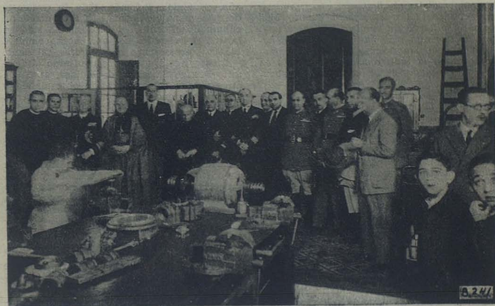
Cádiz: Las dignísimas autoridades que con su presencia dieron realce al acto de la inauguración de la nueva Escuela de Mecánica.

Nuestro amor a los jóvenes y nuestra conciencia no podían consentirlo. Como tampoco podíamos acallar por más tiempo las voces de mando y consigna que por parte de autoridades y jerarquías nos llaman con apremio a tomar en nuestras manos la Dirección de otras escuelas de Formación Profesional; y esto nos es absolutamente imposible si no formamos antes nuestro personal técnico: el salesiano obrero, esa creación genial de San Juan Bosco, ese caballero cruza-