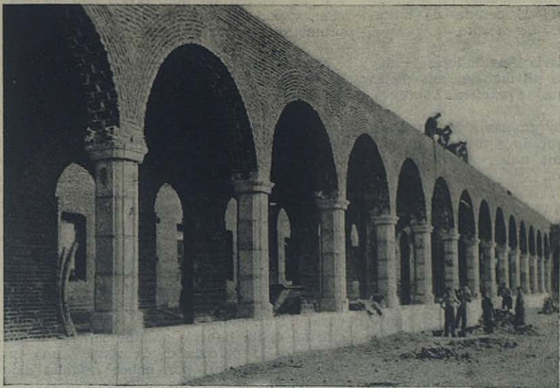
ARÉVALO (Ávila): Estado de las obras del nuevo Seminario Sa- lesiano.

Las obras del Seminario de Arévalo se van realizando de verdad con extraordinaria rapidez. Impacientes contemplan la subida de los muros cerca de trescientos muchachos, aspirantes latinistas, esparcidos hoy, por falta de sitio, en cuatro Casas Salesianas. ¿Cuándo podrán reunirse bajo el mismo techo todos esos jóvenes? Una vez más llamamos la atención de nuestros beneméritos Cooperadores sobre esta obra tan necesaria para el desarrollo de la Congregación Salesiana en el Centro y Norte de España.