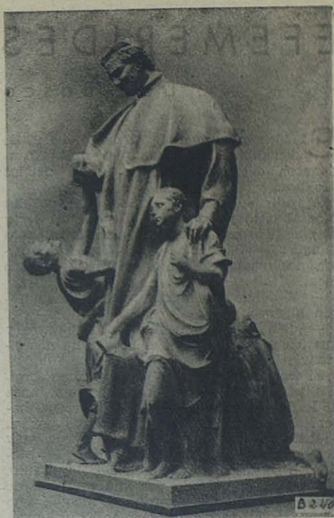
Don Bosco, nacido para los jóvenes, se sentía feliz en medio de ellos...

Concluamos con otra reflexión, no menos eficaz que las anteriores, para inculcarnos muy hondamente grande estima y respeto hacia el niño. Aunque tengamos que habérmolas con un niño lleno de defectos y de pequeñas bellasquerías, hemos de entender que no sólo tiene la potencia, sino también la docilidad suficiente para secundar a quien le corrige, y de hecho se enmienda abandonando sus caprichos y