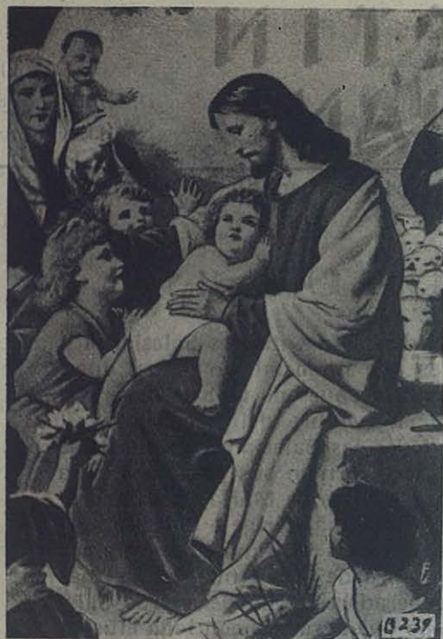
El Divino Maestro gustaba de rodearse de niños...

co Maestro de los hombres, señalando hacia los niños, dijo un día: «Videte ne contemnatis unum ex his pusillis: Guardaos de despreciar a ninguno de estos pequeñuelos.» (Mt. XVIII, 10.)