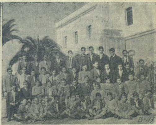
Novicios de San José del Valle y Aspirantes coadjutores de Cádiz, florida, esperanza de la Inspectoría Salesiana Bética.