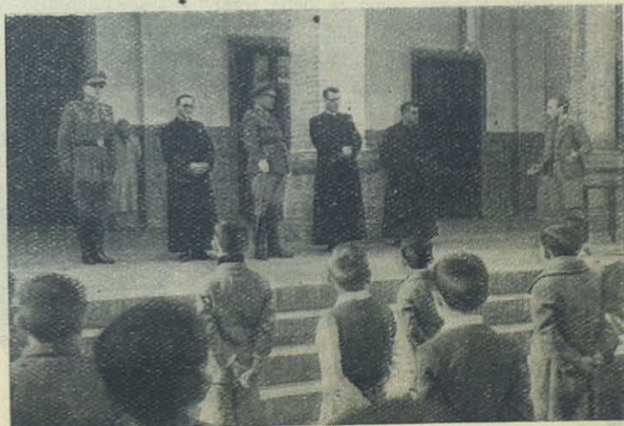
TRIANA (Sevilla): El Excelentísimo Sr. Capitán General de la segunda Región, señor Ponte y Manso de Zúñiga, marqués de Bóveda de Limia, acompañado de su ayudante, el Teniente Coronel señor Calvo, visitan las Escuelas Salesianas.

Primer problema: el de la catequización de los niños que tenemos al alcance de nuestras manos. Solución: la solución está bien clara: enseñarles—como se decía en la primera de las conclusiones aprobadas en la sesión matutina de ayer mañana—, enseñarles la doctrina cristiana, siguiendo las sapientísimas indicaciones y normas trazadas por nuestro Emmo. y Rvdmo. Sr. Cardenal en su instrucción pastoral de julio de 1938, y adoptando los más acreditados procedimientos modernos; y en segundo lugar, hacérsela vivir. Decía muy bien uno de los ponentes que el Catecismo no es sólo una asignatura, sino que es una vida: hacérselo vivir. Por eso, Emmo. y Rvdmo. señor Cardenal, vais a permitir que yo me tome la libertad de felicitaros con toda mi alma por la idea que habéis tenido de encomendar la organización de esta VII Asamblea Catequística Diocesana a los beneméritos Padres Salesianos, porque, señores y hermanos míos, cuando uno convive en los colegios de estos beneméritos hijos de San Juan Bosco, cuando uno ve con sus propios ojos, no sólo cómo les enseñan la doctrina cristiana, sino cómo se la hacen vivir, cómo les hacen rezar y confesarse, comulgar y meditar, jugar y cantar, le brota a