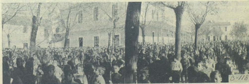
CORDOBA: Centenares de niños, alumnos del Colegio Salesiano, asisten al homenaje tributado a su Director.