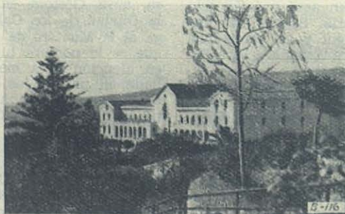
MATARO (Barcelona): Vista general del Colegio Salesiano de San Antonio de Padua.

Quiera San Juan Bosco bendecir copiosamente a una población que así sabe honrarle.