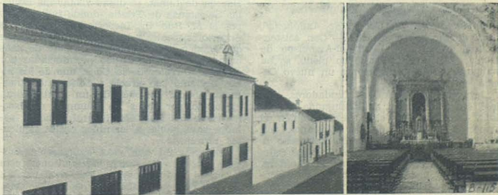
MONTELLANO (Sevilla): Vista exterior de la nueva Casa Salesiana y del interior de la capilla.

Confiemos en Dios, pongamos la obra como San Juan Bosco, en manos de la Virgen Santísima, unámonos estrechamente todos en comunión de plegarias y de santo entusiasmo, y podemos tener la convicción de que el Señor bendecirá nuestros trabajos, haciéndolos fructificar copiosamente en bien de las almas.