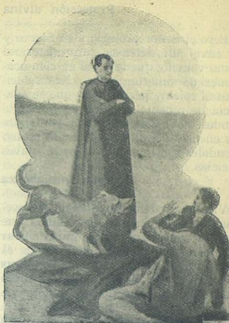
El misterioso "Gris" salva a don Bosco de muerte segura.

Primeramente, para combatir la obra del Santo, se valió de los mismos herejes. Trataron éstos de oponer a las Lecturas Católicas de don Bosco otra publicación, que ellos titularon «Lecturas Evangélicas»; pero viendo que no les era posible luchar en campo abierto y con igualdad de armas contra la verdad cuando ésta constaba con un paladín tan esforzado y cuyo estilo sencillo y claro cautivaba al pueblo, cambiaron de táctica y trataron de hacerle desistir de