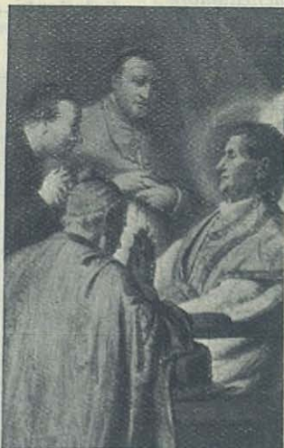
Tránsito feliz de San Juan Bosco (31 de enero de 1888).

(“Memorias Biográficas”, tomo II, cap. XXXI.)