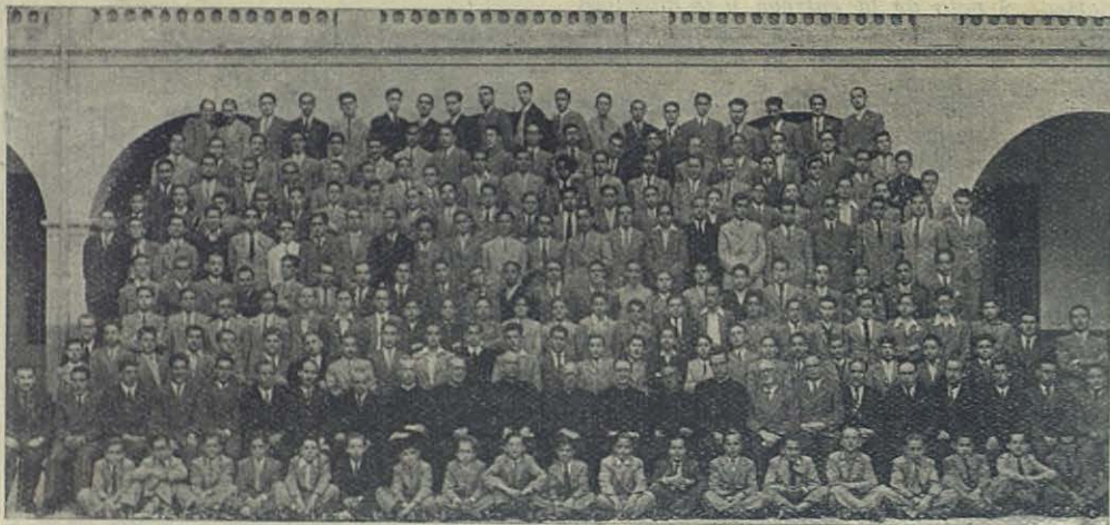
BARCELONA (Salesia): Grupo de alumnos de las Escuelas Profesionales

dos de las cárceles rojas, puede llamarse, más que otra cosa, trabajo de fundación.