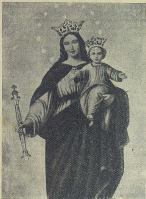
Reproducción en negro de la imagen a todo color de María Auxiliadora representada en el cuadro a que hace referencia la relación de Vigo

del Antigo Alumno, un simpático acto organizado por el Director de la comunidad Salesiana, en honor de los antiguos alumnos casados.