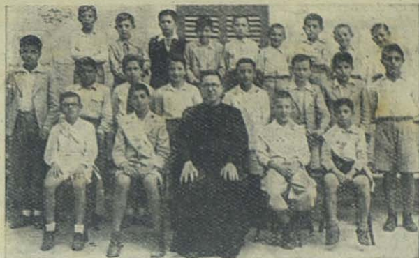
Ciudadela. — Grupo de vencedores en el Certamen Catequístico

su fantasía alocada, libros, figuras, conversaciones, palabras... y los sentidos todos como caballos desbocados... Ustedes habían creído el alma de sus hijos parapetada contra todos los ataques, pues usted misma afirma que le ha educado bien. Con todo, creo que los parapetos que le han proporcionado no pasan de defensas de... cartón. Tal como se lo digo. Para tener sumiso al muchacho, usted lo recordará mejor que nadie, desde chiquitín comenzaron a hablarle del coco , del bu , del duende ... Sí, ya sé que me dirá que estos recursos los empleaban las sirvientas y las tías del niño. Usted recurría a medios más sensatos, ¿verdad? Por ejemplo al demonio, al infierno, etc. De modo que si el chiquitín se emperraba en no tomar la papilla, al mágico conjuro de estas palabras cerraba los ojitos, abría la boquita y engullía el dulce amasijo de leche y harina.