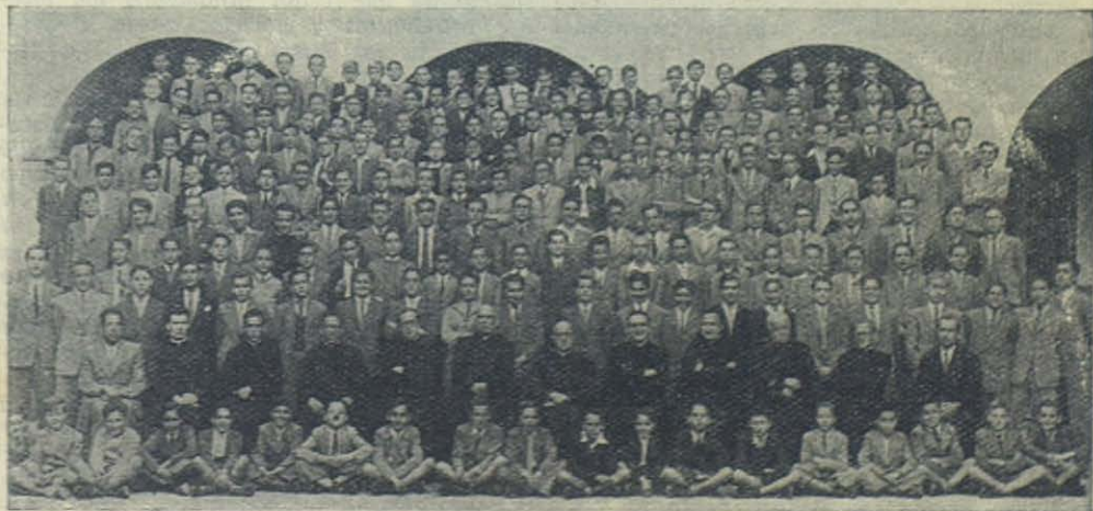
BARCELONA (Sarriá): Grupo de alumnos de las clases elementales y de Comercio

VIGO: Reparto de cuadros de María Auxiliadora a los Antiguos Alumnos casados.—(De "El Pueblo de Vigo"): Tuvo lugar, después de la misa de comunión mensual