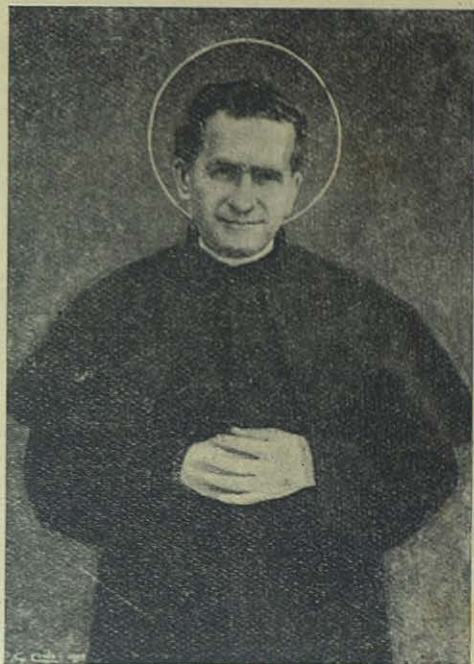
¡Serena, dulce y siempre amable figura de San Juan Bosco! La S. E. I., con el buen deseo de llenar la necesidad que de imágenes de don Bosco se hacía sentir, ha editado hermosos cromos a todo color (40 X 50 cms.) del Santo, como también de María Auxiliadora (de los cuales se hace mención en una relación de Vigo en estas páginas).