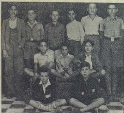
SANTA CRUZ DE TENERIFE.—La primera Junta de las Compañías piadosas en las Escuelas Profesionales recientemente inauguradas

Cuando una granizada ruinosa devastaba las cosechas, iba con sus hijos a com-