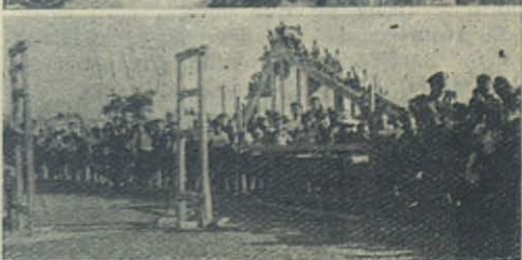
ZARAGOZA: Varias instantáneas del Oratorio Festivo

sos, en las Escuelas Salesianas de Sarriá se juntó la demolición producida por la explosión intencionada de grandes cantidades de dinamita en el mismo momento en que las tropas nacionales ponían su planta vencedora en las calles de la ciudad condal. Pabellones enteros quedaron en un momento reducidos a ingentes montañas de escombros. El trabajo que tomaron sobre sí aquellos salesianos, varios de los cuales acababan de salir enfermos y avieja-