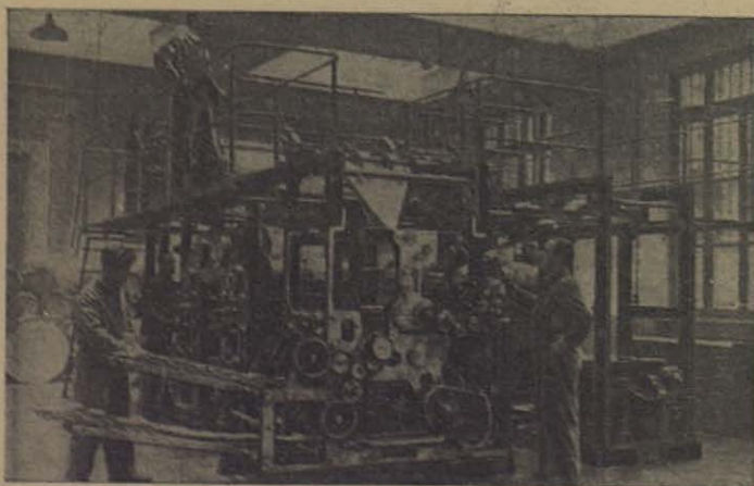
Una rotativa de la Prensa Salesiana.

mos una imprenta, después una grande imprenta, después muchas imprentas. La previsión se ha confirmado. Hoy las que tiene D. Bosco son ciento veintiocho, que, calculadas solamente a razón de dos máquinas cada una, arrojarían un total de doscientas cincuenta y seis máquinas de imprimir, doscientas cincuenta y seis catapultas enfiladas contra las murallas de la inmoralidad y de la irreligión, doscientas cincuenta y seis empresas encargadas de cubrir el mundo de centenares de millones de hojas, portadoras de palabras y de ideas santas, que encauzan actividades en los campos del Señor.