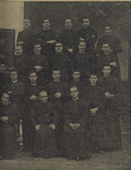
del Estudiantado filosófico.

MADRID: Escuelas Salesianas, (Franco Rodríguez, 5). Grupo de entusiastas jóvenes que constituyen el Círculo "Domingo Savio" .