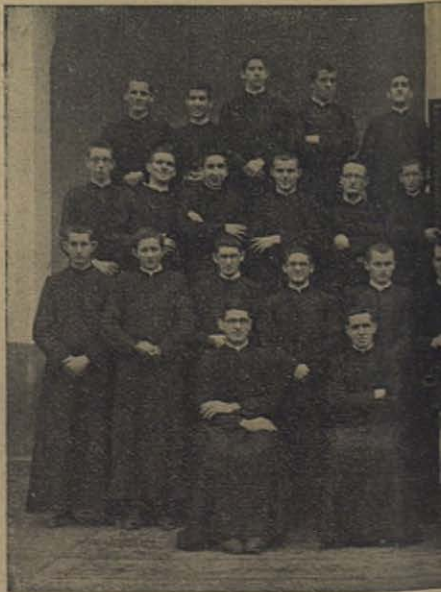
GERONA: Superiores y alumnos.