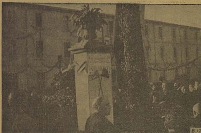
GERONA: Momento de la dedicación solemne del hermoso Paseo D. Bosco por el Ayuntamiento de S. Daniel.