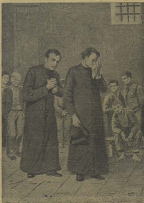
D. Bosco acompaña a D. Cafasso a las cárceles y se conmueve profundamente al contemplar a tantos jóvenes

Muchos de aquellos desgraciados no habían oído quizá nunca una palabra de afecto. Rechazados de la sociedad, castigados por la Justicia, traicionados por sus cómplices, envilecidos ante el mundo entero, degenerados ante sus propios ojos, sin hallar apoyo para rehabilitarse, enfurecidos al verse privados de la libertad, vivían del odio y para el odio.