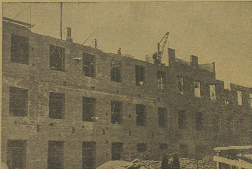
MADRID: Escuelas Profesionales Salesianas. Estado actual de las obras.

Esta fiesta-mercado del pasado domingo ha sido un acto bellissimo y lleno de emoción. Centenares de niños se han reunido en el Colegio para adquirir los objetos según el valor que cada cual, por medio de su propia labor, había ganado. Así, por ejemplo, se han repartido trajes completos, pares de zapatos, otras prendas de vestir y juguetes desde los de mayor precio a los más sencillos. Para todos ha habido algún obsequio, con el cual ha sido premiada su asistencia a la catequesis del Oratorio Festivo, que, por otra parte, les ha instruido y alejado de los peligros durante el año.”