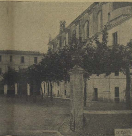
Exterior de la Casa Salesiana.