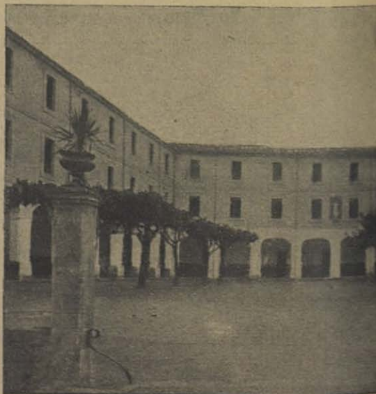
GERONA: Patio interior