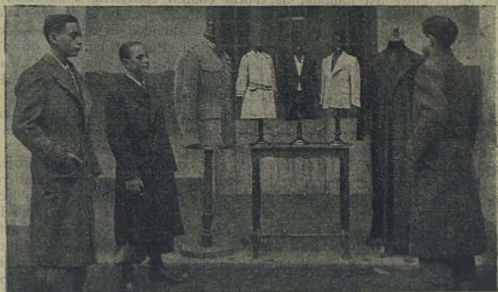
Varios de los trabajos confeccionados en la Escuela Taller de Sastrería.

El mecánico de primer curso limando sin cesar sobre el duro hierro que va