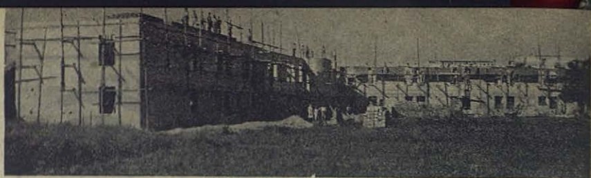
Estado de las obras de la Residencia Universitaria

BRILLANTES EXITOS. —De tal se puede calificar el obtenido por los alumnos de los Colegios Salesianos de Mataró, Salamanca, Utrera y Ronda en su examen de Estado. El porcentaje de suspensos es tan insignificante que puede considerarse nulo, mientras el de los sobresalientes pasa del veinte por ciento y en uno de los mencionados Colegios el número de matriculas de honor otorgadas a los alumnos Salesianos forma el cincuenta por ciento del conjunto global del distrito universitario.