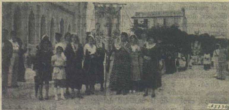
Barranquilla. - La Junta Directiva.

Una fervorosa novena preparó y caldeó los