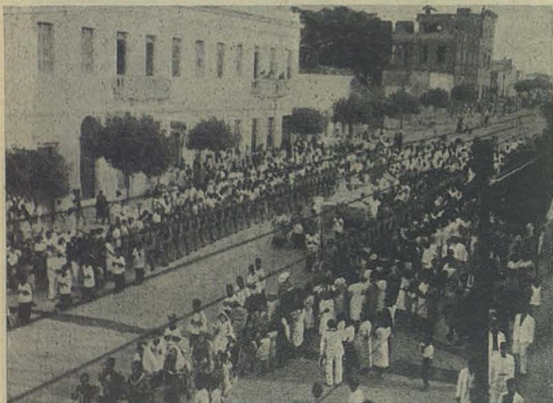
Barranquilla (Colombia). - La procesión.