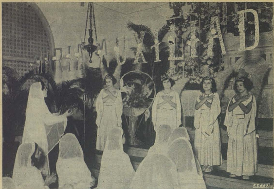
Habana (Cuba). - La Congregación de las niñas haciendo a la Virgen su "ofrenda floral".

En todas ellas se adoptaron resoluciones eminentemente prácticas, destinadas a fomentar el espíritu cristiano en los hogares y en la sociedad, para que Cristo pueda de veras reinar en los mismos.