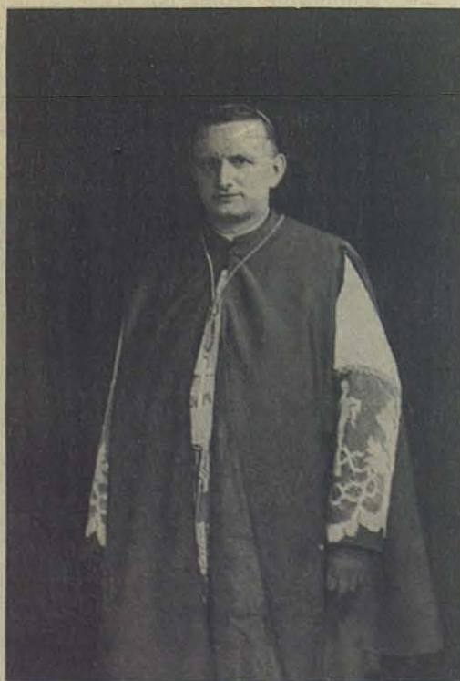
El nuevo Vicario Apostólico de Derna.

El nuevo Vicario Apostólico, con sus veinte misioneros, después de la fiesta tradicional de imposición de los crucifijos, celebrada en nuestra Basílica el 19 de noviembre p. p., partió inmediatamente a ocupar su Sede.