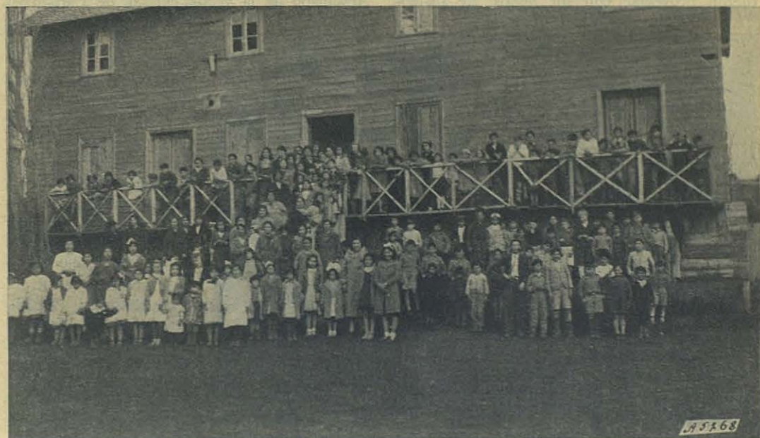
San Carlos de Bariloche (Argentina). - El Día del niño.