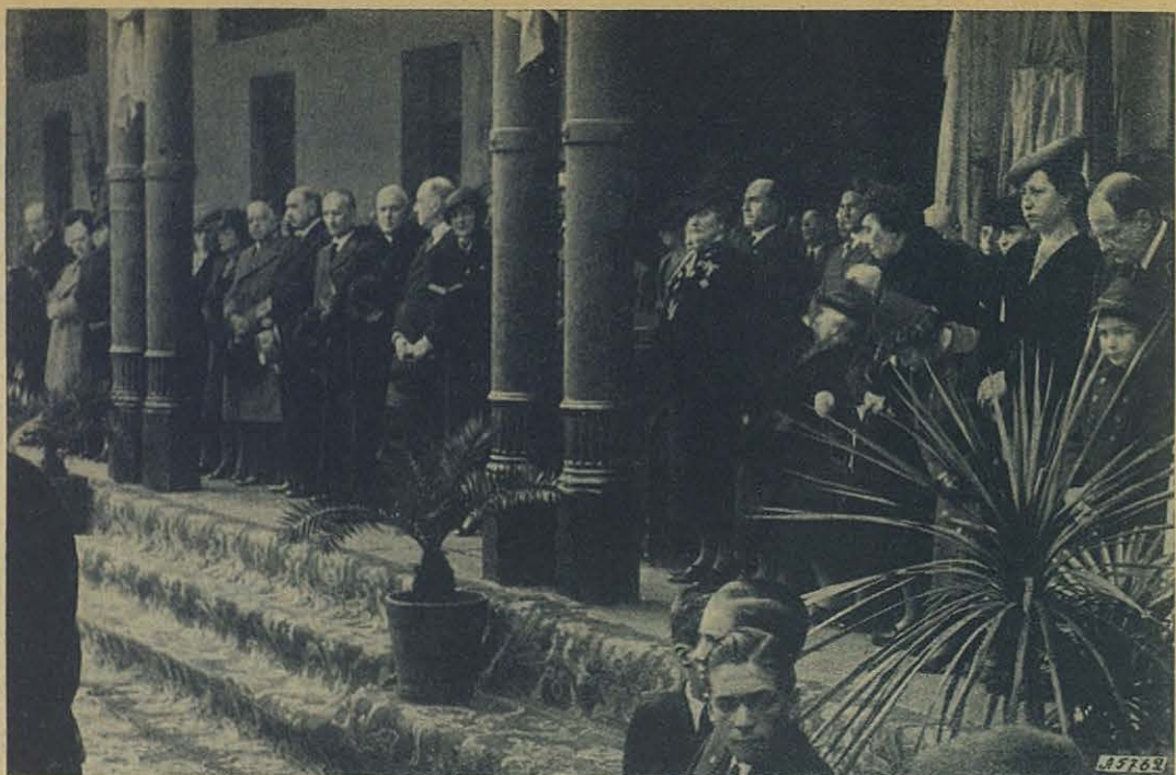
BUENOS AIRES - Los Señores de la presidencia oyendo devotamente la Santa Misa.