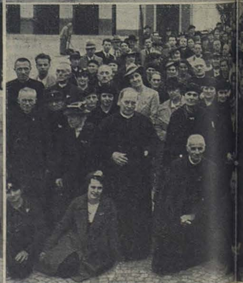
Peregrinos que han visitado el Sa