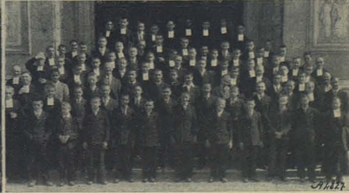
Santuario de María Auxiliadora.