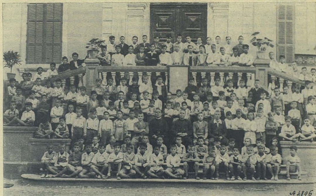
Las Palmas. - El Oratorio Festivo "Domingo Savio" inaugurado el 1º de enero del presente año.