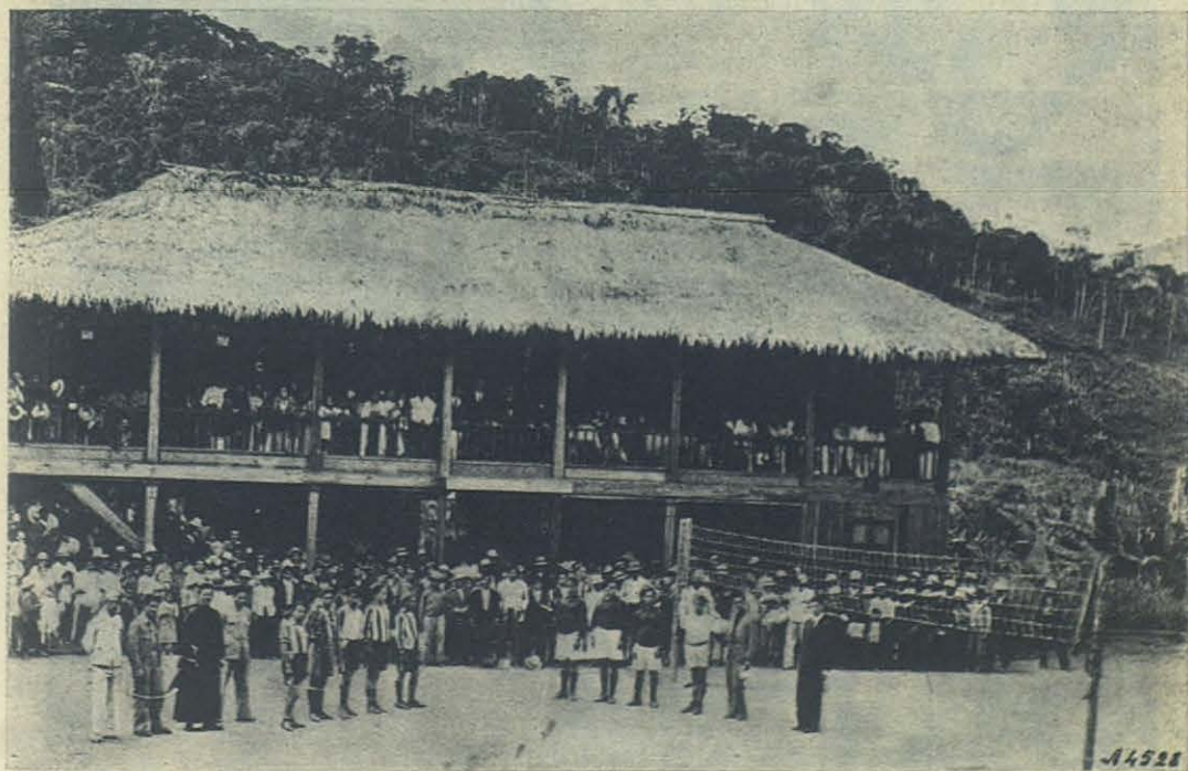
Limón. - Residencia misionera.