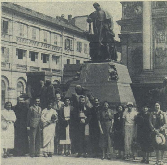
Peregrinos de Bombay (India).

Que la Sma. Virgen Auxiliadora y San Juan Bosco se lo premien a todos; y que no decaigan nunca, antes bien sigan continuamente in crescendo estas consoladoras manifestaciones del fervor religioso que tanto bien hacen a todos, y especialmente a algunas almas tal vez olvidadas de Dios durante años y años, y que tan eficazmente contribuyen a mantener vivos en los pueblos el fuego de la piedad y el olor de las buenas costumbres cristianas.