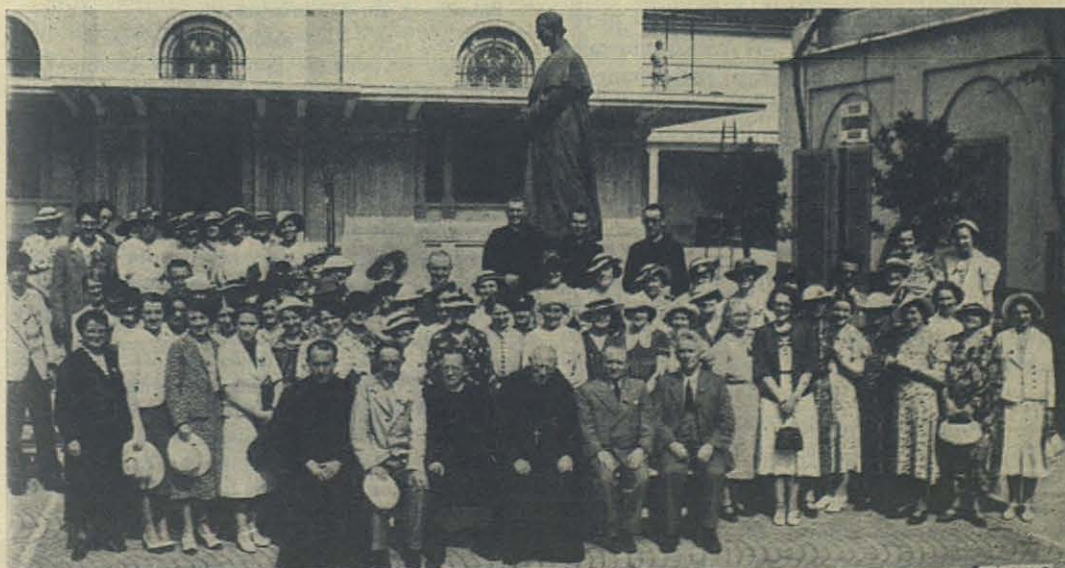
Peregrinación constituida por profesores y maestros de Glasgow y Edimburgo y presidida por el Arzobispo Primado.

En cuanto a las actividades por ella desarrolladas como Primera Superiora General del Instituto de las Hijas de María Auxiliadora, todos los testimonios coinciden en afirmar que fueron una continua bendición de Dios, debiéndose a su santidad y a su prudencia, y sobre todo a su inmovible fidelidad a las normas