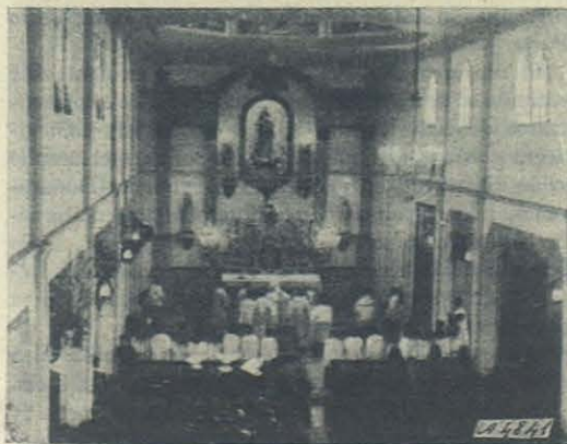
La Serena. - Pontifical.

Que el amable Santo de la juventud bendiga a Tuxpán y salve a nuestra patria.