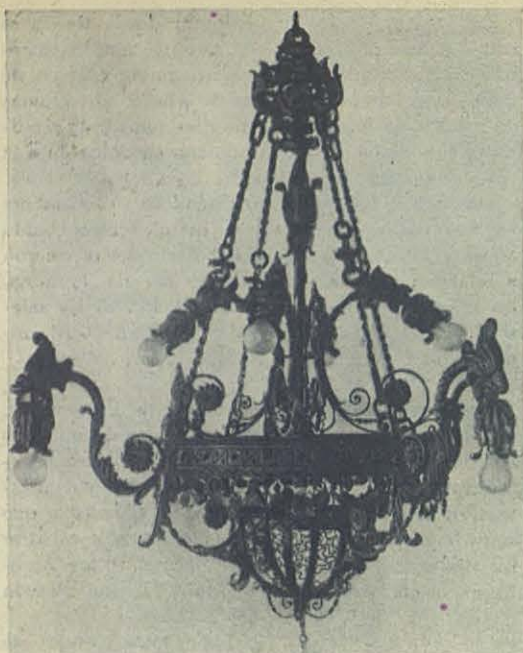
Ciudad Trujillo. - Una de las lámparas que figuran en la Exposición.

Auxiliadora era llevada por fervorosos feligreses, radiante de luz y en medio de un mar de flores, y acompañada por las vibrantes y armónicas notas de la Banda militar bondadosamente cedida por el Sr. Ministro de Guerra.