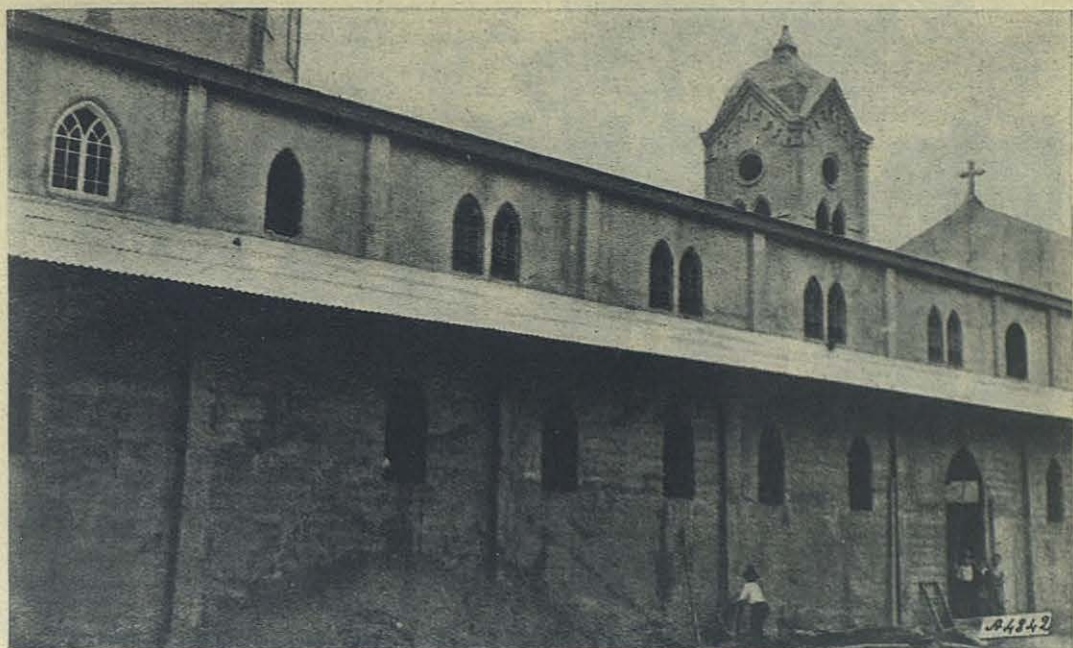
La Serena (Chile). - La nueva iglesia de María Auxiliadora.