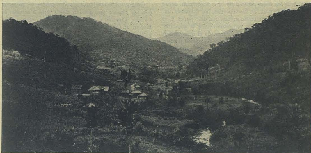
Limón. - Panorama de la Misión.