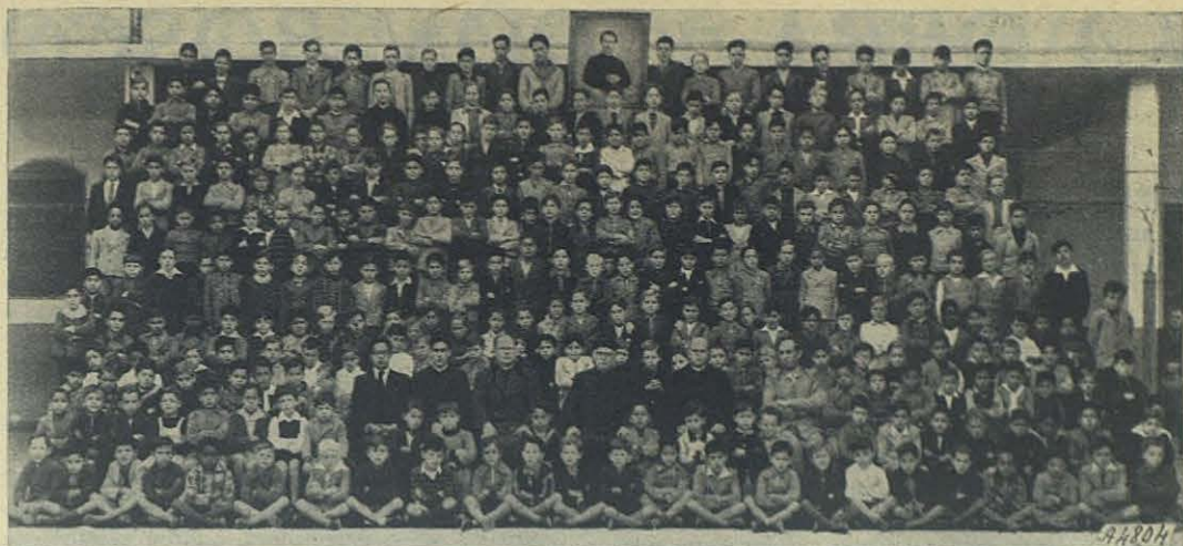
Montevideo. - Alumnos y profesores del Colegio de la Divina Providencia.