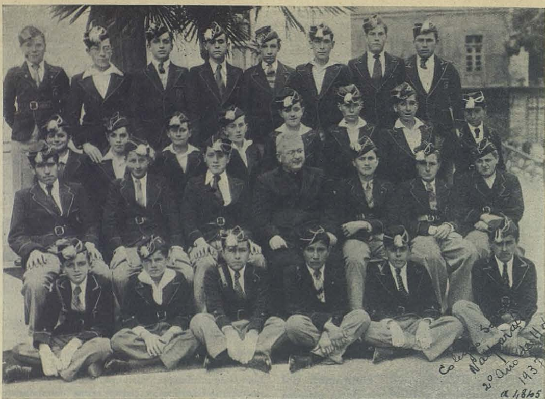
Valparaíso (Chile). - Los alumnos del 2º año de Humanidades felicitan al Rector Mayor.