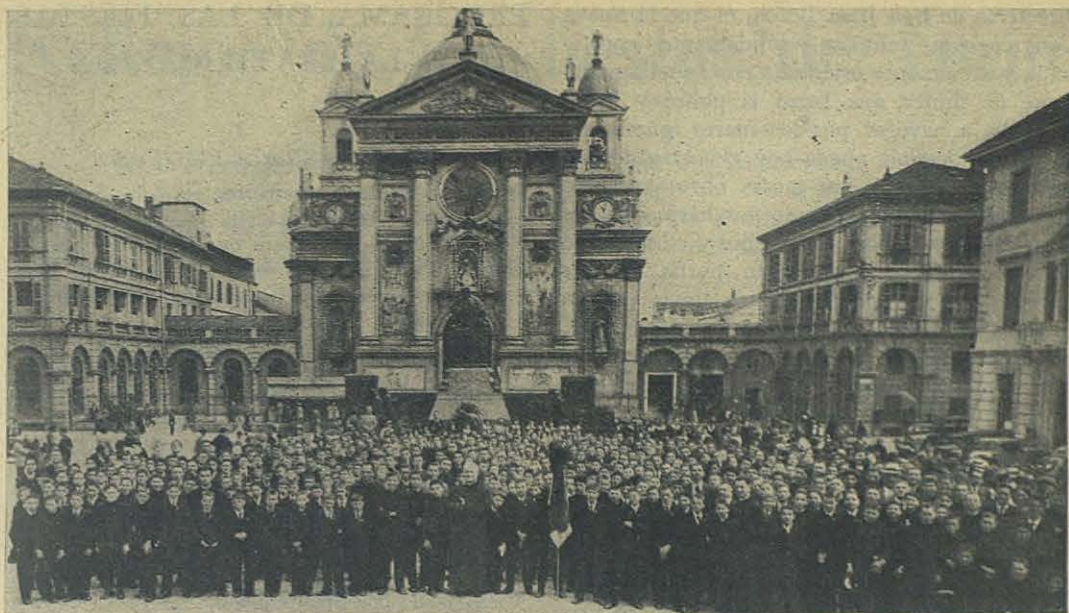
La nutrida peregrinación de nuestro Instituto de Milán.

que hacía Don Bosco con los niños, pero sin que ella hubiese oído hablar nunca del Oratorio de Valdocco. Todos los días reunía en su tallercito una nutrida corona de niñas y jovencitas y, alternando con juegos, les daba lecciones de catecismo.