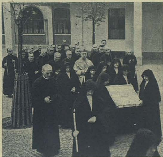
Antes y después del reconocimiento de los restos mortales de la Venerable Mazzarello.