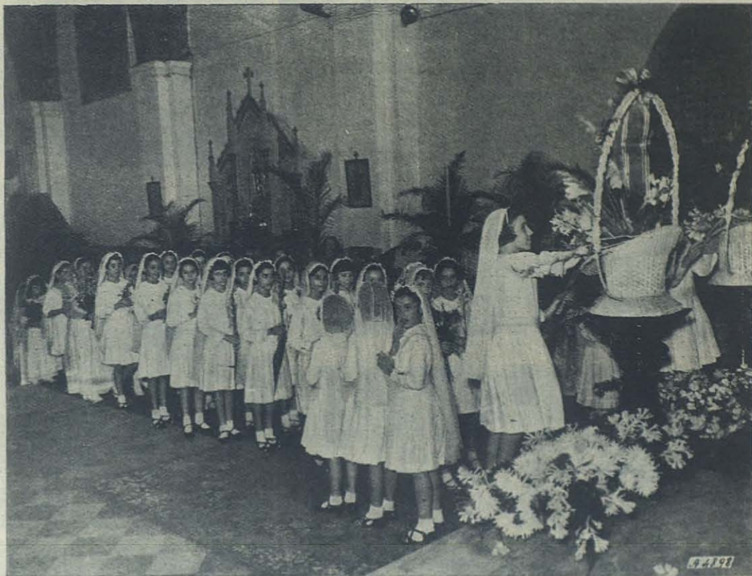
Habana. - Niñas de los Colegios de San Vicente y María Auxiliadora haciendo su ofrenda floral a los pies de la Virgen.

quedó sintetizado en conclusiones las más a propósito para la índole de nuestros varios colegios. Como complemento del Congreso, el tiempo libre de sesiones fué empleado por los congresistas en visitar y estudiar una exposición didáctico-escolar, demostrativa de los métodos aplicados en las diversas asignaturas correspondientes a los varios años de Bachillerato que cursan nuestros alumnos aspirantes a Salesianos, en el mismo Instituto de Mosquera.