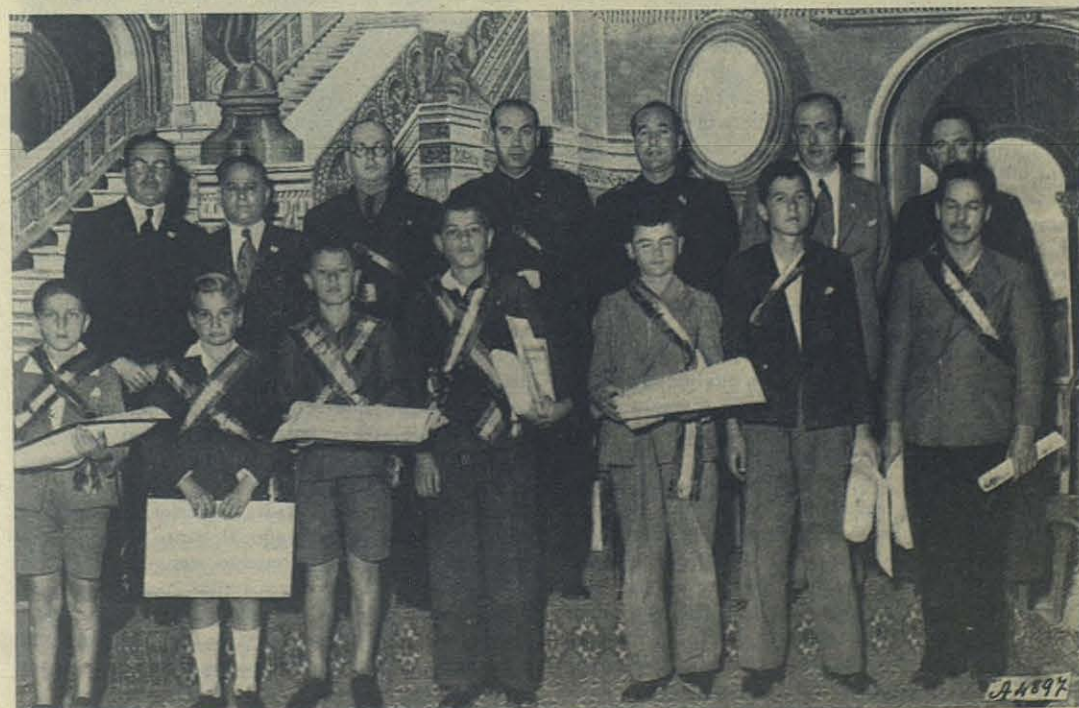
Las Palmas. - Alumnos que han merecido el Premio de Honor.