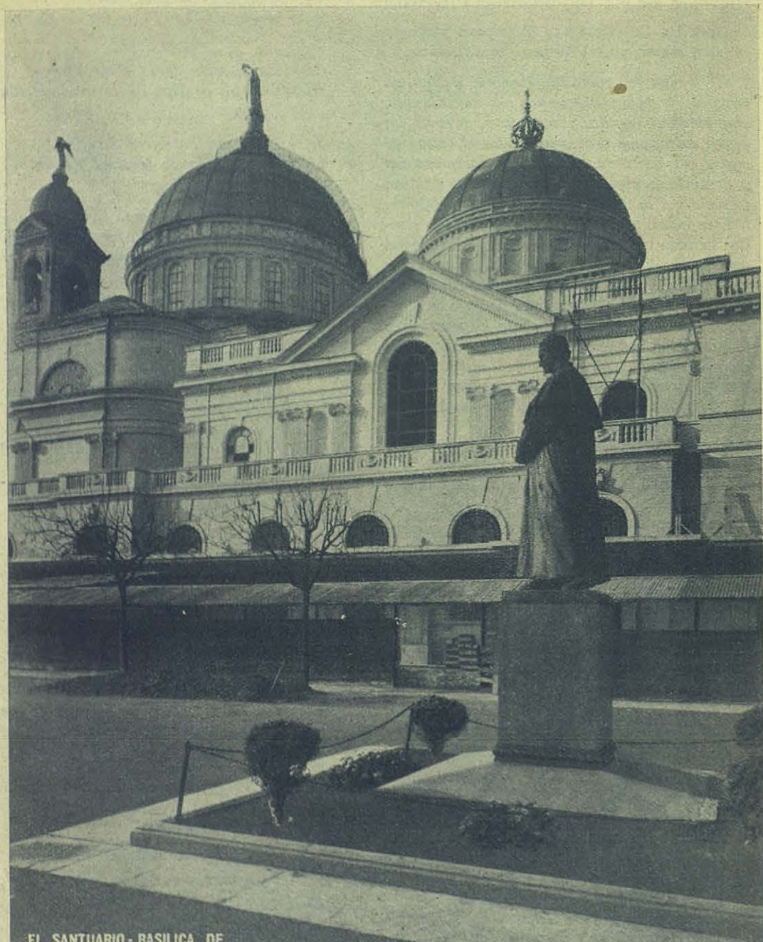
EL SANTUARIO - BASILICA DE MARIA AUXILIADORA DE TURIN, AMPLIADO Y EMBELLECIDO

Ningún devoto de "la Virgen de Don Bosco" debe dejar de contribuir, poco o mucho, a este homenaje mundial.