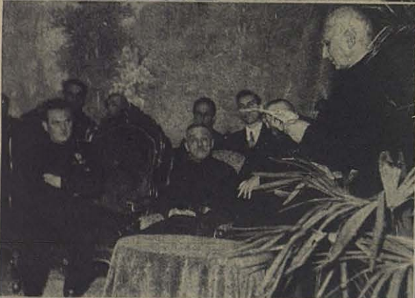
La visita del Excmo. Sr. Ministro de Agricultura.