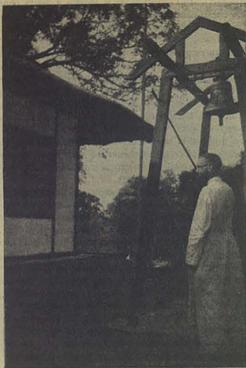
La voz de Dios.

familia de Nazareth, y doquiera reinan la paz y serenidad.