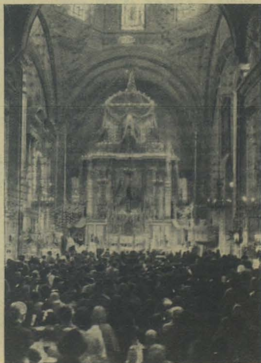
Méjico. - El templo de Santa Inés.

Como coronación de este apoteósico paseo se impartió la Bendición con S. D. M., dióse a besar la Reliquia del Santo y se distribuyó un pequeño recordatorio de las fiestas.