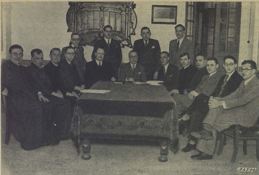
La nueva Junta Nacional de Ex alumnos salesianos del Uruguay.