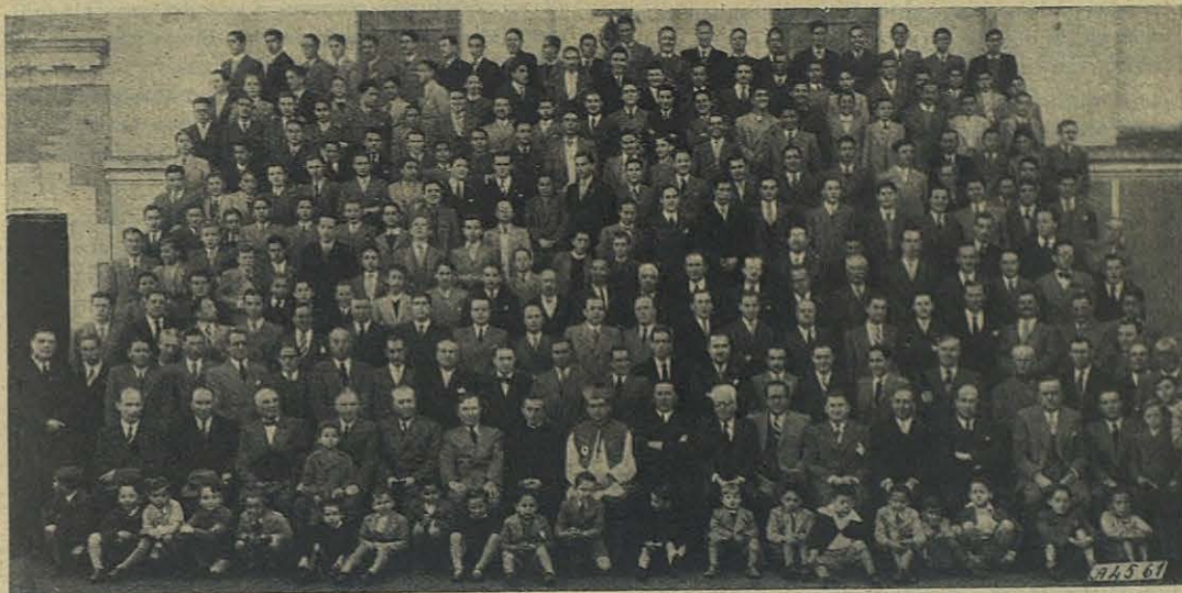
Argentina - San Isidro. - Imponente grupo de ex alumnos que han hecho la Comunión Pascual en su antiguo colegio.