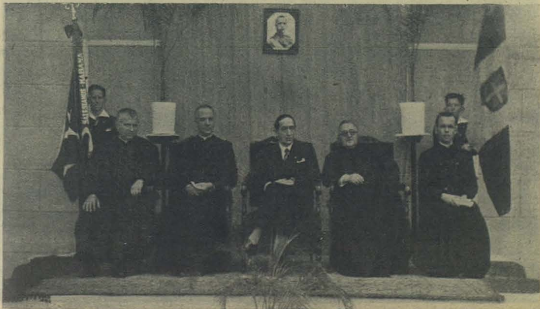
Habana. - El Excmo. Sr. Ministro de Italia en nuestra Escuela de artes y oficios.