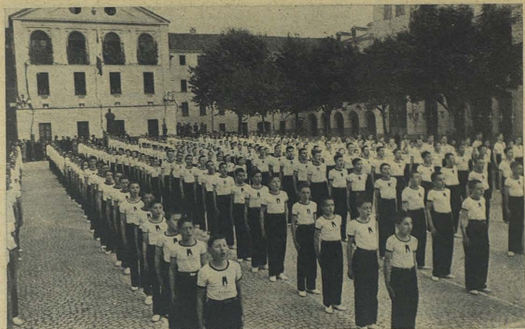
Al tiempo de izar la bandera, los gimnastas alineados cantan los himnos de la Patria.