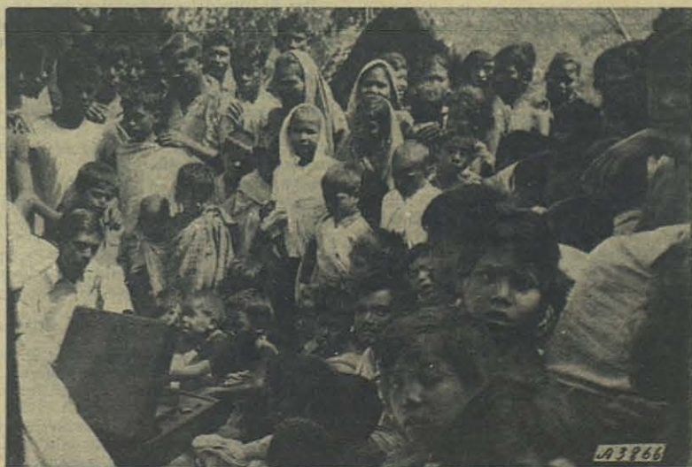
Indios "Garos" agrupados en torno del gramófono de la Misión.