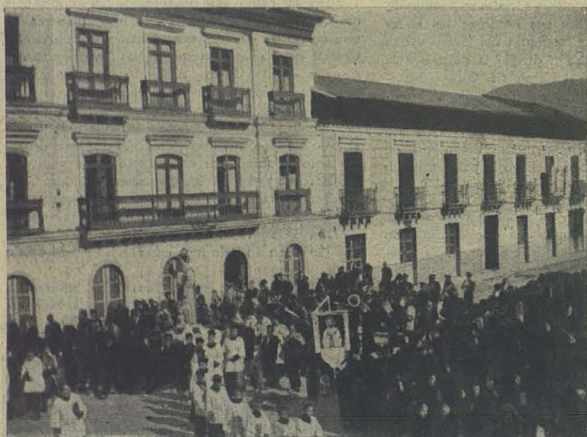
Pasto. - El vecindario de esta salesianísima ciudad colombiana celebró también con solemnes fiestas el 50 aniversario de la muerte de S. J. Bosco.