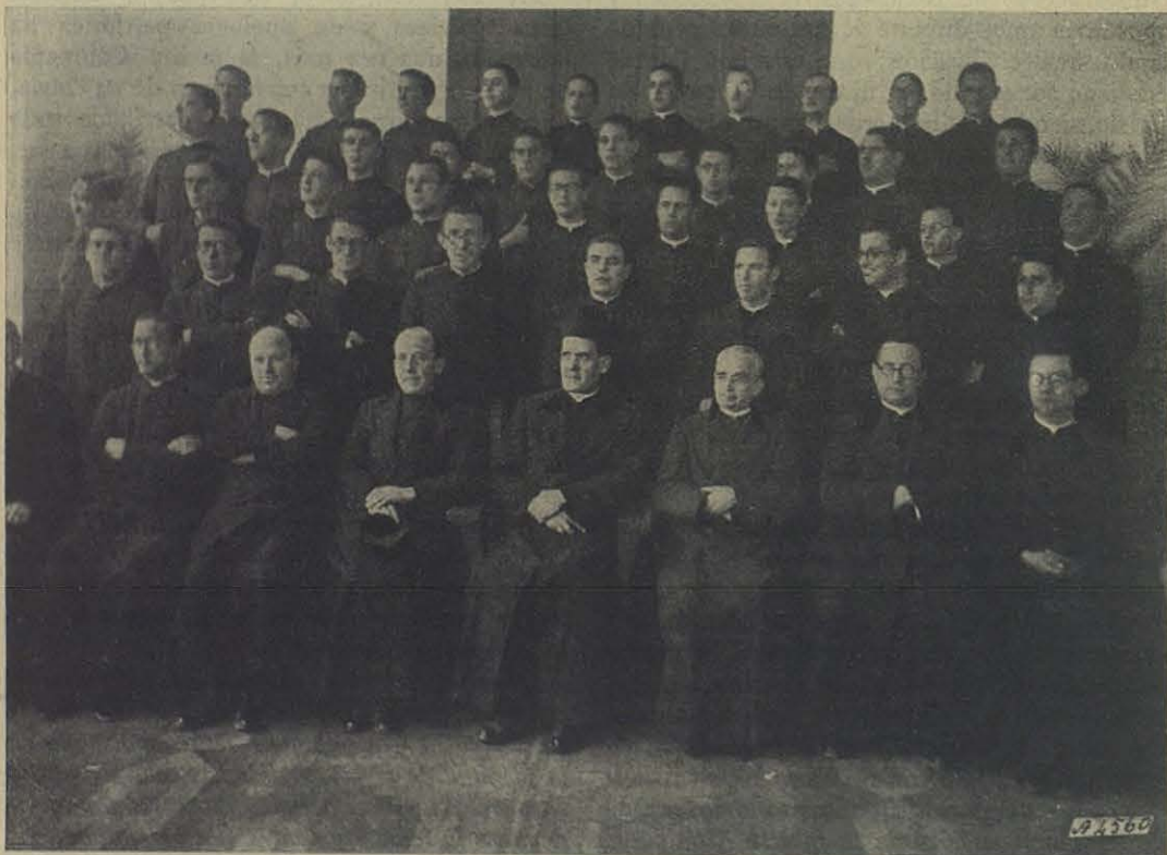
España - San José del Valle. - Mientras en la guerra de hoy luchan heroicamente los soldados de la nueva España, en nuestros Estudiantados teológicos otros soldados se preparan para las batallas pacíficas de mañana.

Nuestra más efusiva enhorabuena a la inclita Compañía de Jesús.