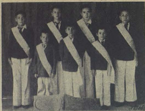
San Salvador. - Los vencedores del certamen catequístico del Colegio Don Bosco.

simas; el canto, la orquesta. el fervor, todo estuvo a tono con la fiesta.