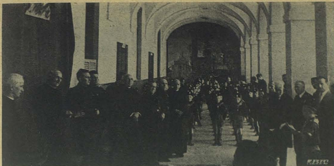
El Sr. Ministro de Agricultura en su antiguo Colegio del Martinetto.