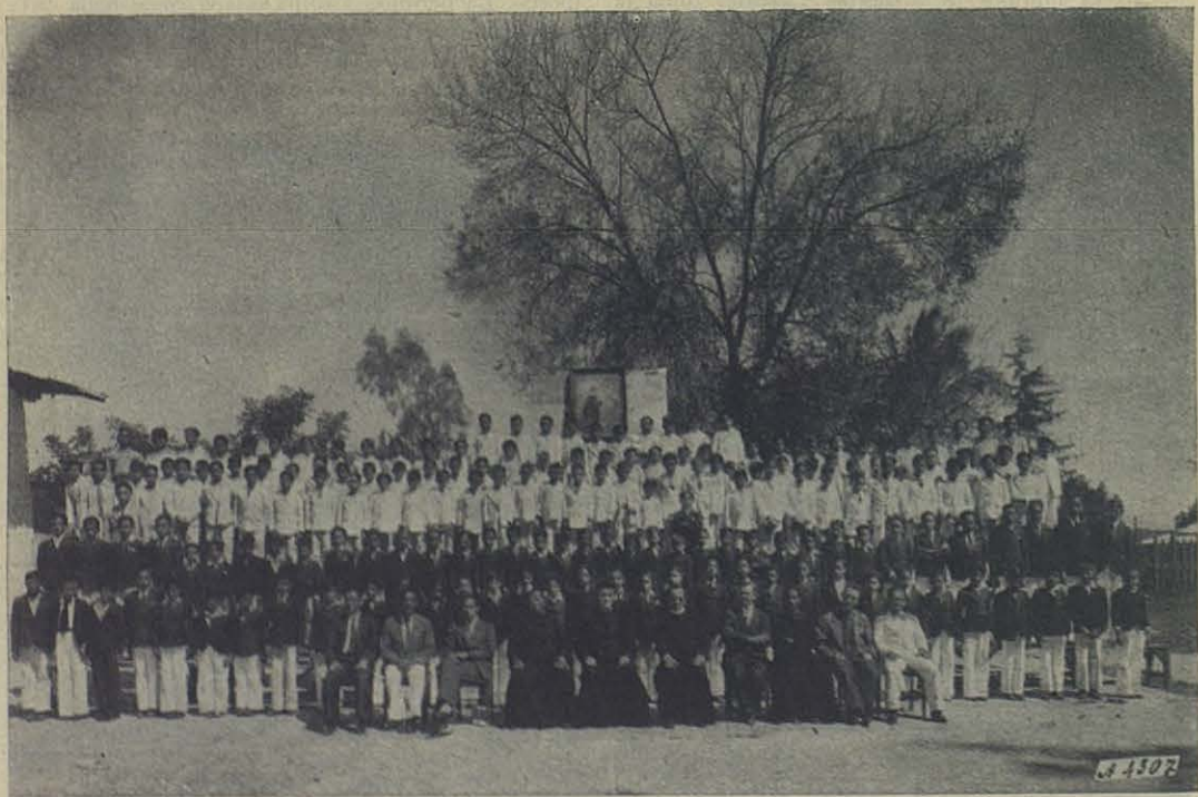
San Salvador. - Con ocasión de la clausura del Año Escolar del Colegio Don Bosco.