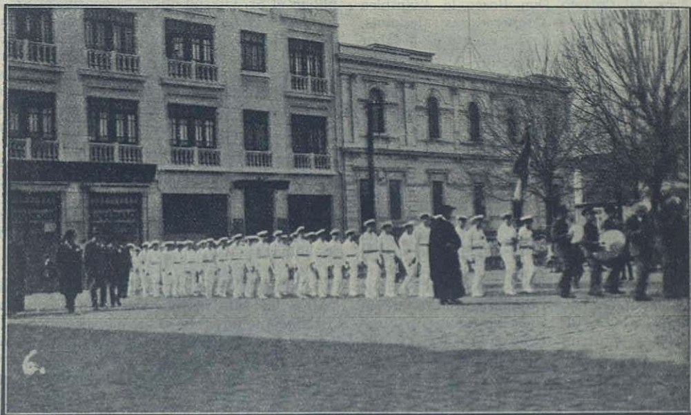
Valdivia (Chile) — Desfile de los 450 alumnos del Colegio Salesiano con motivo de las fiestas de las Bodas de Plata del Instituto.

Se completó la jornada con un brillantísimo festival gimnástico y el día siguiente se puso término a los festejos con una misa de Requiem en sufragio de los bienhechores, alumnos