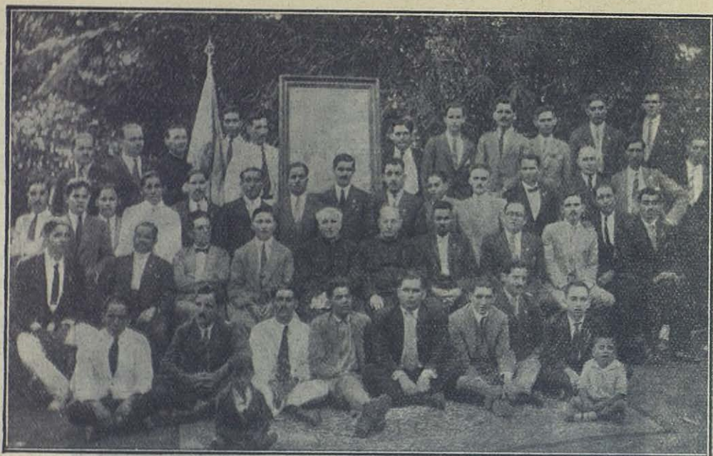
Santa Tecla (El Salvador) — Grupo-recuerdo de la gran fiesta de los Exalumnos.