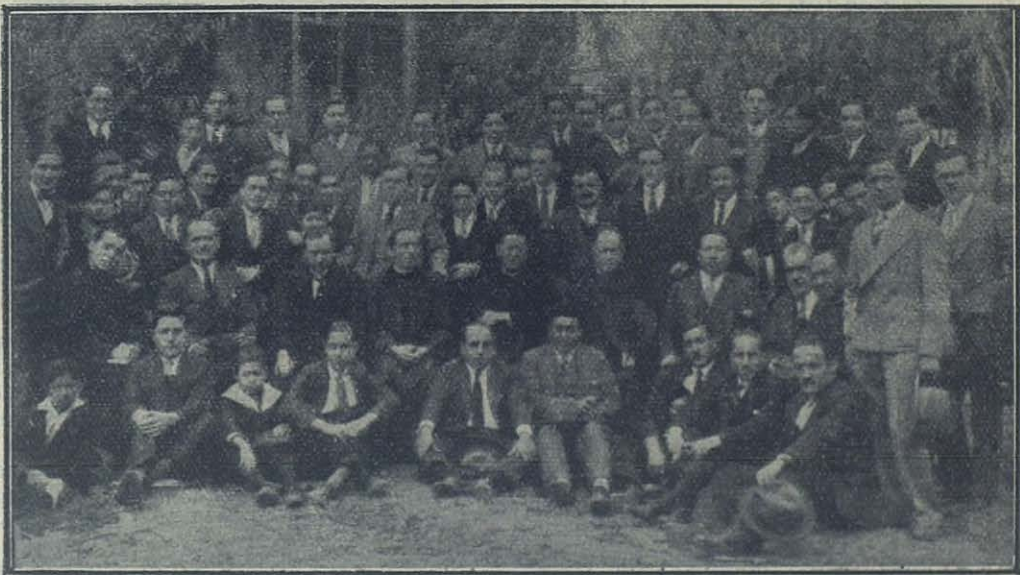
Lima (Perú) — Grupo de Exalumnos del Colegio Salesiano.

Lanzada la idea por un núcleo de caballeros de la colectividad, alcanzó la peregrinación todo un éxito y puso de relieve la unión y el espíritu religioso que reina entre los súbditos de esa República.