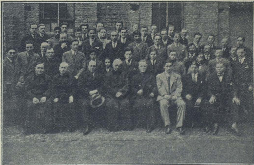
Magallanes (Chile) — Celebrando el 7º aniversario del Centro de Exalumnos.