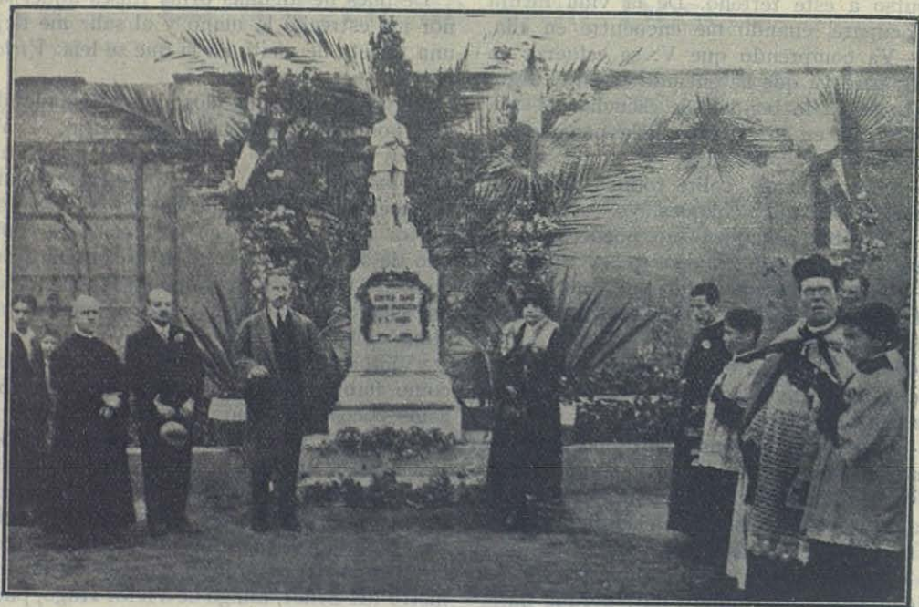
Magdalena del Mar (Perú) — Inauguración del Monumento a Domingo Savio.

Después de la comida, durante la cual se sentaron a la mesa de los salesianos todas las autoridades eclesiásticas, civiles y militares, se desarrolló la solemne procesión, paseando en triunfo la hermosa estatua de la Virgen por las calles de Frystak. Acabadas