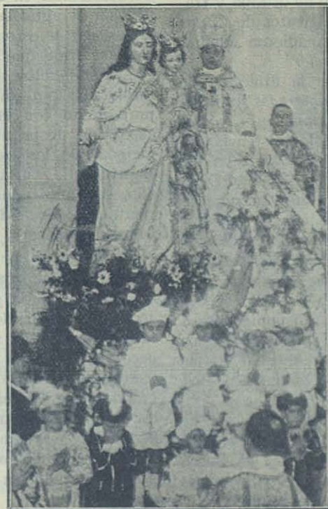
Nitheroy (Brasil) — Coronación de M. Auxiliadora.

También me consoló grandemente la inauguración de la Iglesia del Sagrado Corazón de Jesús en Livorno (Italia), con gran concurso de pueblo. Don Bosco en los últimos años de su vida nos animó grandemente a una gran devoción al Sagrado Corazón de Jesús edificando con grandes sacrificios la Basilica del Sagrado Corazón en Roma, prometiendo la construcción de un gran Templo al Sagrado Corazón en el Tibidabo, junto a Barcelona, iniciando en honor del Sagrado Corazón las fundaciones de Londres y de San Pablo en el Brasil, ambas con sendos Santuarios y enviando a los primeros salesianos al Ecuador, donde hoy todas las Casas Salesianas están puestas bajo la especial protección del Sagrado Corazón de Jesús. Y fué en aquellos últimos años, que Don Bosco