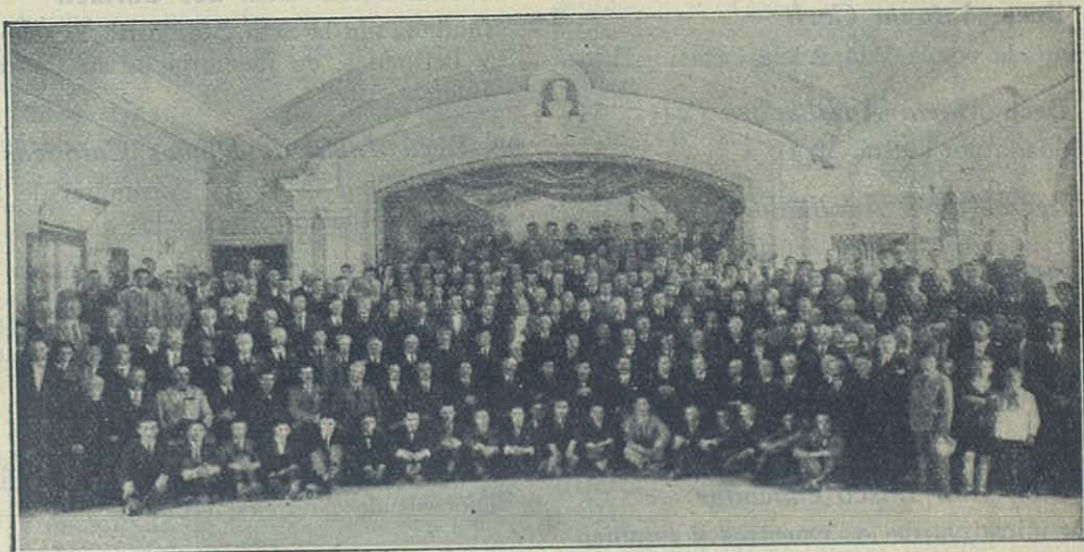
Rosario (Argentina) — El Día del Colono, que se celebró con extraordinaria concurrencia el día 23 de setiembre de 1928.