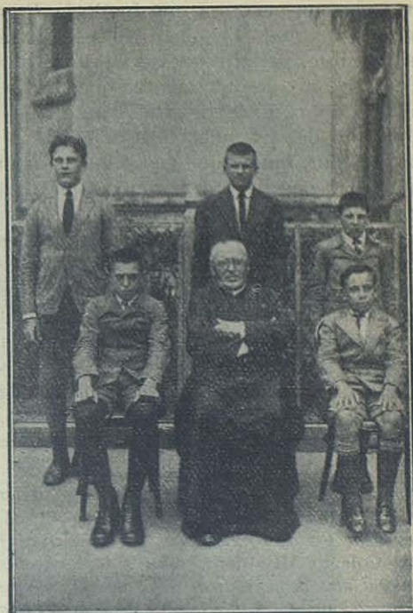
San José de Misiones (Argentina) — Los cinco primeros aspirantes a la vida salesiana.

También dió resultado la cruzada de los pequeños sacrificios. En el cepillo de Sta. Teresa pusimos un cartelito con una máxima de la santa: Los pequeños sacrificios producen fragantes rosas. En aquel cepillo se encontraron monedas de 5, 10 y más liras, pero sobre todo piezas de 5, de 10 y de 20 céntimos. Eran sacrificios de