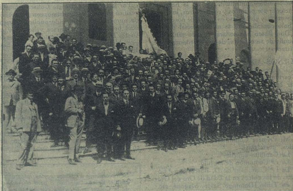
Paysandú (Uruguay) — Un grupo de ex-alumnos del Colegio Salesiano de Ntra. Sra. del Rosario.

La «santificación propia» se logra mediante la fórmula de Don Bosco al joven Besucco: « Alegría, Estudio, Piedad »; y, entendiendo por « estudio » no solo el trabajo personal de cada Antigo Alumno, sino, además, la cultura — religiosa y social — hoy tan imprescindible, llega a obtener el siguiente enunciado: « Alegría, Trabajo, Cultura (religiosa y social), Piedad ».