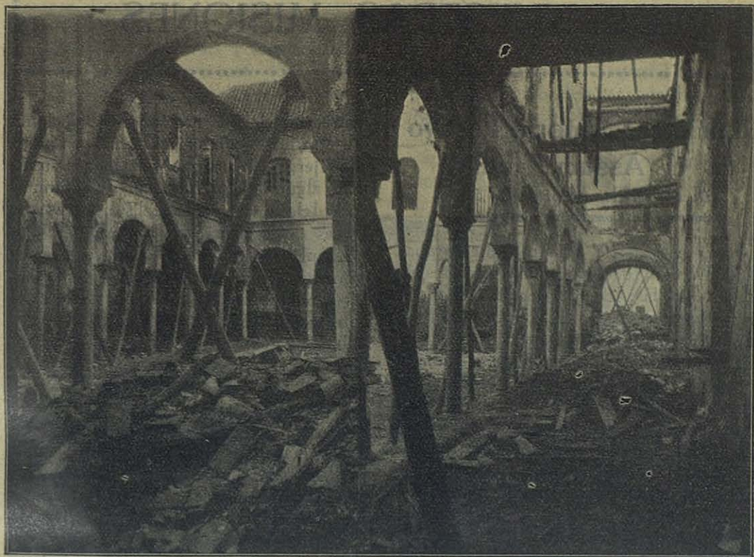
Sevilla (España) — Lo que queda del patio "Domingo Savio."