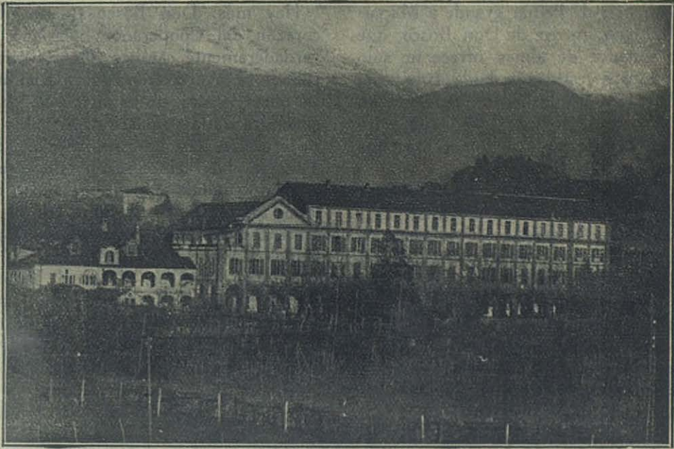
Ivrea (Italia) — Instituto "Cardenal Cagliero", para la formación de Vocaciones Misioneras.

y que el Venerable recuerda expresamente a sus Cooperadores: los mismos que perseveraban en la oración y formaban un sólo corazón y una sola alma, «llevaban sus haberes a los pies de los Apóstoles, para que se sirviesen de ellos en favor de las viudas y de los huérfanos, y para socorrer otras graves necesidades».