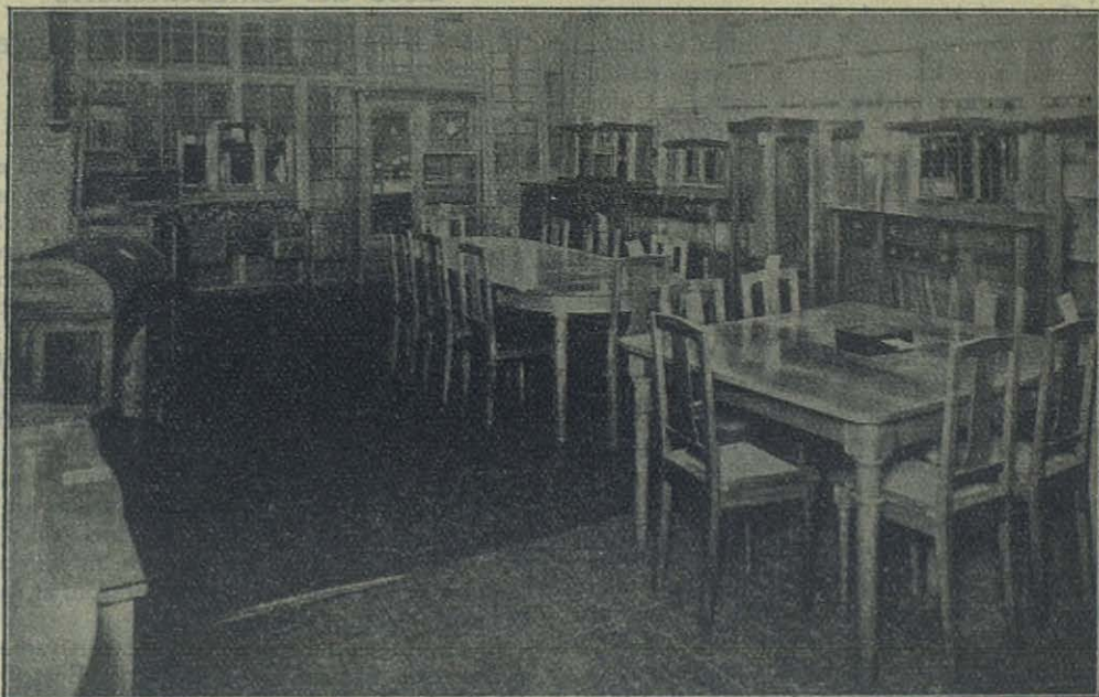
Santiago (Chile) — La sección de ebanistería en la Exposición Profesional Salesiana de la "Gratitud Nacional."