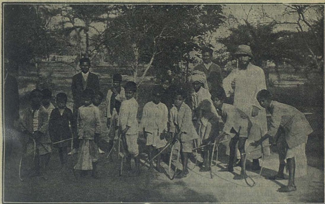
Assam (India) — Los principios de un Oratorio Festivo.

Y yo llegué con hora y media de retraso, y apenas me vieron corrieron todos a mi encuentro, contándome sus pequeñas aven-