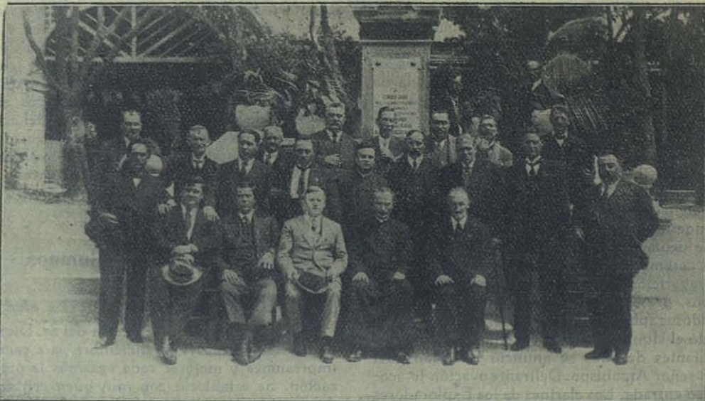
Paysandú (Uruguay) — Un grupo de antiguos alumnos veteranos del Colegio Salesiano.

Cerró el acto la palabra siempre paternal y