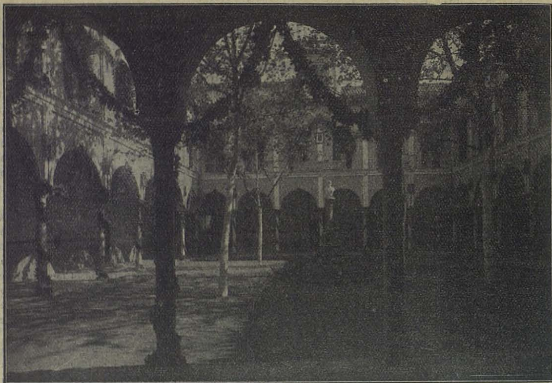
Sevilla (España) — El magnífico patio central "Domingo Savio,, del Colegio Salesiano cuyos cuatro lados han sido destruidos por el incendio.

de los primeros para echar agua sobre los resoldos y vigilar si surgía algún foco, como sucedió anochecido, pero fueron en seguida apagados.