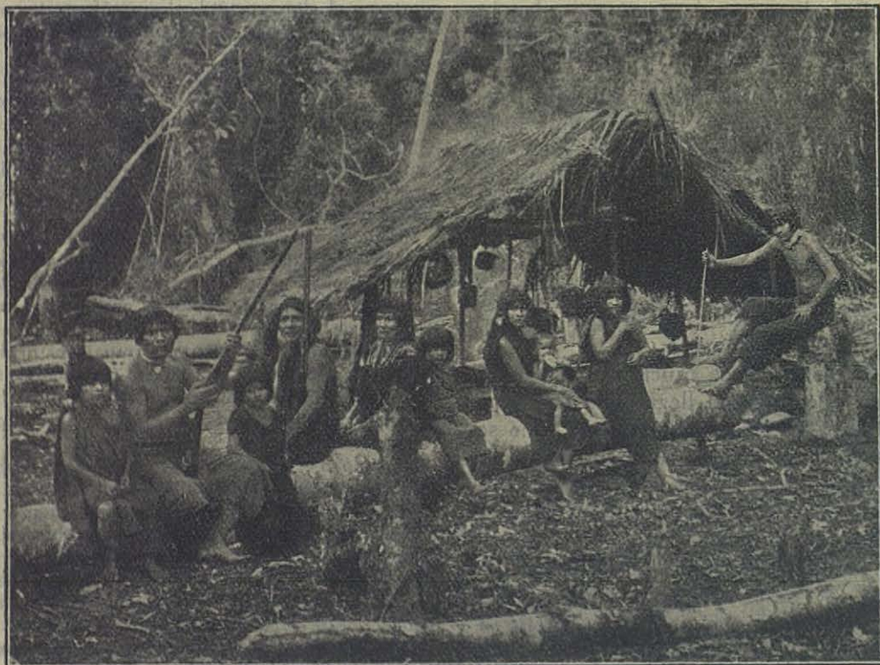
Oriente Ecuatoriano — Una familia de jíbaros amigos.

El héroe victorioso, después de vencer el alto murallón, desapareció por entre el tupido ramaje de la vegetación. Pocos minutos después, algunos indígenas traen a la orilla una robusta canoa, la echan al agua, pasan el canal y me vienen al encuentro con señales de grande complacencia. En seguida les obsequié con una bellí-