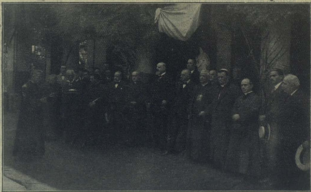
Santiago (Chile) — El Director del Colegio de la Gratiitud Nacional saluda al Presidente de la República y demás autoridades en la visita que hicieron a la Exposición Profesional Salesiana.

PUNTA ARENAS (Chile). — El electricista de María Auxiliadora. — Después de la grandiosa fiesta de inauguración del Santuario de María Auxiliadora, el 14 de mayo de 1922, la hermosa estatua de la Virgen de Don Bosco quedó en