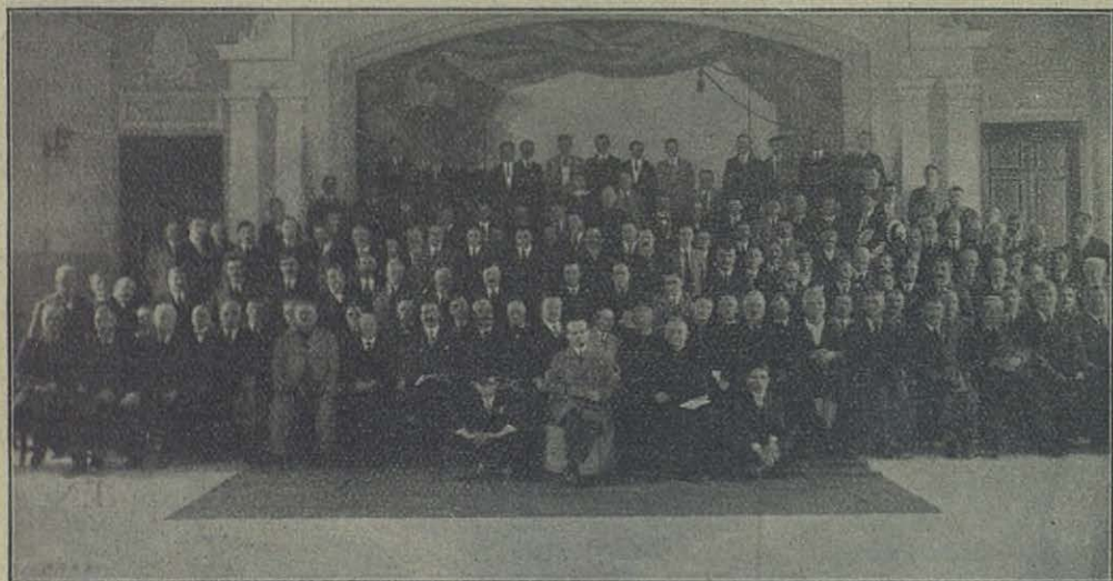
Rosario — El Cónsul Italiano rodeado de sus compatriotas que participaron al "Día del Colono ..."

CONCEPCIÓN (Paraguay). — Con gran solemnidad se han celebrado las Bodas de Plata del local Colegio Salesiano . Debido a la generosidad de los Cooperadores, se ha podido inaugurar en esta ocasión una parte del edificio, que comprende tres espléndidos salones de 15 por 10 metros. Los antiguos alumnos tomaron gran parte en los animados festejos que se organizaron.