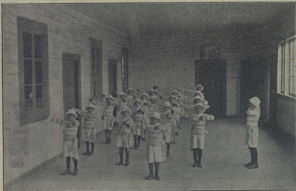
San Julián (Patagonia - Arg.) — Los pequeños gimnastas se preparan para la Fiesta de la Raza.

A última hora recibimos la noticia de una dura prueba a que ha sido sometida la Obra de Don Bosco en la Patagonia. La iglesia y el