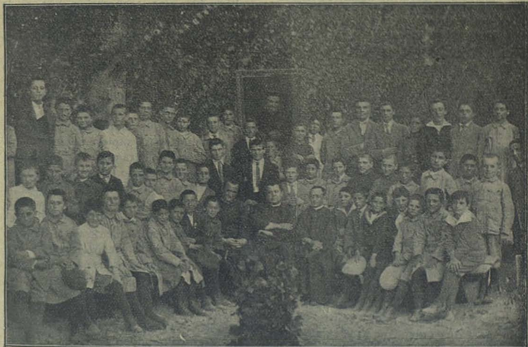
Fortín Mercedes (Patagonia-Argentina) - Aspirantes misioneros salesianos.

Esta unión de fuerzas, a ser posible alrededor del pastor, al paso que ofrece más amplio campo a las iniciativas particulares las ordena más eficazmente, las endereza con el concurso de cada uno, para provecho común.