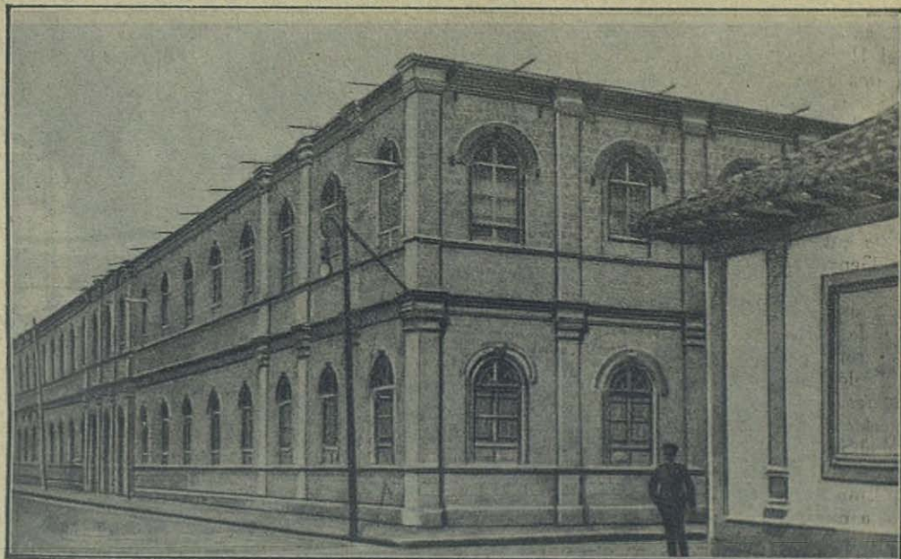
Riobamba (Ecuador) — Colegio Salesiano, que después de nuevas importantes ampliaciones, podrá albergar a más de 300 alumnos.