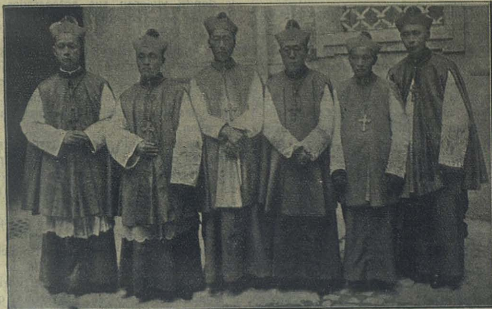
El Boletín Salesiano une sus plácemes y felicitaciones a los del mundo entero, por la consagración de los seis obispos chinos, que abre una nueva era en la historia del Catolicismo en el extremo Oriente.