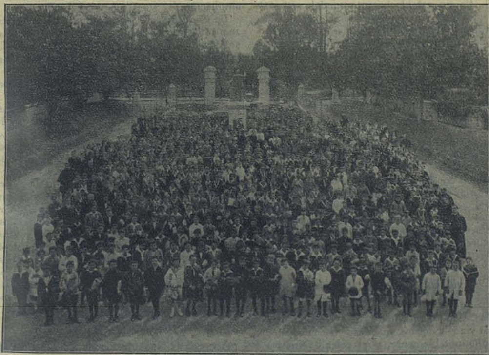
Villa Colón (Uruguay) — Mas de 1000 niños de los Colegios Salesianos ante el Santuario de María Auxiliadora, celebrando el Cincuentenario.

Esta obra primordial de la actividad salesiana ha merecido y merece, en la Inspectoría de San José, particularísima atención. Puede decirse que no hay Colegio que no tenga anexo un floreciente Oratorio festivo.