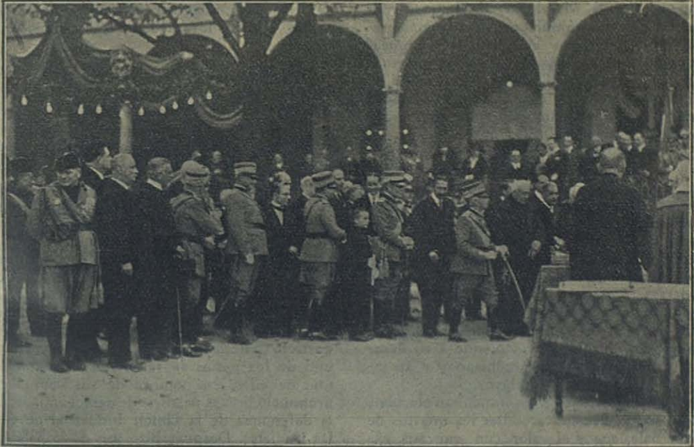
Florenia (Italia) — S. M. el Rey de Italia y nuestro Superior General asisten a la inauguración de una lápida.