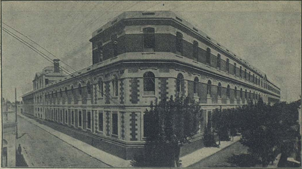
Rosario (Argentina) — Colegio San José, donde se reunieron los colonos italianos.