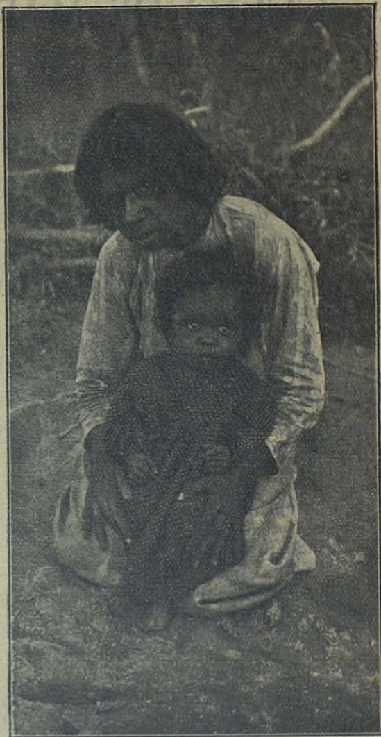
Australia - Madre e hija, indígenas de Broome.

Otro tanto nos sucede con los pobres indígenas ya bautizados . Sienten la nostalgia de la selva. Por eso, no nos extraña si de cuando en