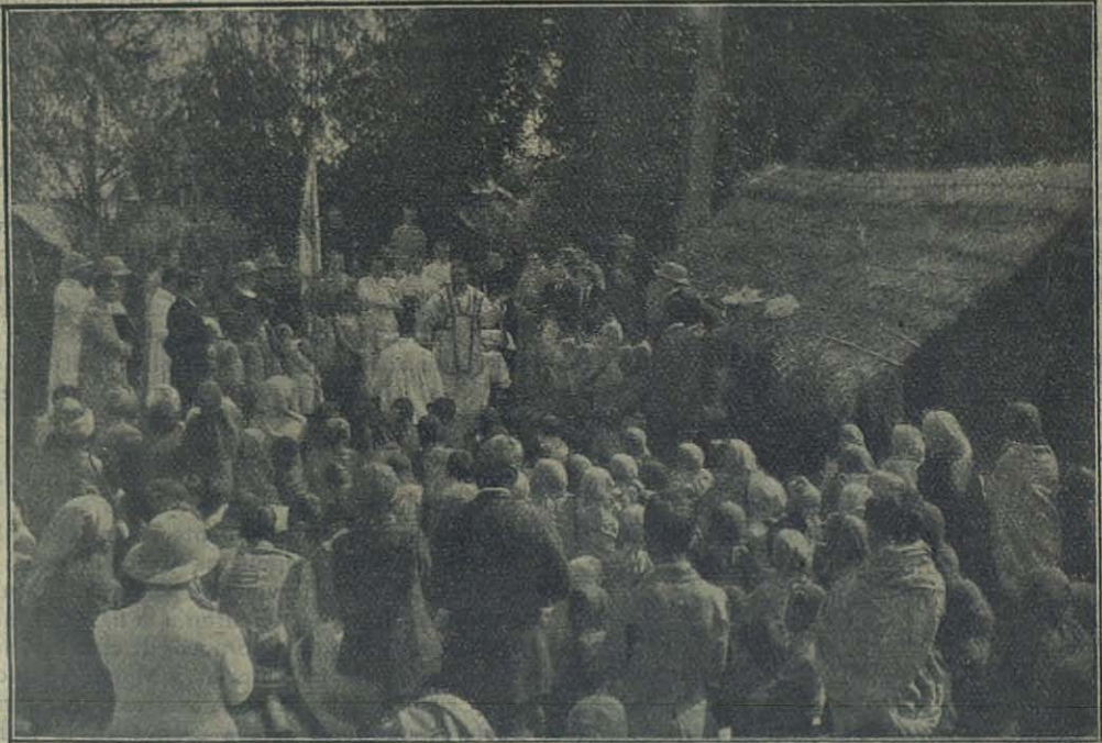
Assam (India) — En plena mision.

Los dos fueron de parecer de intentar la trepanación del craneo o mejor, dada la debilidad del enfermo, la extracción por medio de una jeringa, de la materia