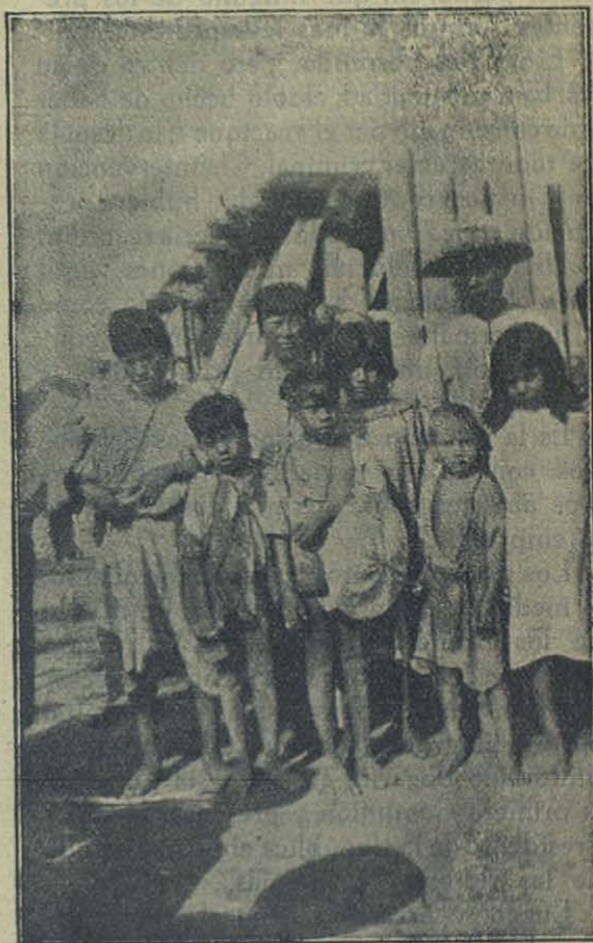
Chaco Paraguayo - Indios chamacocos bautizados.

con algunos de ellos y han reconocido en seguida al que les había tratado con cariño el año anterior. Es esta la razón que me guía en estas excursiones periódicas y no libres de sacrificios, en compañía de nuestros misioneros: crear en los indios la impresión primero, la convicción después, de que hay almas dispuestas a confundirse