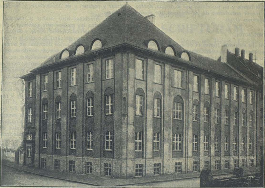
Bamberg (Baviera) — Nueva Casa Salesiana y personalidades que asistieron a la inaugurac.ón.