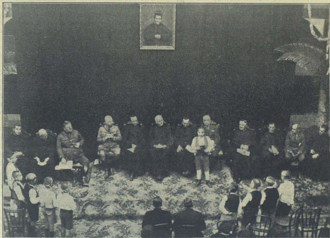
Cádiz — Los simpáticos bailadores de la Jota ante la Presidencia.

A la una de la tarde del mismo día los Cooperadores Salesianos ofrecieron al amado Padre un banquete en el que reinó familiaridad y alegría.