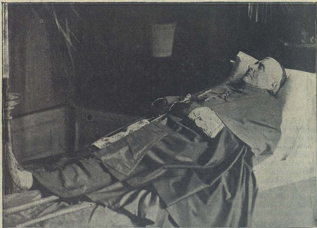
El cadáver del Cardenal Cagliero en la Capilla ardiente.

Cuando se trató de hacerle una operación quiso ver antes la sala operatoria, que, preparada con todas las exigencias higiénicas, era capaz de impresionar. Pero él no se inmutó y cuando todo estuvo dispuesto dijo a Mons. Guerra: « Ayer me confesé; estoy en las manos de Dios » y continuó hablando con naturalidad y así sufrió la delicada operación, sin cloroformo ni anestesia, sufriendo y rezando.