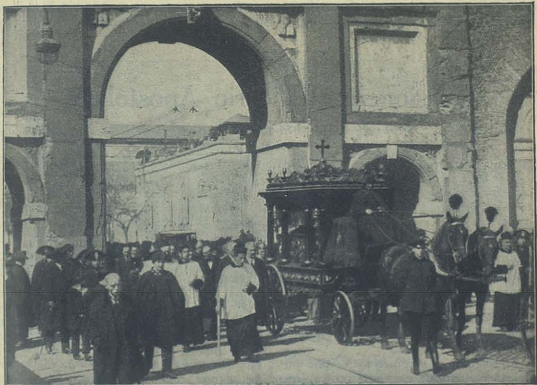
Hacia el Campo Verano.

El mismo Don Bosco le confió también el cuidado especial de los clérigos, la clase de teología y, desde 1862, la instrucción dominical a los alumnos internos del Oratorio, reservándose para sí las interesantísimas narraciones de Historia Sagrada, por