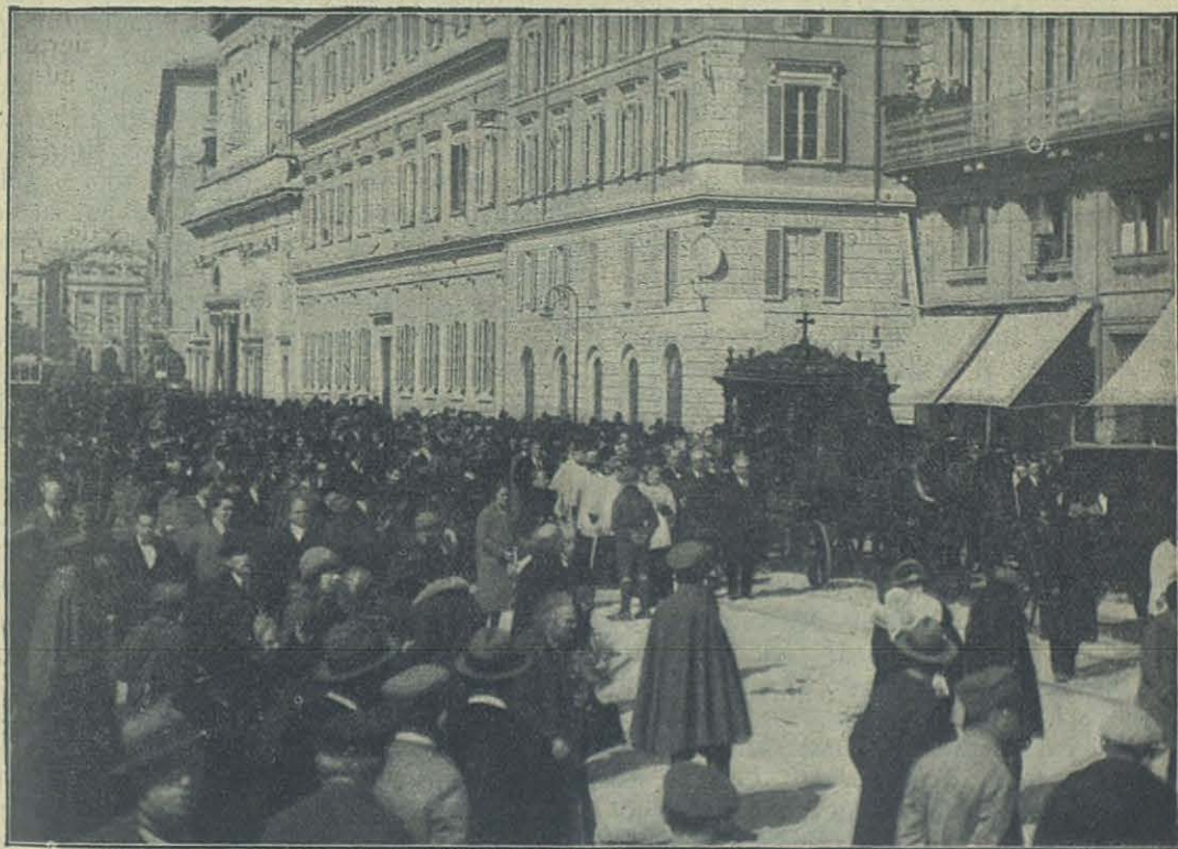
Autoridades y pueblo asisten al entierro.

El mismo Don Bosco había empezado a dar clase de canto a sus primeros alumnos — canto, juegos, teatro, toda diversión honesta e higiénica era un gran elemento de su sistema educativo, — pero aumentando su trabajo, pues su campo de acción se iba extendiendo más y más, fué aprovechando las