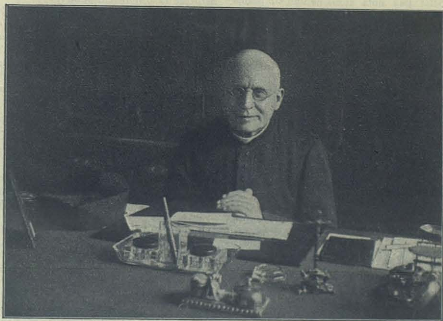
Nuestro Superior General, Rvdmo. D. Felipe Rinaldi, a quien España agradecida ha recibido en triunfo.

El miércoles día 17 lo pasó el reverendísimo P. Rinaldi visitando las casas que tienen las Hijas de María Auxiliadora en Valencia y Torrente, y aún pudo dedicar un rato a hacer algunas visitas, recibir a la Junta de la Archicofradía de María Auxiliadora y entretenerse con los antiguos alumnos, a quienes dió una breve, pero interesante confe-