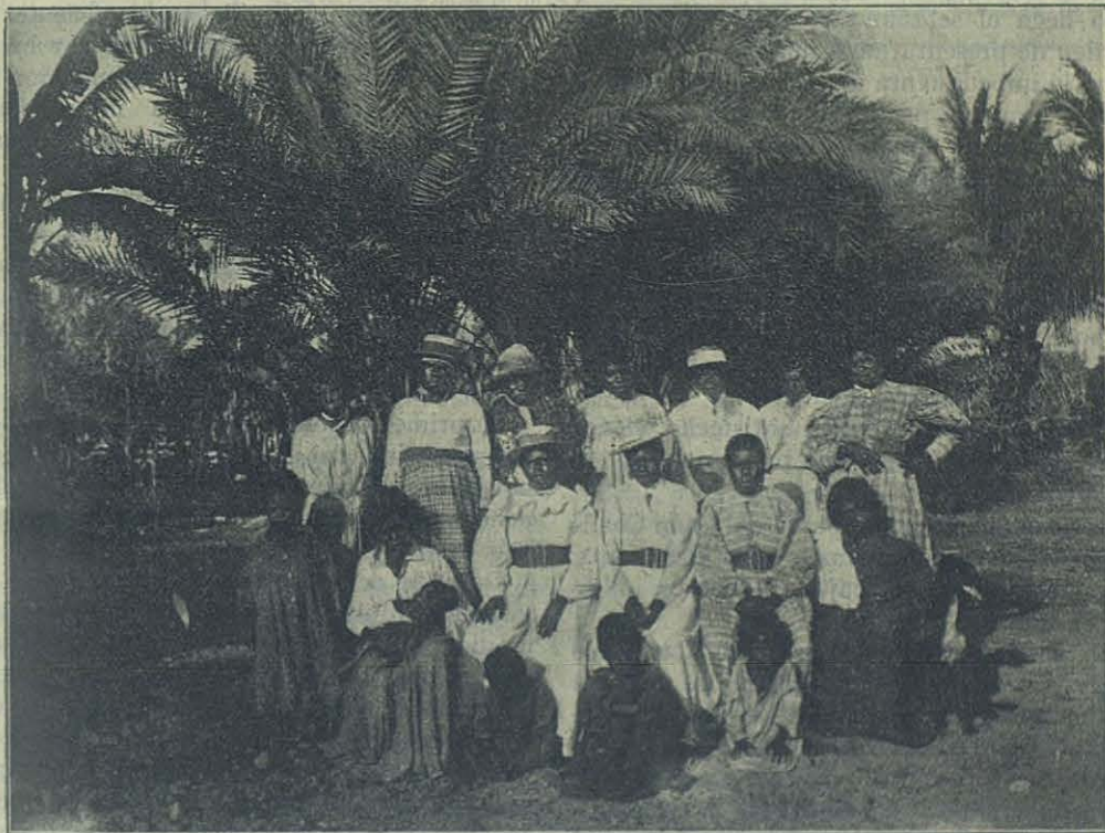
AUSTRALIA (KIMBERLEY) — INDÍGENAS CRISTIANAS DE BEAGLE BAY.

Esta parroquia de Carnarvón data de pocos años, pues antes solo de vez en cuando solía