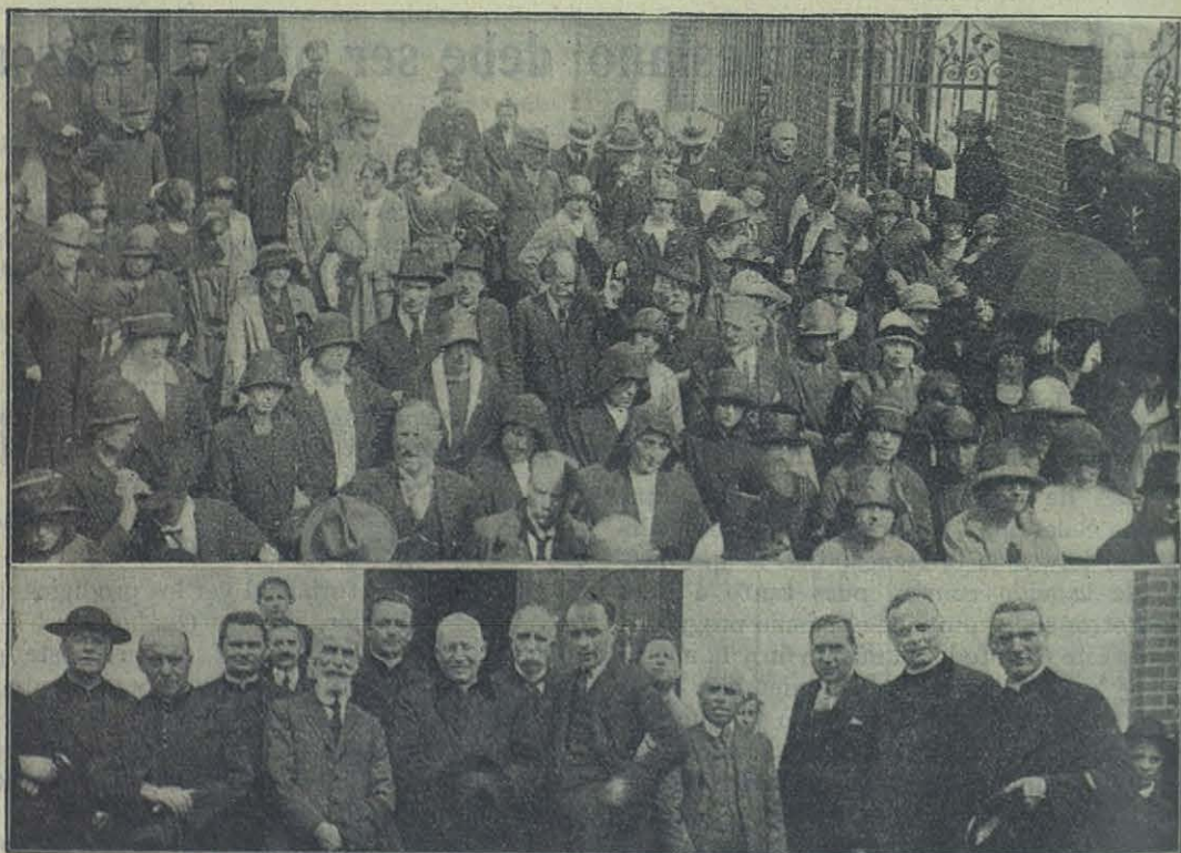
CASTELNUOVO DE ASTI. — LOS MAESTROS DE LA "UNIÓN D. BOSCO" DELANTE LA CASA NATIVA DE D. BOSCO.

Es más. En los solemnes momentos de la última cena, cuando Jesús dió a sus Apóstoles los últimos recuerdos, les repitió las mismas palabras, expresión suave de la más consoladora