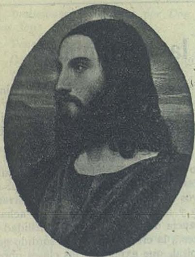
JESÚS QUE ESPERA.

Cuando el progreso es meramente material, cuando la cultura se divorcia del Evangelio no hay felicidad posible, todo es engaño y principio de disolución. Observad sino a nuestra sociedad, que hace gala de vivir entre los esplendores de admirables conquistas, que a boca llena llama progreso. ¿Somos hoy más felices que lo fueron nuestros padres? ¿No nos torturan el dolor y las enfermedades tan a su placer y