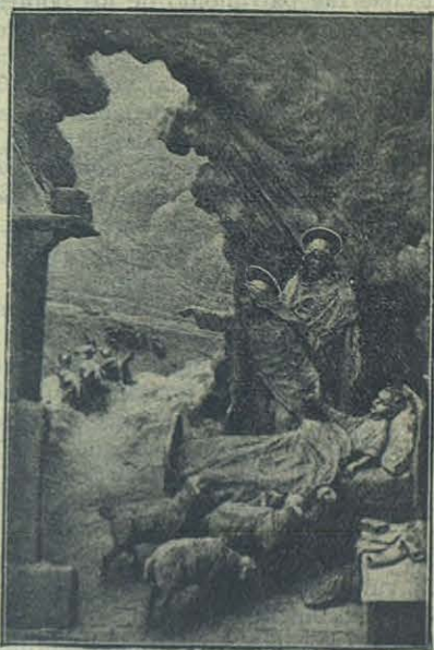
EL PRIMER SUEÑO DE DON BOSCO.