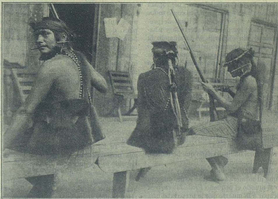
ECUADOR. — JÍBAROS DE LA MISIÓN LIMPIANDO SUS ARMAS.

experimentaría cuando, al elevar la Sagrada Hostia... veo que el Santo X de la Redención, se encontraba con el emblema de la serpiente infernal, con la serpiente X que pendía sobre mi cabeza con la boca abierta.