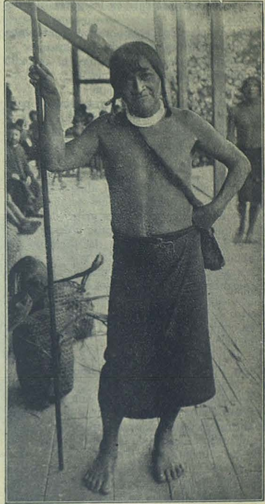
El jíbaro TANDU EN LA MISIÓN DE MÉNDEZ.

— Tu eres el Padre bueno que, cuando yo salí de Gualaceo , me diste mucho dinero para comprar chicha, simientes y alimentos para el viaje. Ahora me estoy muriendo. Me duele