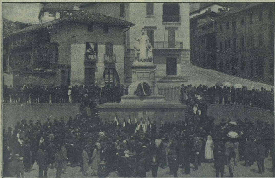
CASTELNUOVO DE ASTI. — LOS MAESTROS DE LA "UNIÓN DON BOSCO" ANTE EL MONUMENTO DEL MAESTRO.

Y no temo empequeñecer la figura sublime del Siervo de Dios concentrando toda su gran-