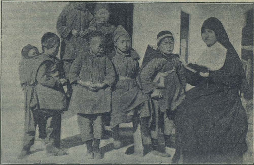
Las Hijas de María Auxiliadora en China.

Esta obra de caridad desinteresada — observa Monseñor Versiglia — realizada, no sólo en beneficio de los cristianos, sino también de los paganos, no puede menos que producir tarde o temprano hermosos frutos. Pruébalo ya el aumento de estima y consideración hacia el