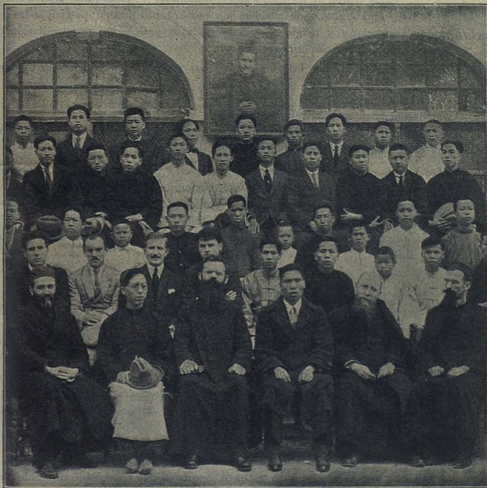
Ex-alumnos del Orfanotrofo Salesiano de Macay (China).

Redacción y Administración: Via Cottolengo N. 32 - TURIN, 9 (Italia).