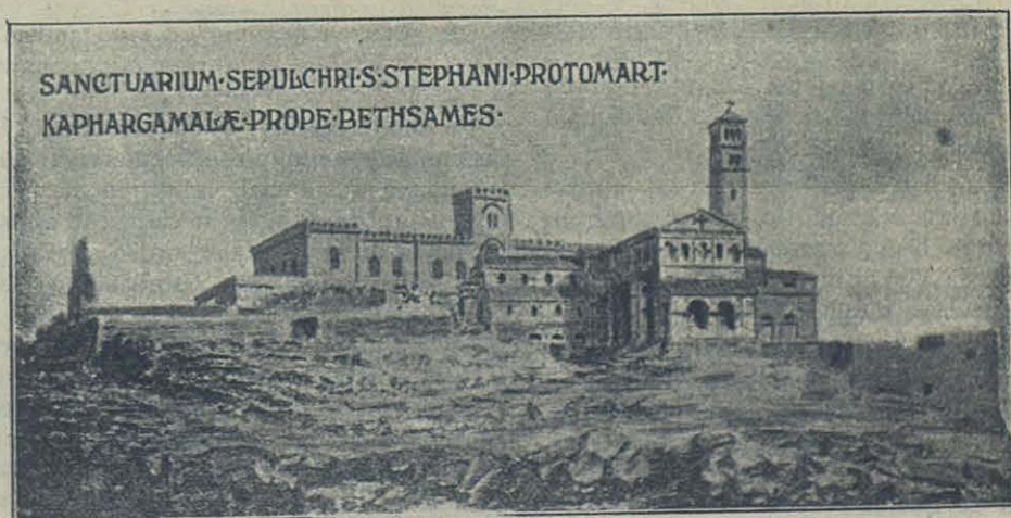
Proyecto de reconstrucción del Santuario sobre el Sepulcro de San Esteban.

el Calendario giorgiano de Mar Saba : Siglo VII). No obstante, las inscripciones del pavimento no indican su nombre, sino los de santos mártires desconocidos. En Beitgemal la inscripción está demasiado mutilada para indicar nombre alguno; pero el nombre de Esteban y de Gamaliel se recuerdan en los nombres del grandioso monasterio y del valle entero de San Pablo ( Nebi e Wadi Bulos ).