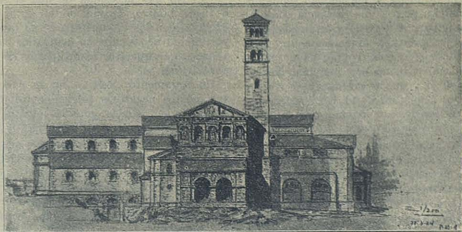
El nuevo Santuario sobre el Sepulcro de San Esteban (vista norte).

II. — La carta de Luciano señala Kafargámala como villa o casa de campo de Gamaliel. Ahora bien, en la región se presentan ruinas de otras villas: villa Caiphae , villa Claudia etc... Aun ahora confinando con Beitgemal está Bredge , casa de campo del Patriarca ortodoxo.