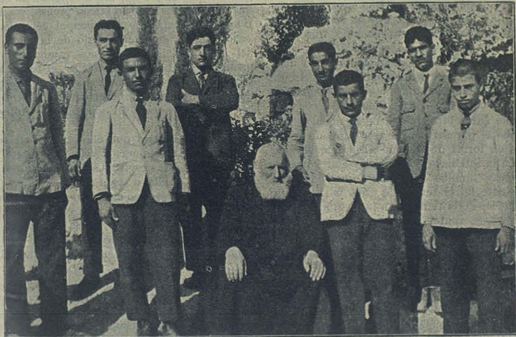
Alumnos licenciados el año pasado en la Escuela agrícola de Beltgemal.

corazón y a la conciencia; si es un ángel de luz que con su resplandeciente mirada arroja lejos de sí las tinieblas de la ignorancia, no es menos cierto que las malas lecturas son enemigos domésticos de pernicioso influjo, venenos más desastrosos que la morfina, cocaína y todos los alcaloides que degeneran la raza y convierten en idiotas a los hombres, son más funestos que las malas compañías, más eficaces que el mismo demonio para pervertir los corazones.