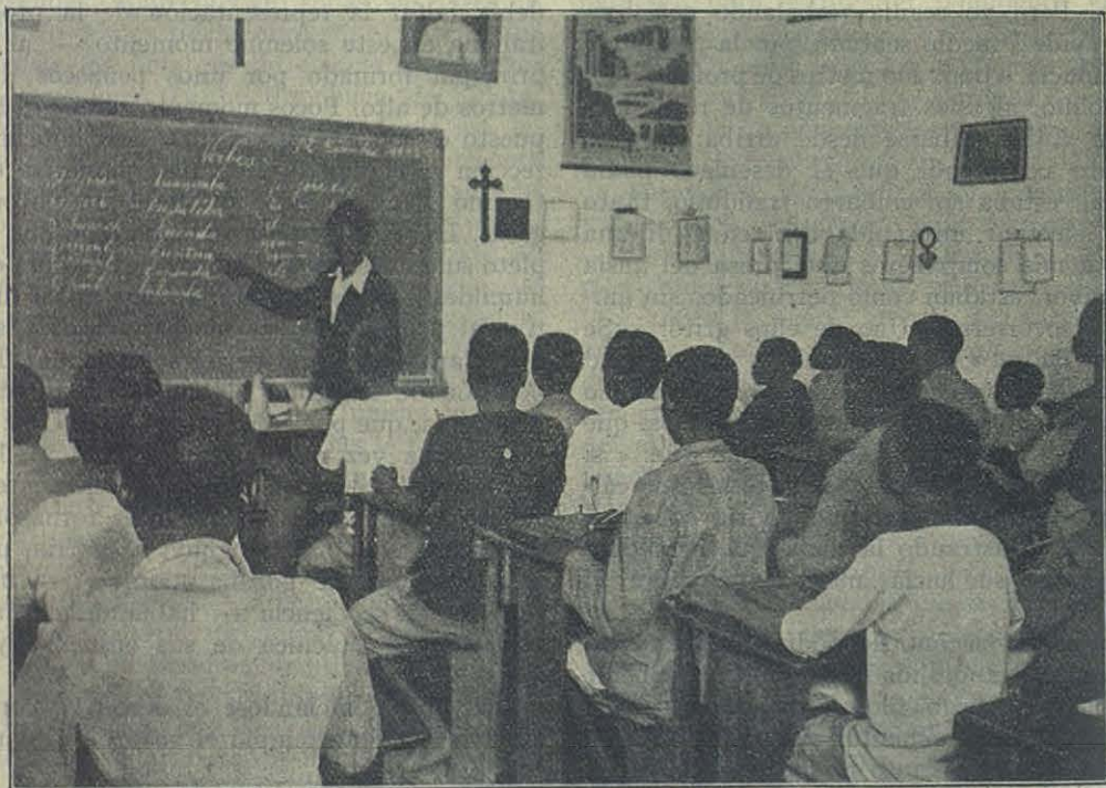
Maestro indígena que enseña en nuestra escuela de Ellsabethville (Congo belga).

Si quisiéramos ahondar más y saber la causa verdadera de tanta intrepidez y de tanto sacrificio, nos daría la respuesta, nos despejaría