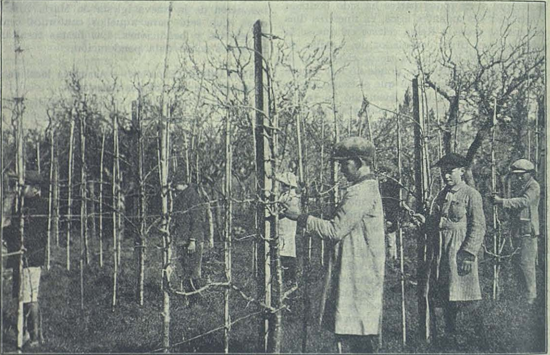
Ejercitándose en la poda. Alumnos de la granja agrícola de Uribelarrea.

En sus 400 Ha. de terreno, se desarrollan todas las industrias ganaderas y agrícolas del país. En esos inmensos campos pastorea gran número de cabezas de ganado, vacuno en gran parte, cuya leche y carnes abastece el consumo de varios co-