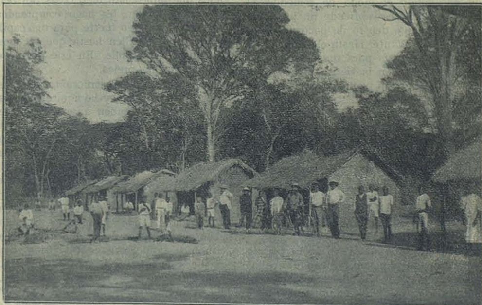
Las primeras casas de los alumnos indígenas de Elisabethville (Congo belga).

Yo creo que curé más de cien llagas, ¡pero qué