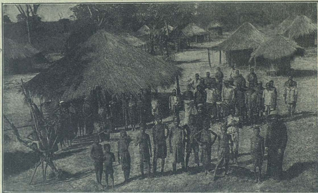
Vista general de Sindalka (Congo belge).

Así quedará demostrada la virtud creadora, irresistible y eterna del Cristianismo, después de cuya predicación, los pueblos no pueden perecer para siempre, ni todo el furor persecutorio de sus enemigos puede desterrar su influencia social; que es tal la fuerza fructificadora de esta semilla, que aun enterrada bajo la balumba inmensa de las ruinas de la civili-