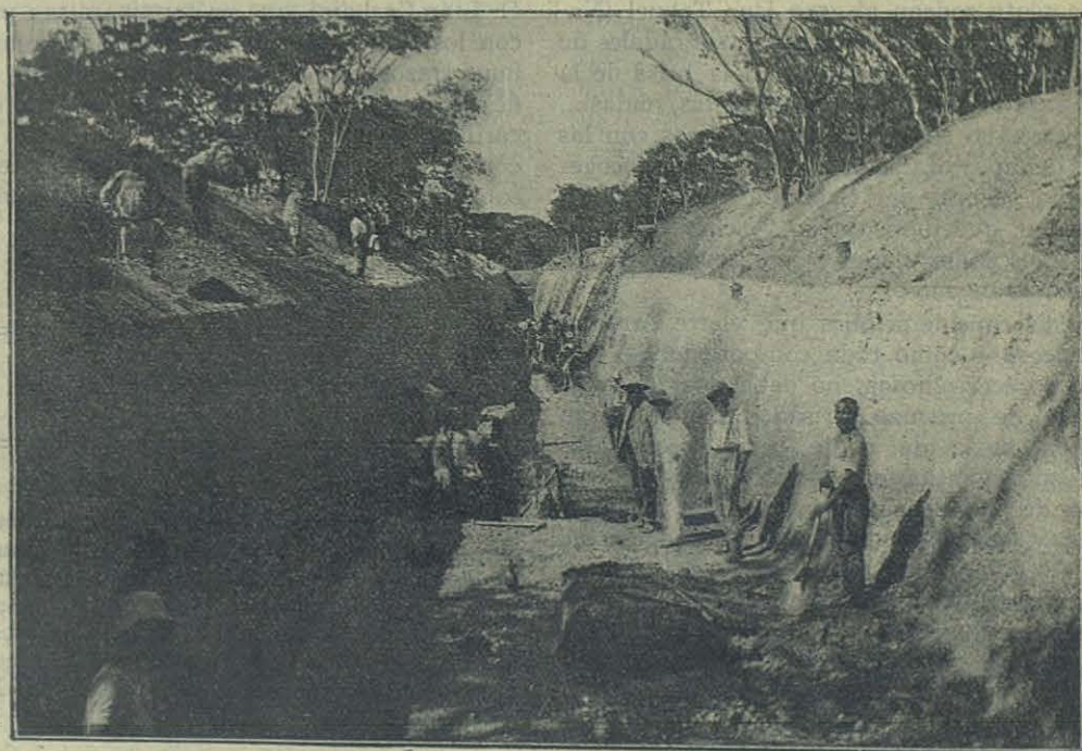
Un gran canal abierto con los negros en la granja agrícola de La Kafubu (Congo belga).

Aunque el Padre Carbajal se muestra un conversador insuperable en la relación de sus viajes, hay momentos en que su inspiración de poeta campea libremente. Las fatigas del camino no serán parte para agobiar su fantasía cuando tras las rudas peripecias del descenso del Domuyo, llegará a la « Casa del Padre » cavada en la peña viva; su temperamento soñador, sintonizará con la naturaleza que le rodea y nos dirá: « Yo que dormía muy al fondo de la casa de piedra — o gruta de toba pomecea, — pasé algún tiempo en vigilia a causa de