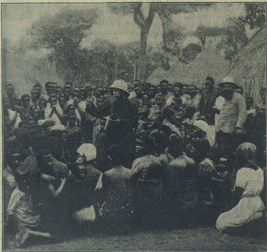
Enseñando el catecismo. Kinlana (Congo belga).

esta nueva misión. La escasez de personal me ha obligado volver a Elisabethville para dar clase a un grupo de niños blancos, que me separaron de mis catecúmenos hasta el sábado. Pero yo voy a encontrarme con ellos cada semana durante 24 horas. Será necesario, para suplir mi ausencia, encontrar un buen catequista negro que continúe mis instrucciones. Espero que de un día a otro encuentre en mi camino esta