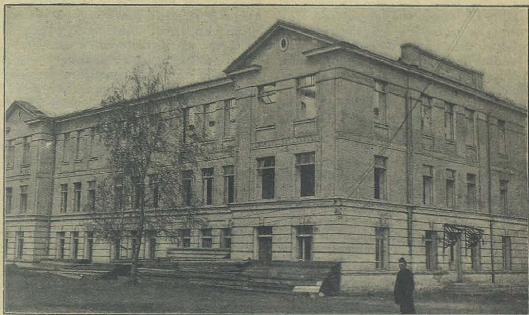
Colegio Salesiano di Rózanystok (Polonia).

Si nos fuera dado conocer la eficacia, el fruto