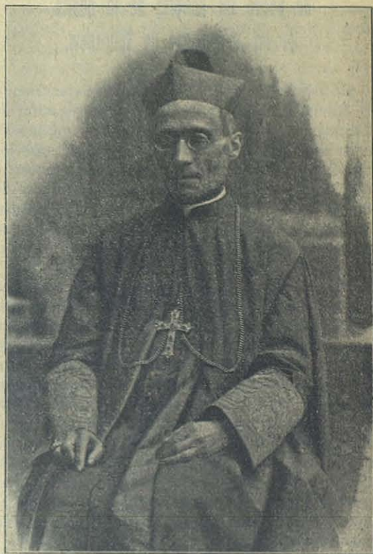
Mons. Ernesto Coppo.

Monseñor Coppo es de Rosignano Monferrato, Italia. Hizo sus primeros estudios en los colegios salesianos, cursando, después, la carrera eclesiástica en el seminario de Casal, donde fué profesor durante dos años. Ordenado sacerdote el 1892, ingresó en la Pía Sociedad Salesiana, y en el 1898 partió para Norte América, ejer-