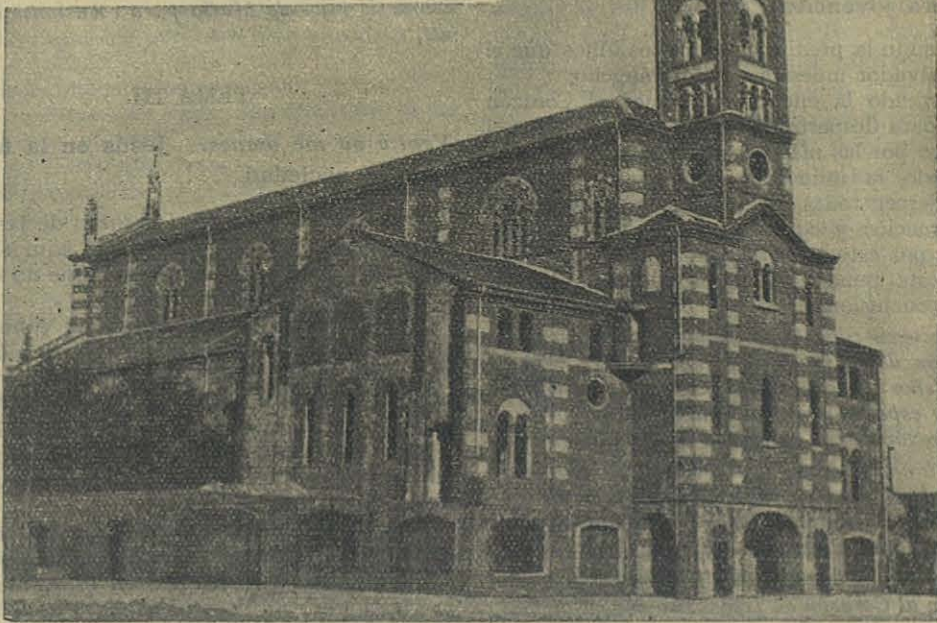
CASALMONFERRATO. - El templo del Corazón de Jesús visto de lado.