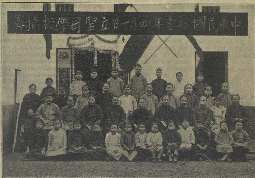
CHINA. - Misiones Salesianas. Escuela "María Auxiliadora" de niñas en Shiu-Chow.

En el cincuentenario de su fundación, no podían las Hijas de María Auxiliadora hacer un obsequio más grato a su celeste Protectora, a quien está dedicada esta nuestra Misión. A la par que aplaudimos su rasgo generoso, y damos por el gracias a Dios, rogando por las afortunadas que van a sembrar los tesoros de