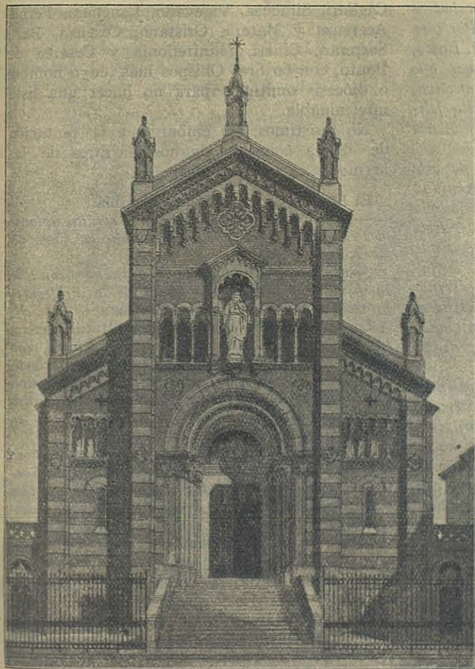
CASALMONFERRATO. - Sagrado Corazón de Jesús.