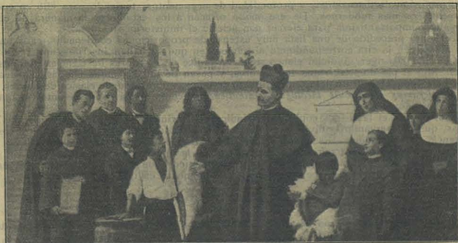
D. Bosco despidiendo a los primeros Misioneros Salesianos.

Sumario. — El Revmo. Rector Mayor D. Felipe Rinaldi a los beneméritos Cooperadores y Cooperadoras de la Obra Salesiana. — Ecos del I Congreso Nacional Italiano en honor del Corazón de Jesús. — En el campo de los sueños de D. Bosco. — Importante curación atribuida al Venerable D. Bosco. — Aniversario de D. Pablo Albera. — Bibliografía. — De nuestras Misiones de China: Escuela "María Auxiliadora" para niñas en Shiu-Chow. — Episodios de Misiones: Un ángel más en el Cielo. — Despedida de nuevos Misioneros. — Primera Asamblea Nacional de los Antiguos Alumnos de Polonia. — Muerte ejemplar de un Cooperador modelo. — El Sto. Padre y los Antiguos Alumnos Salesianos. — Culto de María Auxiliadora - Gracias de María Auxiliadora. — Por el mundo Salesiano. — Los que mueren.