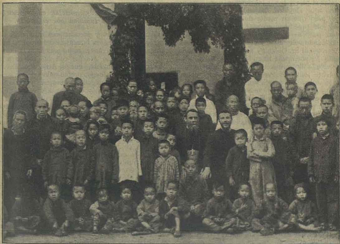
Inauguración del nuevo Orfanato-Cristianos de Shiu-Chow.

Se llamó a los albañiles, que improvisaron con