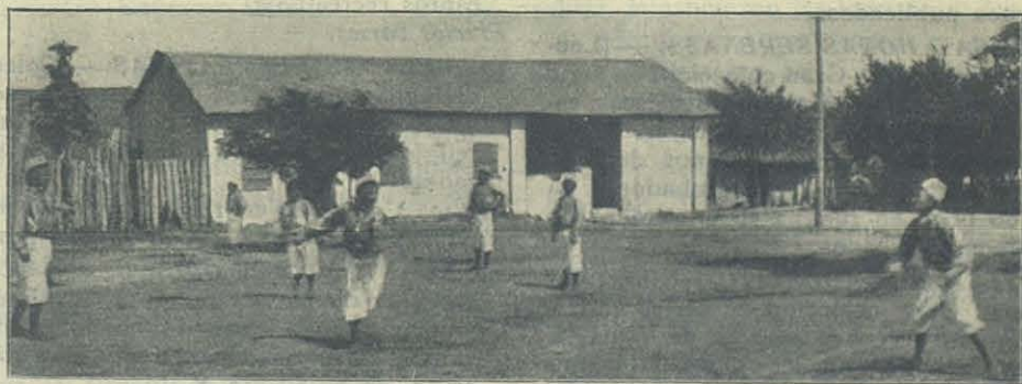
Misiones Salesianas del Matto-Grosso. - Niños indios durante el recreo.