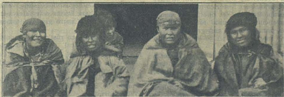
Misiones Salesianas de la Tierra del Fuego: Una familia Cristiana.

Sumario. — Hablemos de Misiones. — Recordando a nuestro Patrón. — El Primer Nuncio de la nueva Nación Polaca. — Tesoro Espiritual. — De nuestras Misiones: China. — Episodios de Misiones — Con rumbo al Assam. — Culto de María Auxiliadora. — Aurora de Mayo. — Gracias de María Auxiliadora — De los Colegios de las Hijas de María Auxiliadora. — Bibliografía. — Por el mundo Salesiano. — Los que mueren.