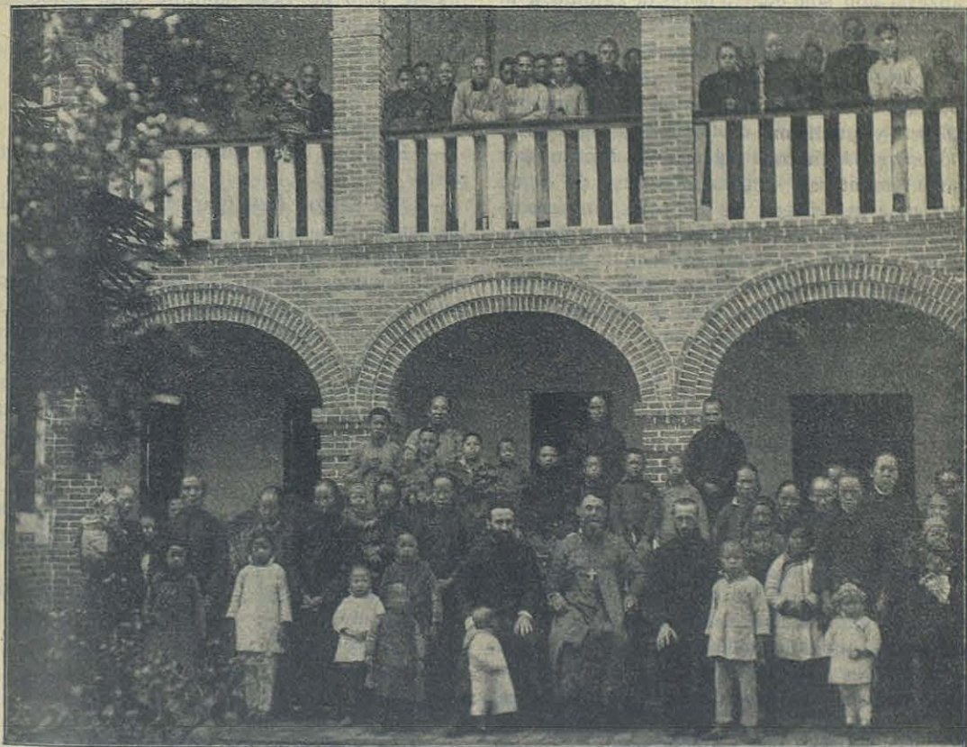
CHINA. — Mons. Versiglia rodeado de una cristiandad del Vicariato de Shiu-Chow.

Llegamos a Tai-Wan a eso de las cuatro de la tarde; y después de tres cuartos de hora de caminata, atravesábamos los umbrales de la Misión. Nuestra cristiandad es sumamente pobre: las pocas casas y el escaso terreno que