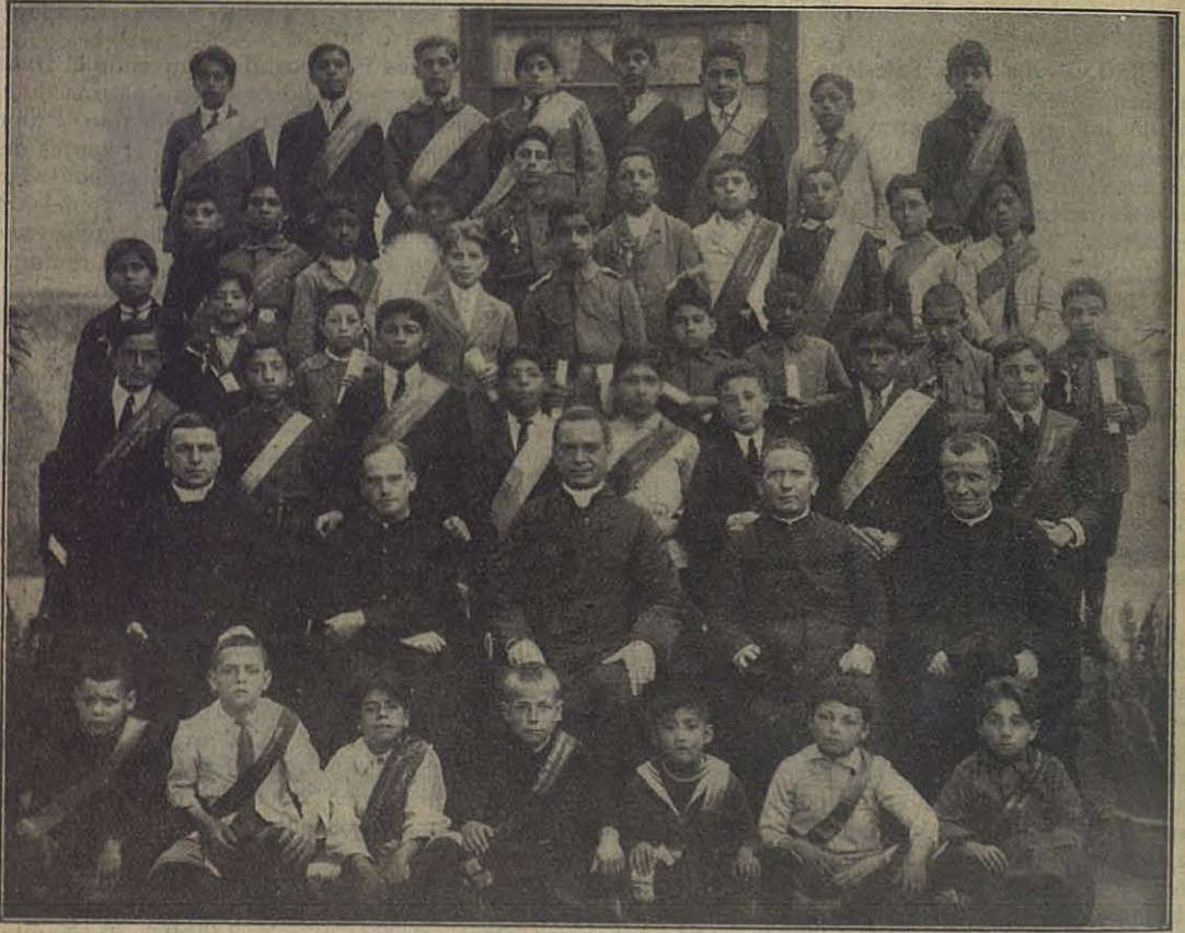
LIMA (Perú) - Niños premiados en el certamen catequístico.

Corona la fachada principal una torre que se eleva a 56 metros.