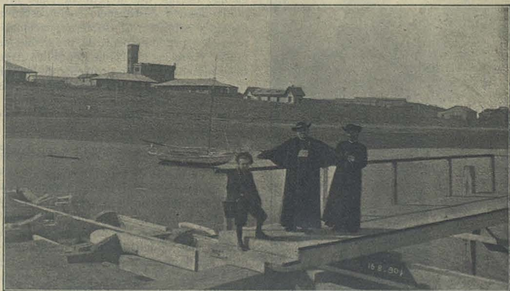
Su Excia. Mons. Juan Cagliero sobre el puente de Chosmalal, el 16 de agosto de 1901.

Voy a otra cosa. V. sabe las maravillosas y terminantes predicciones que hizo nuestro Vble. Padre Don Bosco acerca de las incalculables riquezas que atesoraban estos apartados territorios, en una época en que parecía locura presumirlo. En cuanto a mí es indudable de que los misteriosos sueños, de donde el Siervo de Dios sacaba sus estupendas provisiones, provenían