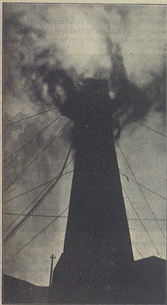
El pozo de petróleo de Comodoro Rivadavia perforado a 990 metros, en los primeros días de actividad.

« Acaba de alumbrarse estos días un pozo de petróleo, que parece un volcán. Mas de trescientos obreros hubieron de trabajar varios días día y noche para encauzar y contener el torrente, del líquido mineral, que brotaba en cantidad