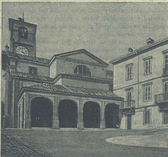
Iglesia Parroquial de Castelnuovo d'Asti (Piamonte) donde fué bautizado el Vble. Juan Bosco (agosto de 1815).