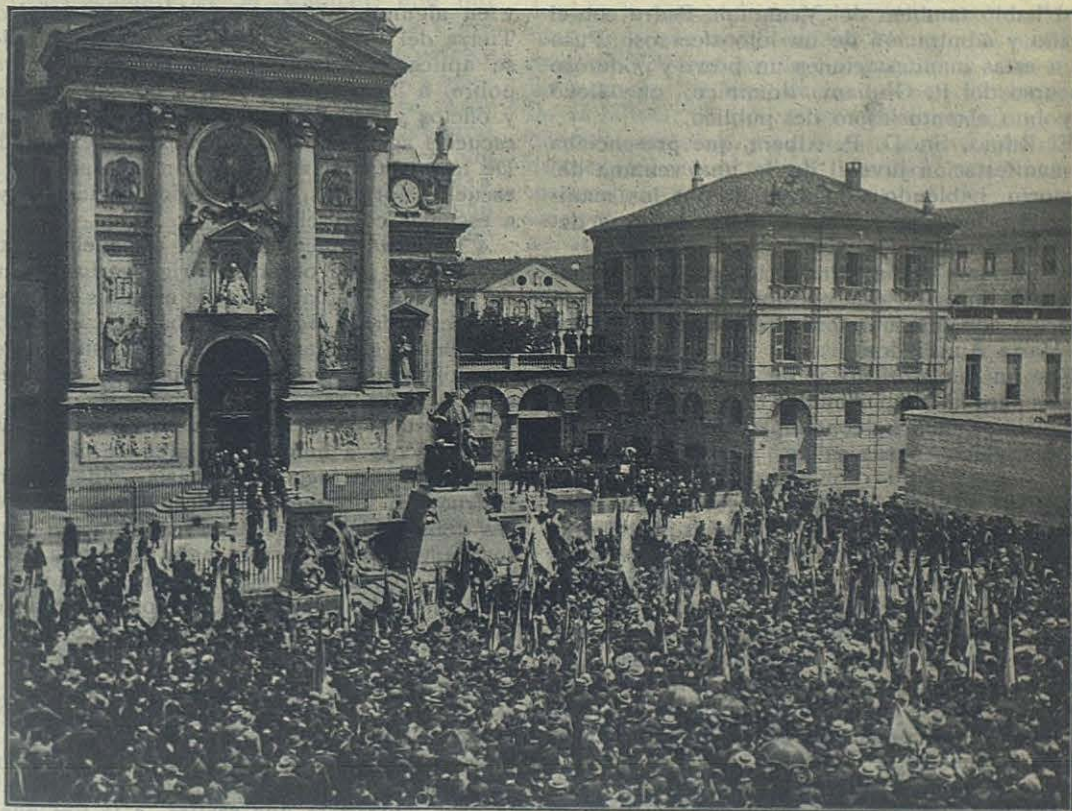
TURIN — Diez mil jóvenes católicos en torno del Monumento de Don Bosco.

TURIN. — Diez mil jóvenes católicos en torno del Monumento de Don Bosco. — El domingo, 12 de junio, fue un día de gloria para nuestro Vble.