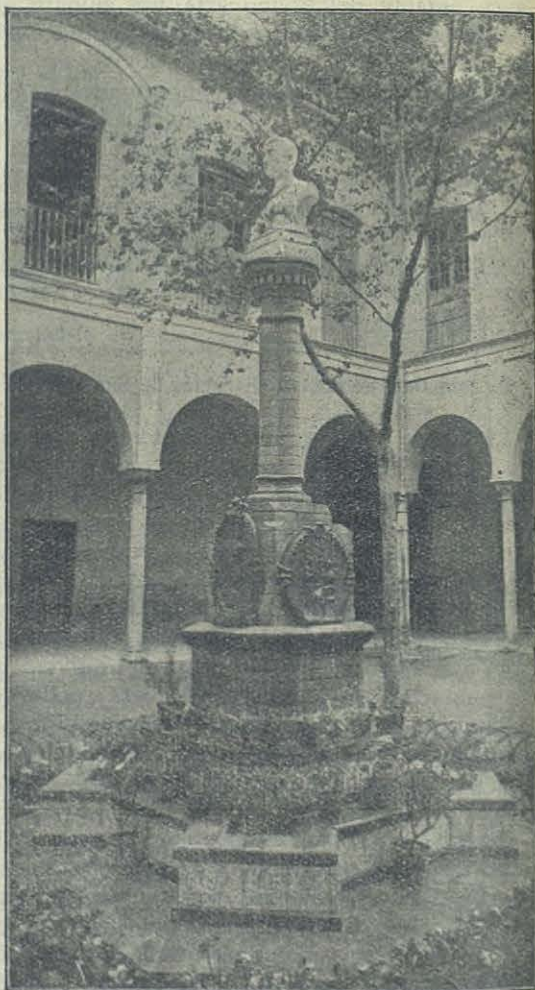
SEVILLA (Esp.) — Monumento de Domingo Savio, erigido en las Escuelas de la Sma. Trindad.

El primer casamiento que se efectuó aquí con edificante ejemplaridad cristiana fué el del