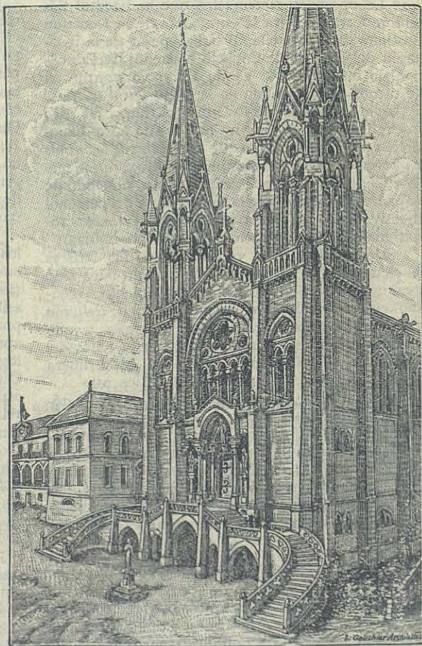
NAZARET — Templo de Jesús Adolescente.

Púsose manos en la empresa bajo la dirección del arquitecto, Sr. Luciano Gauthier, que trazó los planos. El suelo no podía ofrecer mejores condiciones por ser de roca durísima: pero faltaba la mano de obra capaz de trabajar en esa clase