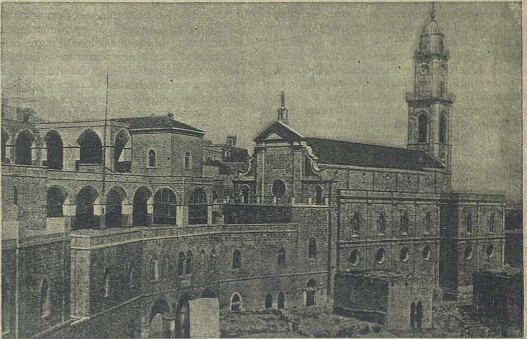
BELÉN (Palestina) — Vista general del Orfanotrofo Salesiano del Niño Jesús.

En resumen, en él tomaron parte un centenar