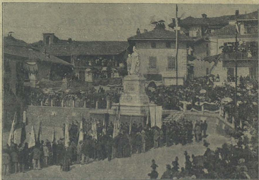
Monumento al Vble. Juan Bosco en Castelnovo de Asti - Turín (Italia) - Año 1898.