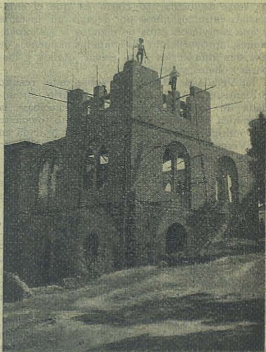
CUYABÁ: Nuevo pabellón para Escuelas Profesionales.

La banda de los Huerfanitos de la Piedad llenó el ambiente de entusiasmo y a lo acordes de sus vibrantes notas se enardeció la enorme concurrencia, llevando en sus pechos el mismo