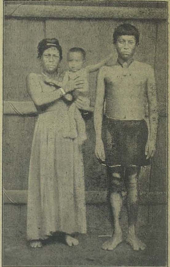
Tipos Tucanos de Río Negro.

El folleto termina con una lista de eximios Cooperadores, y unos proyectos que publicaremos más adelante.