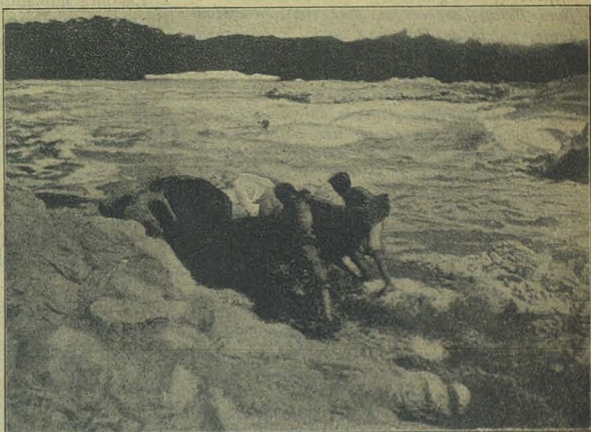
Viajando por un río

El 20, aniversario de la venida de los Sa-