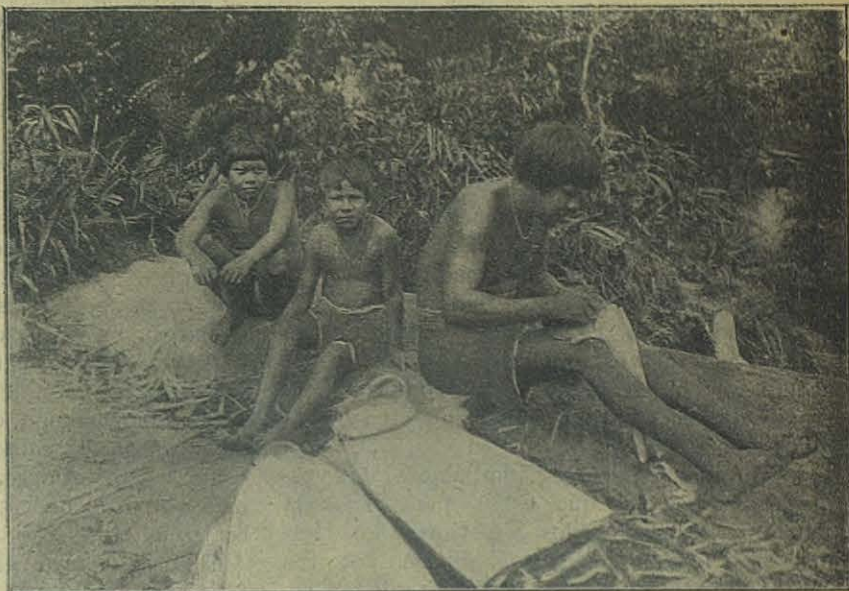
En la Prefectura Apostólica del Río Negro — Indios preparando máscaras.

Y unos días después: « El Cardenal ha interrumpido los negociados, el viernes (12 de febrero) todo recobrará su movimiento. Quizá queden en todo graves dificultades aún, si