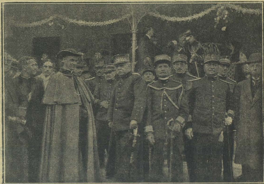
S. PAULO (Brasil) — Autoridades eclesiásticas y militares en las fiestas salesianas.

En espíritu, todos los hijos de D. Bosco acompañaremos al Emmo. Cardenal Cagliero, dando gracias a Dios, rogándole bendiga hasta el fin