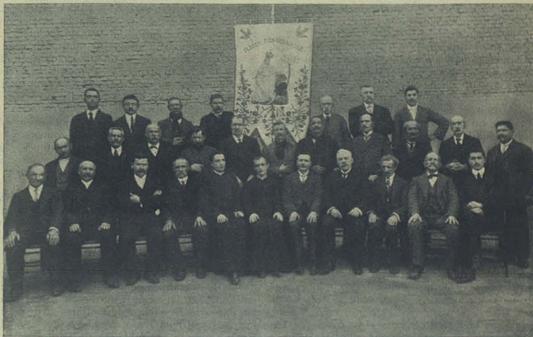
BUENOS AIRES — Cero Mater Misericordiae.

¡Agua de Dios! ¡cuánta impresión no causa a los extraños este solo nombre, y cuán diferente se lo figuran de lo que en realidad es! Esto me decía yo en los primeros días que paseaba en el Lazareto y