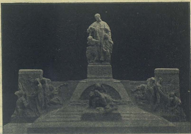
Monumento a D. Bosco (Boceto de Cellini).

belleza singular: la musculatura atlética y ruda del cacique fiero contrasta con las formas dulces y delicadas de las doncellas; también contrastan las acciones: el salvaje, altivo y bravo, cae de rodillas, dominado por la belleza que irradia de la Virgen, y le ofrece lo mejor que a su juicio tiene, lo que constituye su fuerza y poderío: el arco y la flecha; mientras las doncellas, acostumbradas ya al trato filial con la Reina del cielo, su auxilio y su madre, le ofrecen flores, símbolo de la pureza, la humildad, el amor. — Cerca de allí, se distingue una persona que se afana por