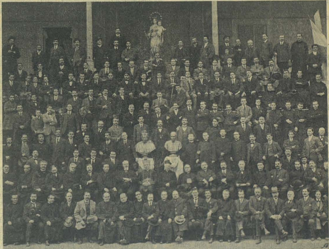
CATANIA — Antiguos Alumnos.

Manuscrita se hubiera quedado mi versión, tal vez para siempre, a no haber ocurrido una