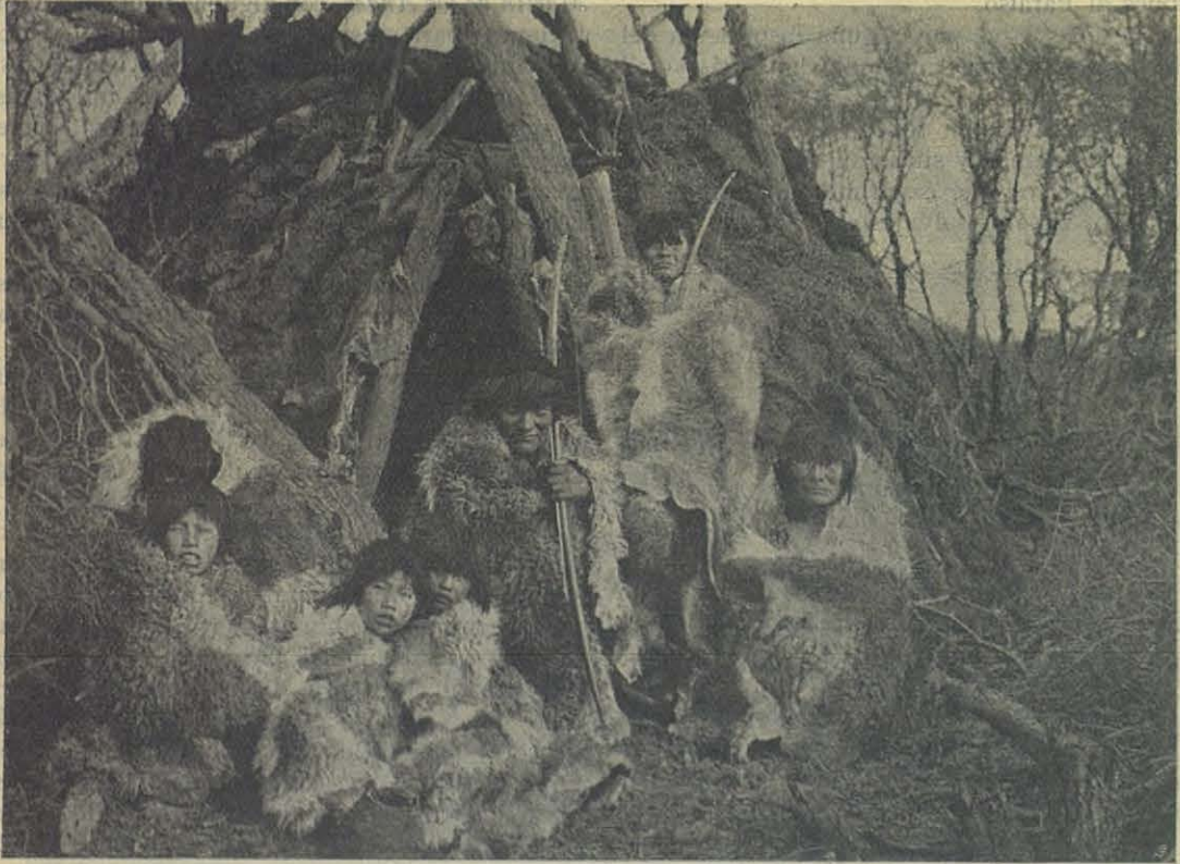
Indios Onas delante de la choza.

En Trelew somos tres sacerdotes con Parroquia, Colegio para externos, un Círculo católico para adultos, la Compañía de S. Luís para jóvenes, la Sociedad de S. Vicente de Paúl para señoras (está en formación), además debemos atender en lo espiritual a las Hermanas y a su floreciente Colegio, a la población de Puerto Madryn (a 75 kms. de distancia), y a la pobla-