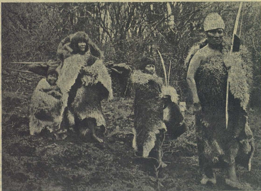
Indios Onas de viaje.

El día de María Inmaculada admití a la primera Comunión a un niño de cinco años. ¡Inocente criatura! ¡Justo era que el buen Jesús tomara posesión de aquella hermosa alma! Cuando lo llamé para examinarlo y ver si en realidad comprendía bien el acto que iba a hacer y si tuta conscientia podía admitirlo, se me presentó alegre y tranquilo. Aparentaba yo ignorar el por qué de su venida y le dije: — ¿Qué deseas? ¿Para qué has venido? — Y él sonriendo: — I taiddu racaguroga Jesú foghi Migera mettu modde i taddadugi codde i roinna . Yo deseo