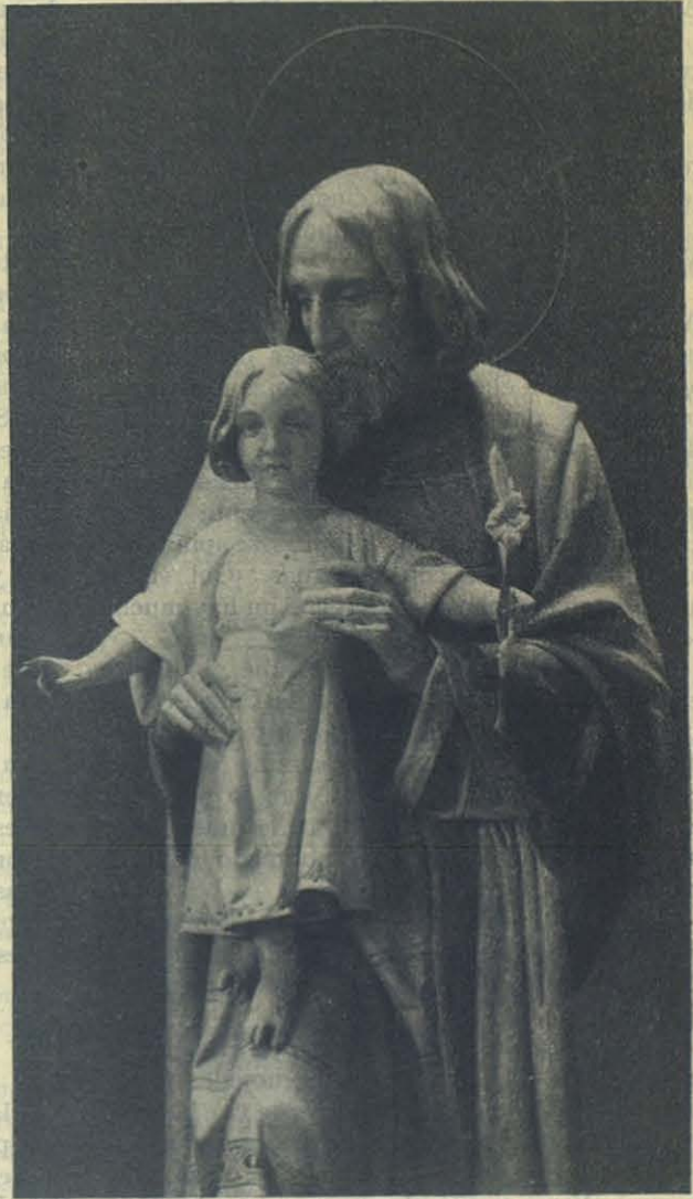
BARCELONA — La estatua del Santo en la nueva Iglesia de S. José.

Y esto dura toda la noche, sin interrupción. De 9 ½ a 10 ½ da concierto en la plaza la