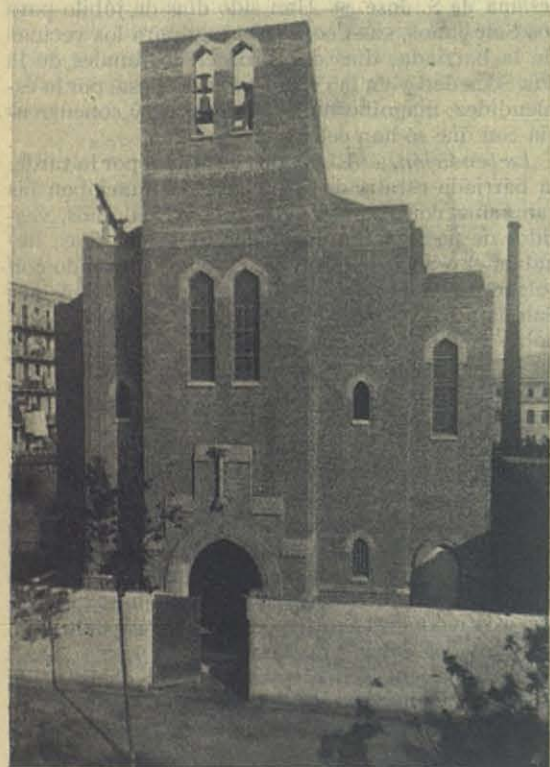
La fachada de la nueva iglesia de S. José. El campanario se elevará bastante aún.

tres años más tarde hasta terminarla felizmente. Dentro de la sencillez el arquitecto ha encontrado elegantes líneas que definen admirablemente la obra: dos series de columnas y apuntados arcos determinan a derecha e izquierda largas naves complementarias de la central, que es espaciosa, así como el crucero. Las columnas se yerguen esbeltas sosteniendo, por medio de originales y graciosos arcos, unas amplias tribunas que casi duplican la capacidad del recinto sagrado. La esbeltez del templo, la originalidad de las líneas y una factura toda