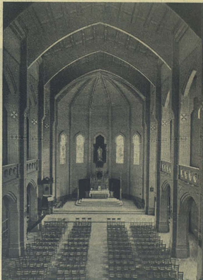
Interior de la nueva iglesia salesiana de S. José.