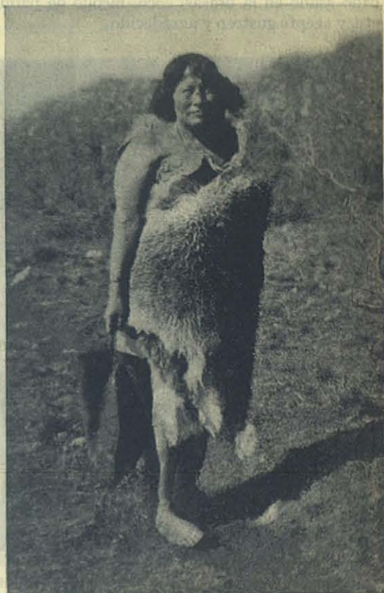
Tierra del Fuego - Indio Ona llevando agua en un cubo.