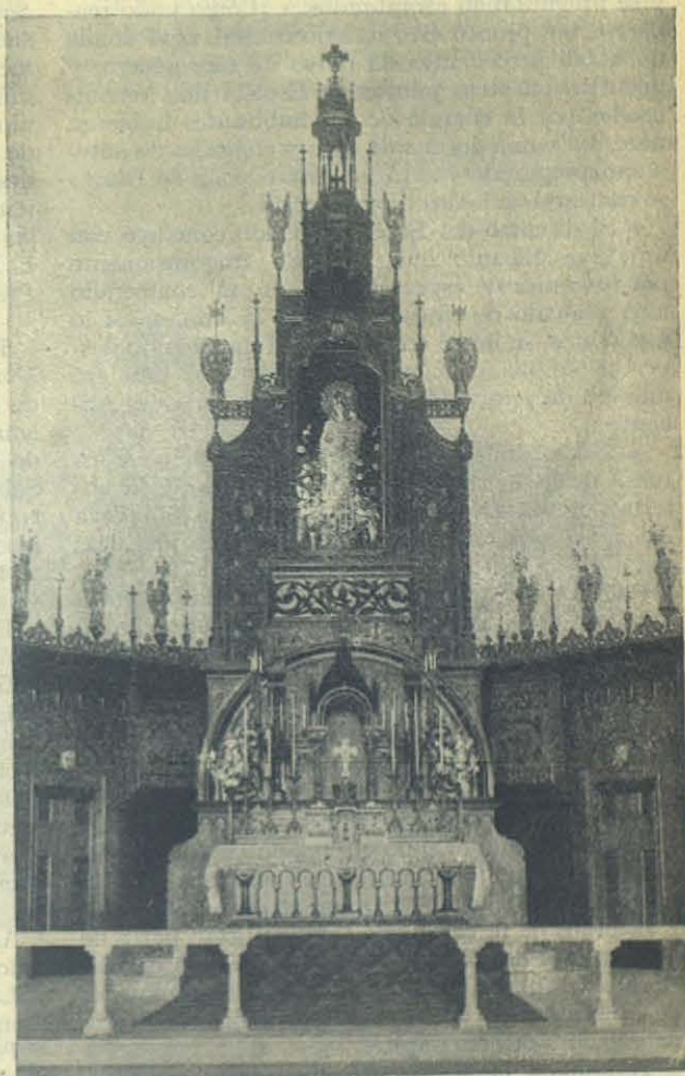
ALICANTE — El altar mayor. Obra de las Escuelas Profesionales Salesianas de Sarriá.