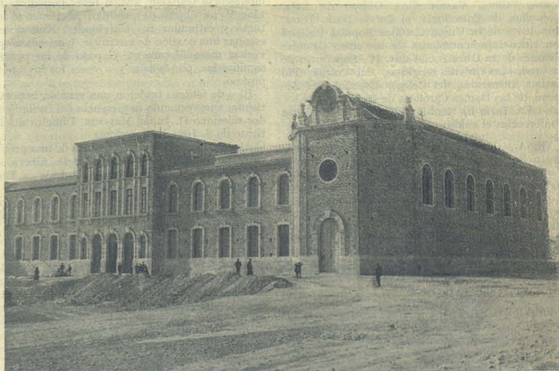
ALICANTE — La nueva Casa Salesiana.

En la América latina, desde Méjico hasta Magallanes, las condiciones varían: los emigrados italianos, franceses y prortugueses se asimilan fácilmente el español, aunque dando origen a un len-