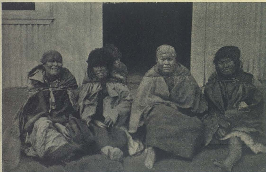
Tierra del Fuego — Indios Onas vestidos a la europea.

Aquella vista me impresionó profundamente; el niño era una de nuestros más queridos alumnos y tenía a lo más 12 años. Gracias a Dios, era muy bueno, y el día antes de su partida había hecho el ejercicio de la buena muerte, confe-