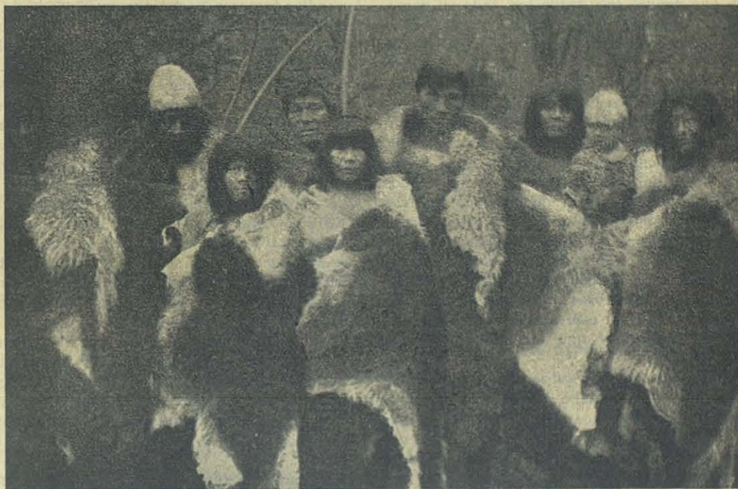
Tierra del Fuego — Indios Onas en su traje propio.

Deseaba que llegaran para la Natividad de la Santísima Virgen, pero no fué posible. Llegaron sólo el 10. Yo salí a 30 kilómetros. El retraso se debía a que habían practicado la ceremonia de la limpia o mondadura de los huesos, que traían en un cestito. Así se habían librado del hedor y trasportaban con facilidad su muerto. Pasé con ellos la noche y al siguiente nos pusimos en viaje, llevando yo por turno algunos niños a caballo conmigo.