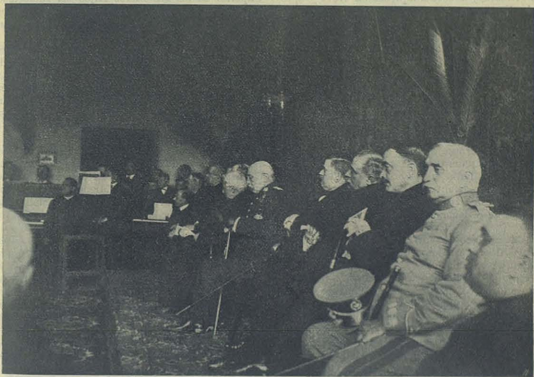
CORDOBA — El Sr. D. P. Albera en la velada.