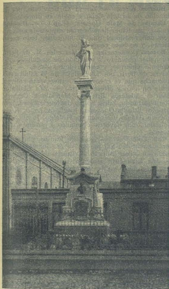
Punta Arenas. Monumento a María Auxiliadora.

de sus indagaciones, y claro es, que, desconociendo la verdadera causa, no pudo acertar con el remedio.