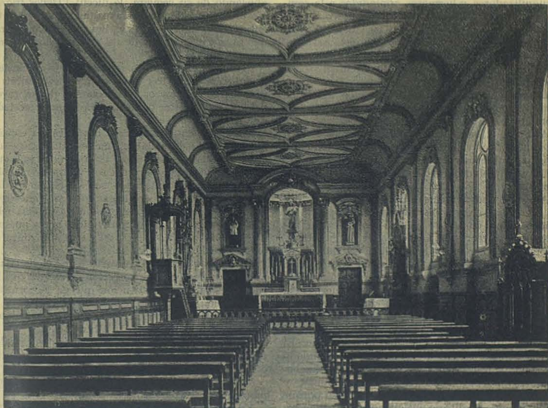
MADRID — Interior de la iglesia de María Auxiliadora donde se verificó la velada.