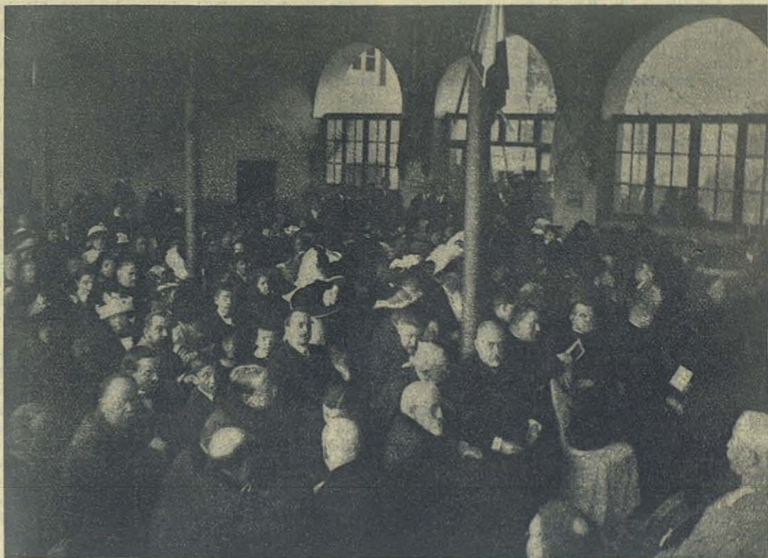
CORDOBA — El salón de la velada