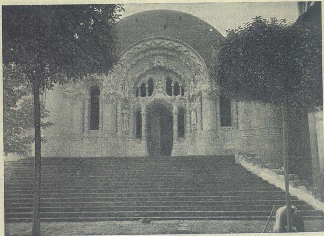
BARCELONA — Cripta del Tibidabo - Fachada.

Las tres secciones de arcos semicirculares que forman la puerta de entrada y ventanas laterales, quedan á su vez inscritas en otro