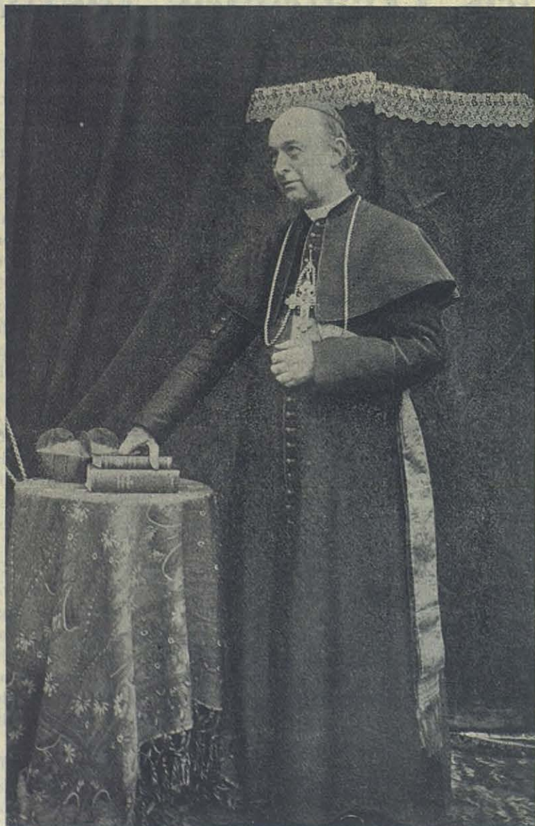
El Cardenal AGUSTIN RICHELMY ARZOBISPO DE TURÍN.