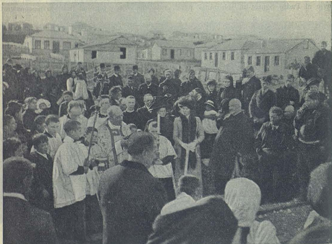
Mons. Fagnano bendiciendo la primera piedra de la Iglesia de S. Miguel.

El día de la bendición de la primera piedra de esta iglesia fué el domingo 12 de marzo. A las 4 p. m. el Rvmo. Mons. Fagnano circundado de clero numeroso y de muchedumbre de fieles, dió principio á la ceremonia según la fórmula del Ritual, asistiendo como padrinos el