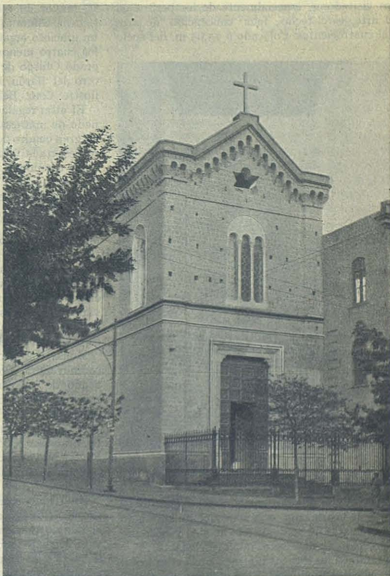
NÁPOLES — La nueva iglesia del Sgdo. Corazón en el Vómero.

« La iglesia es de elegantísimas líneas góticas