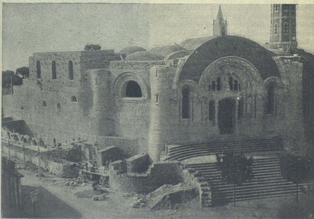
BARCELONA — Cripta del Tibidabo - Estado de las obras, Junio.

Las bóvedas correspondientes á las cinco