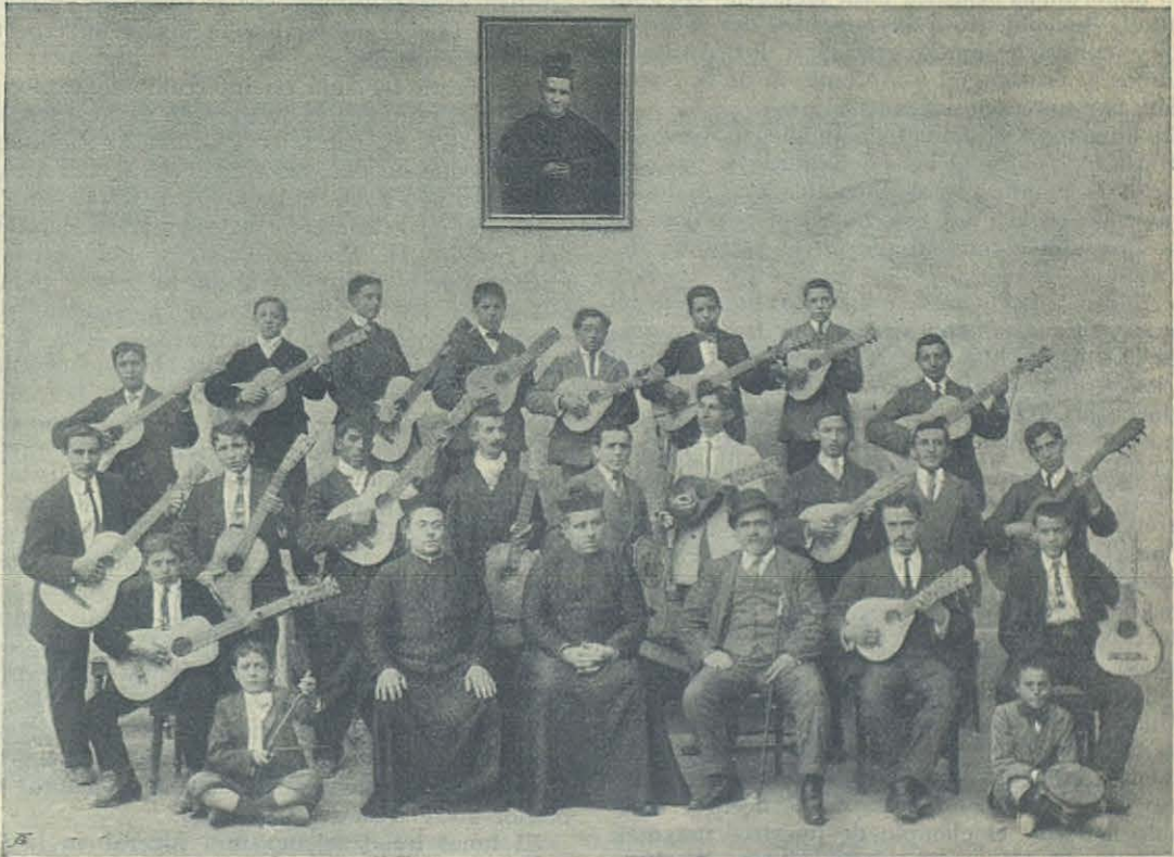
SALAMANCA — Rondalla de Antiguos Alumnos.

Después de la misa solemne, cantada por los antiguos alumnos, en la cual comulgaron muchos, se descubrió una lápida conmemorativa; habló el abogado Sr. Gulinello sobre la necesidad de la educación postescolar y la banda acompañó un himno á D. Bosco compuesto expresamente. No faltó banquete social en el cual los brindis se sucedían llenos de afecto é interés. El cuadro gimnástico