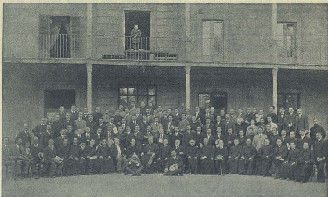
CATANIA — Ex-alumnos del Oratorio de S. Felipe Neri.