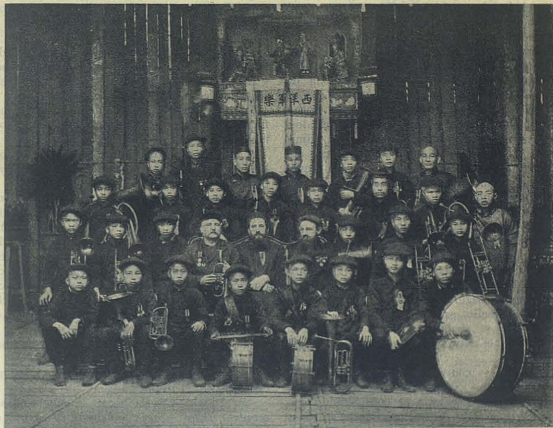
CANTÓN (China) — La banda salesiana en el bazar de beneficencia.

No obstante el cansancio que sentíamos, era preciso, por cortesía, continuar hasta la residencia del Anti-opium ; allí nos esperaba