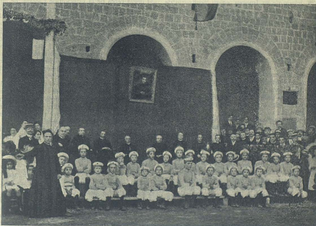
NÁPOLES — Circulo depor.tivo del Oratorio del Vómero.

ninguna de curación, y no teniendo ya la madre otro remedio, lo mandó al manicomio de Esquerdo en Carambonahe. Cuando iba á verle se volvía muerta de dolor al ver que su hijo estaba como un idiota y hacia siete meses que no abria los ojos ni la boca. Ella siempre llorando imploraba á la Virgen Maria, pidiendo la salud de su hijo á todas horas. Por fin Maria Auxiliadora escuchó sus oraciones. Un día despertó el enfermo al amanecer, abrió los ojos y se encontró desde aquel momento sano y bueno, pidiendo en el manicomio donde se encontraba pluma y papel para escribir á su madre. Puede imaginarse la alegría