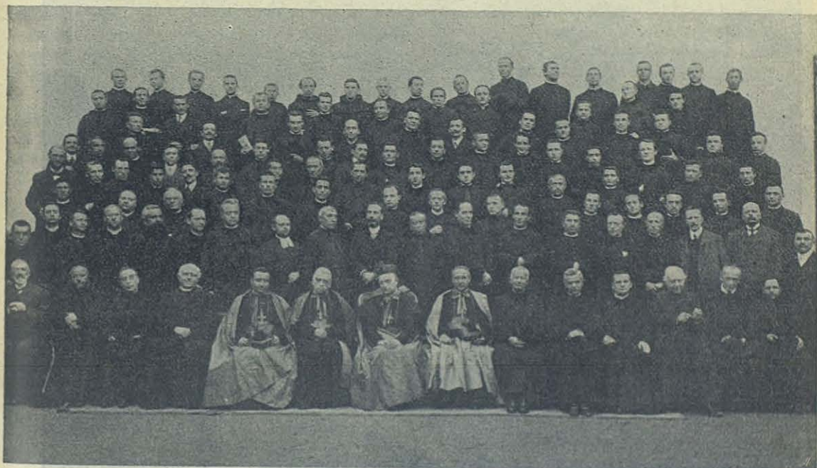
TURÍN — Los congresistas del V Congreso de los Oratorios Festivos.

Por la noche volvió á llenarse el teatrillo para la velada con que se conmemoró el jubileo episcopal de S. E. Nuestra Schola cantorum y la banda prestaron sus servicios en el solemne acto. El Sr. Cardenal, conmovido por la grandiosidad de la afectuosa manifestación, que atribuyó á la gran bondad de los iniciadores, recordó la santidad y obras de algunos de sus predecesores « que ilustraron esta arquidiócesis, decía, mucho más que yo »; y terminó diciendo que más grato