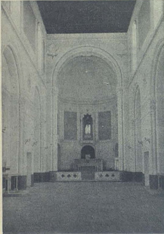
Interior de la Iglesia del Sgdo. Corazón.

El trabajo que más llama la atención de todos los visitantes, especialmente de los peritos en el arte, es el techo, feliz concepción de arte del cuatrocientos. Colocado á 15,65 m. del suelo