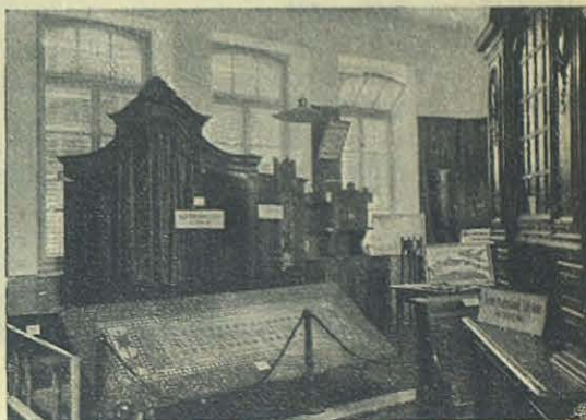
Salón 1 o — Carpinteros y Ebanistas.

las casas salesianas y las clases de Religión, moral, sociología etc..