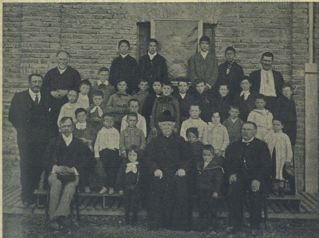
SANTA CRUZ (Arg.) — Grupo de alumnos.

No le podemos dar más ensanche y desarrollo porque vivimos aún en tres destartadas casas de alquiler que carecen de las condiciones nece-