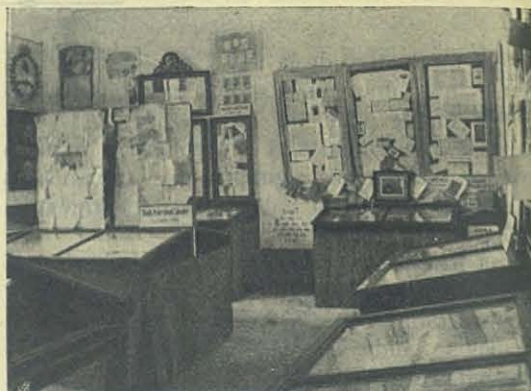
Salón 5º — Artes Gráficas,

d) un candélabro de estilo bizantino-romano, tiene la base triangular y sobre cada lado,