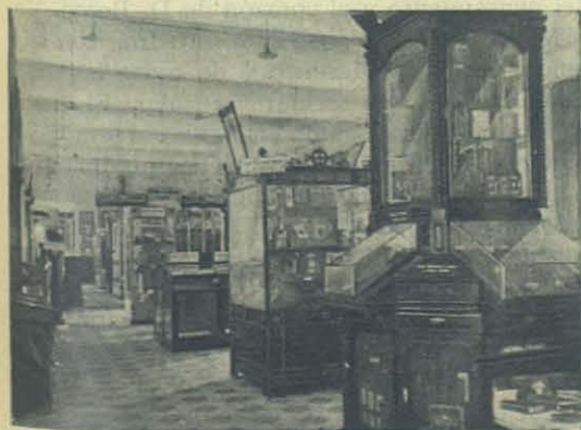
Salón de los Encuadernadores.

El taller-escuela que tal vez se lleva la palma por la altura á que ha sabido llevar á sus alumnos con un método rigurosamente pedagógico es la Encuadernación. Lo primero que se ve es el Manual , diligentemente compilado por el Maestro aunque incompleto aún. Hay luego dos hermosos y grandes libros en que constan los medios de emulación é interés para los alumnos, cuales son los concursos en trabajos, las excursiones á bibliotecas públicas y privadas; vense las fotografías de los principales trabajos y los álbumes en que consta el proceso del arte