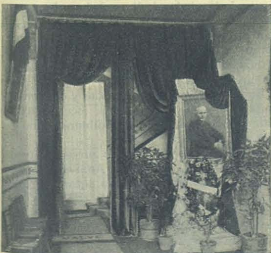
El atrio de ingreso.

Las casas salesianas que toman parte son 50 y los talleres-escuelas son los siguientes: Carpintería y ebanistería; artes gráficas: cajistas é impresores; encuadernación; sastrería, guarnicionería, zapatería, cerrajerías y mecánica, tallistas y escultura; además están las granjas agrícolas.