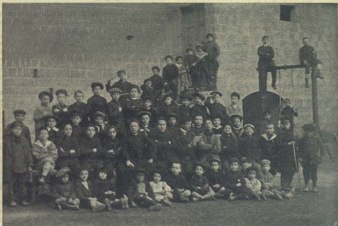
Nápoles — Grupo de oratorianos.