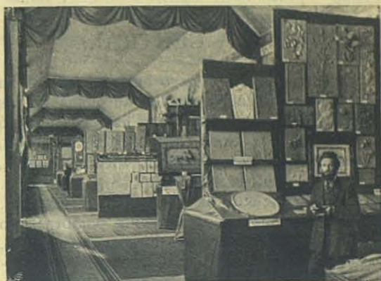
Reparto de Escultores.

nación son un misal, dos figuras y un cuadro artistico que se queria ofrecer á D. Rúa. El Misal es bizantino, en chagrín rojo y los adornos son cincelados en mosaico con piecetas de doce colores.