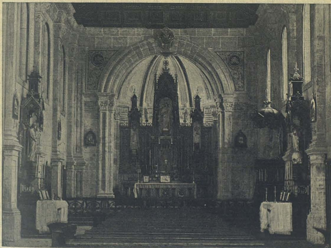
SALAMANCA (España) — Nueva capilla del Colegio Salesiano.

Pero la idea de D. Bosco no tardó en llegar á conocimiento de muchos; y hubo dignatarios eclesiásticos que, aunque benévolos para con él, le aconsejaron que desistiese de tal proyecto, ya por lo triste de los tiempos, ya por la escasez de personal, como también por la persecución suscitada contra las órdenes religiosas. D. Bosco respondía que nada era imposible para Dios, y que si la obra que él quería establecer era del Señor,