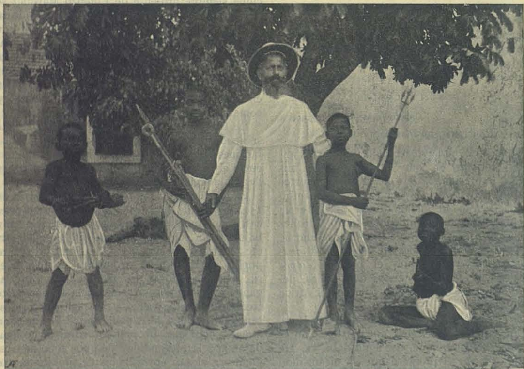
MOSCELIA (Mozambique) — Los primeros amigos del Misionero.

Partí de Joannesburg el 11 y en 48 horas de tren llegué á Capetown , en donde ya encontré de vuelta de Europa el P. Tozzi, director de nuestra casa. Todos los Hermanos están agradecidísimos á los Superiores que han acudido eficazmente en auxilio de esta casa. ¡Oh! era ya tiempo de que la obra del Venerable Bosco tuviese tam-