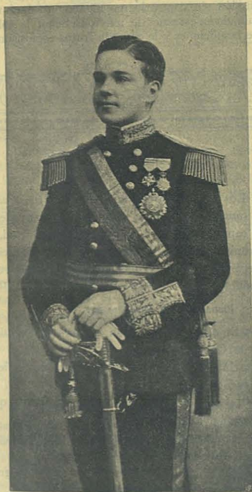
Su Majestad Don Manuel II Rey de Portugal.

Al lado del bahyto abren un foso de un metro de profundidad por dos de longitud y uno de ancho; dentro del foso colocan una estera exten-