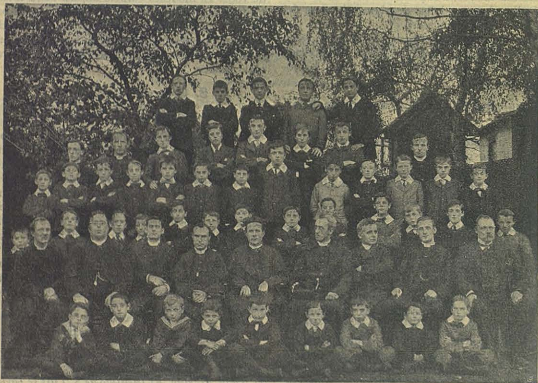
FARNBOROUGH (Inglaterra). — Superiores y alumnos del Colegio Salesiano.

b) unos selecientos son los externos que frecuentan sus escuelas diurnas;