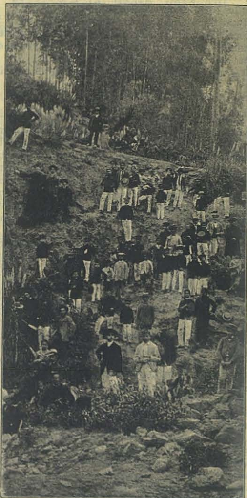
ATOCHA (Ecuador). Los alumnos del Colegio de Guayaquil durante las vacaciones.

El Boletín Salesiano honra hoy sus columnas con el retrato del Prelado y eleva oraciones á los ángeles tutelares de la Metrópoli y de las nuevas diócesis para que obtengan grandes triunfos en la fe á