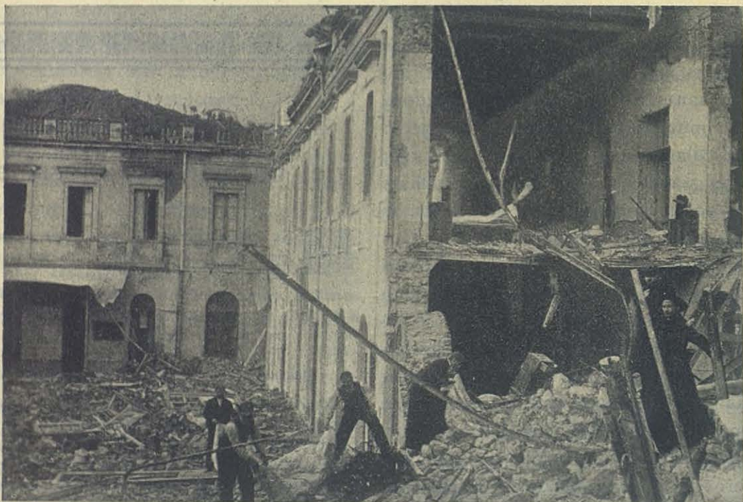
MESSINA — El Colegio S. Luis visto desde el patio.

Ante el espectáculo que nos presentan estas robustas y valiosas existencias tronchadas repentinamente, sólo hallamos consuelo en la oración y en los sublimes pensamientos que inspira aquella fe que nos enseña que honra á Dios tanto el grano de incienso que el fuego consume enteramente ante el altar, cuanto el grano que cae al suelo y ante ese mismo altar se pierde.