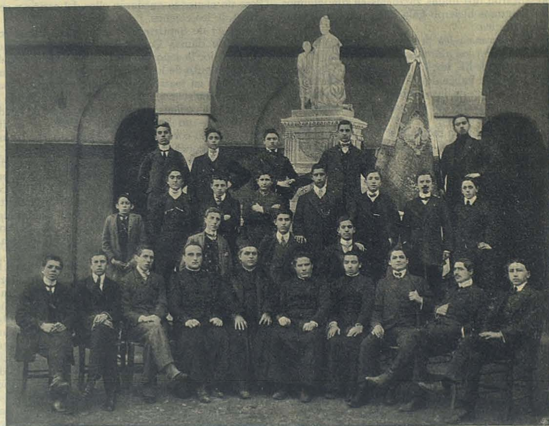
CHIOGGIA — Círculo « S. Justo ».

— No menos alabanzas merece el Colegio de María Auxiliadora , dirigido por las Hijas de María Auxiliadora.