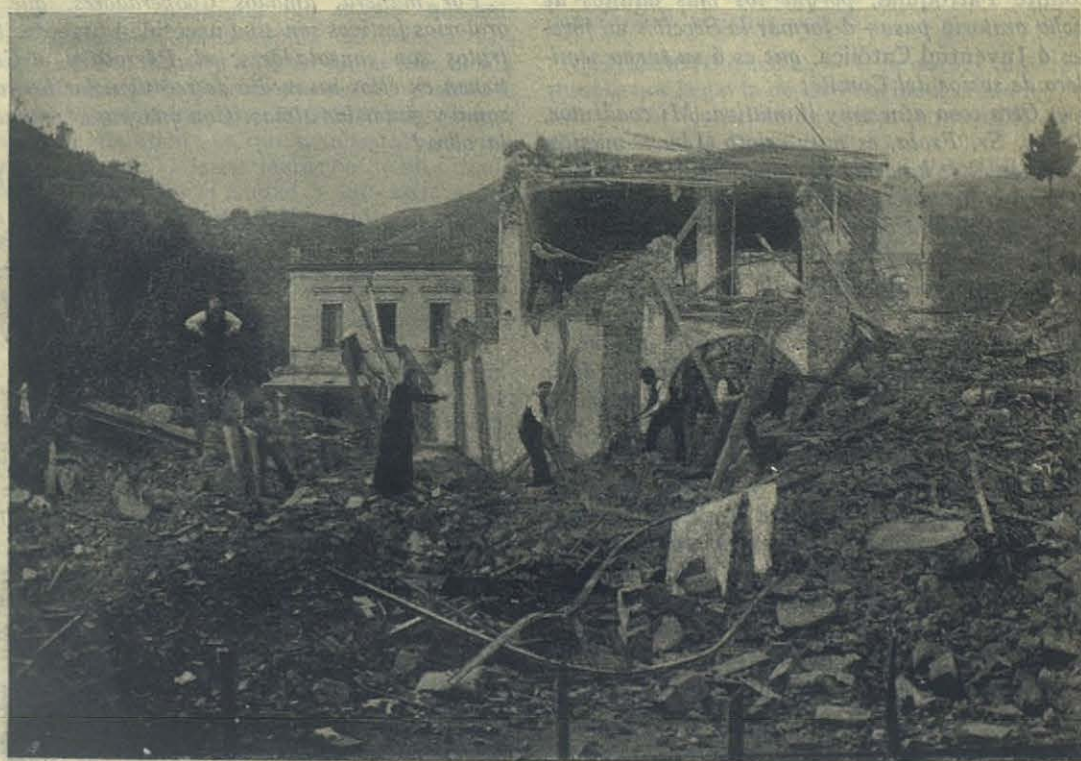
MESSINA — El Colegio S. Luis, visto desde el patio.

tigo alumno de ese Oratorio que nació y vive de la Providencia; yo, en pobre y alpestre parroquia no debía retroceder. Pedí auxilios acá y allá, pero especialmente entre los feligreses, quienes me secundaron con verdadero entusiasmo. Y el edificio necesario se levantó, y el Oratorio de mis sueños fué una realidad, y todo con limosnas insignificantes. Sí, con oblaciones de la genie del pueblo. Todo esto está perpetuado en una lápida de mármol con caracteres de oro, que se ve en el frontispicio del Instituto. En el año santo (1900), lo inauguró solemnemente S. Sia. Ilma. y Revma. Mons.