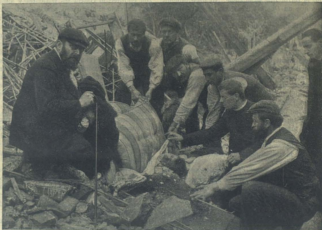
MESSINA — Entre los escombros del Colegio S. Luis.

En un principio iba á dormir á su casa; después se instaló en una tejavana; pero noté que sufría. Le dí una pieza y ahora va solamente cada quince días á su casa para llevar á su madre los ahorros hechos. Cuando está bien vestido, va á la iglesia. Ya reza el padrenuestro y ave-maría, y está deseosísimo de hacerse católico. Un día me propuse probar su obediencia y valor.