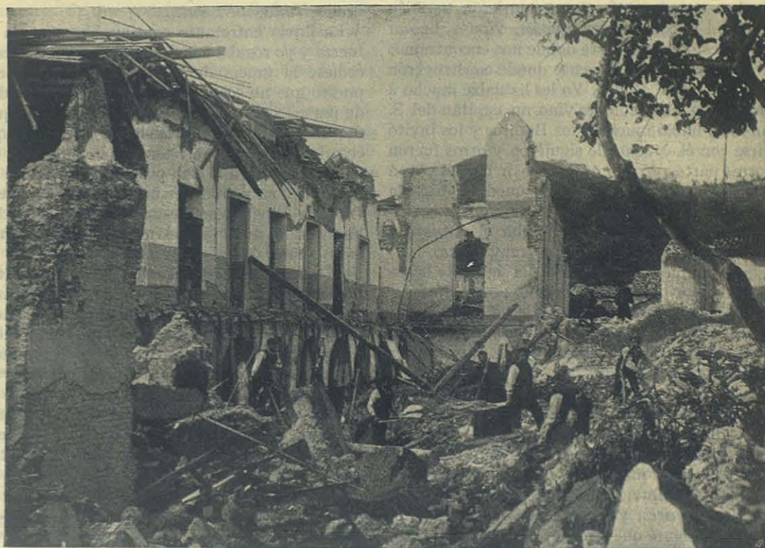
MESSINA — El Colegio S. Luís, visto desde la colina